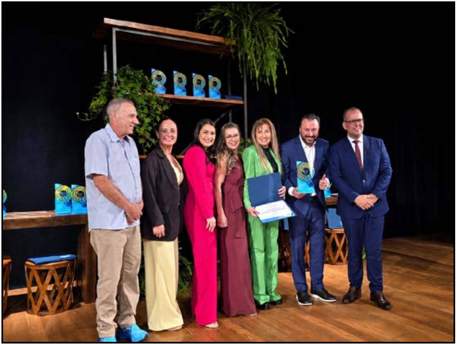
Sorriso foi destaque em âmbito regional/Centro-Oeste, com pontuação de 98,3%

Segundo ela, neste ano, o Município foi convidado para a cerimônia de premiação referente aos dados encaminhados durante o exercício de 2025, consolidando