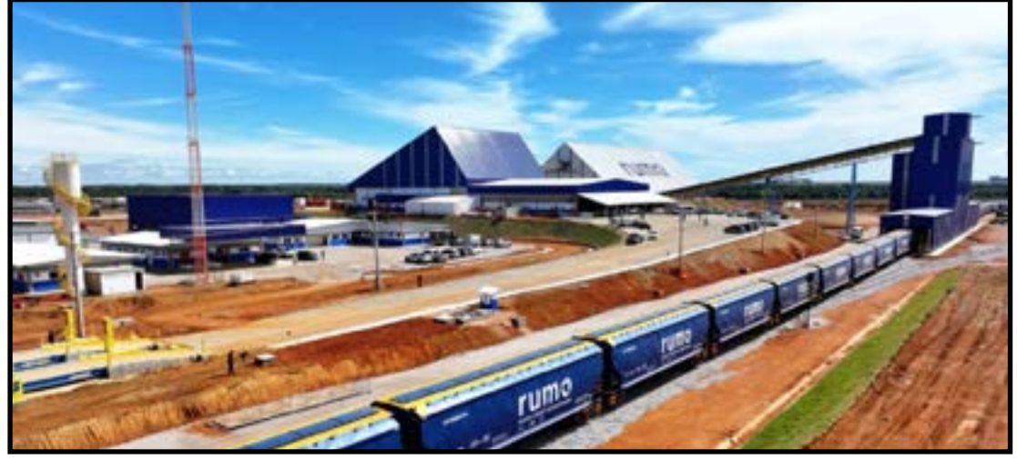
Inauguração de trecho da Ferrovia Estadual