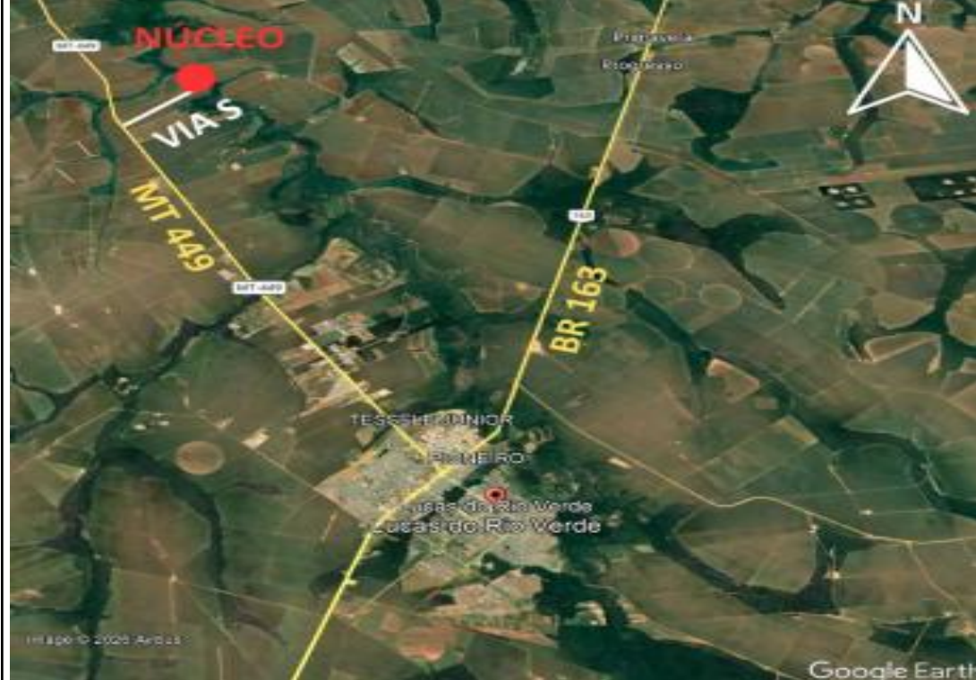
Figura 01 – Área a ser regularizada do Núcleo Informal Águas do Rio Verde.

Frisa-se que os proprietários confrontantes supracitados estão em lugares incertos e não sabidos. Desta forma, estando em termos, expediu-se o presente edital para notificação dos mesmos, advertindo-se que, não apresentada a discordância perante o Município de Lucas do Rio Verde/MT, localizado no Paço Municipal, Avenida América do Sul, 2500-S, Parque dos Buritis, CEP: 78466-153, em até 30 (trinta) dias subsequentes ao decurso do prazo do edital publicado, implicará em concordância e a perda de eventuais direitos sobre a área objeto da REURB. Será o presente edital, por extrato, nos jornais de grande circulação local e no Tribunal de Contas do Estado do Mato Grosso.