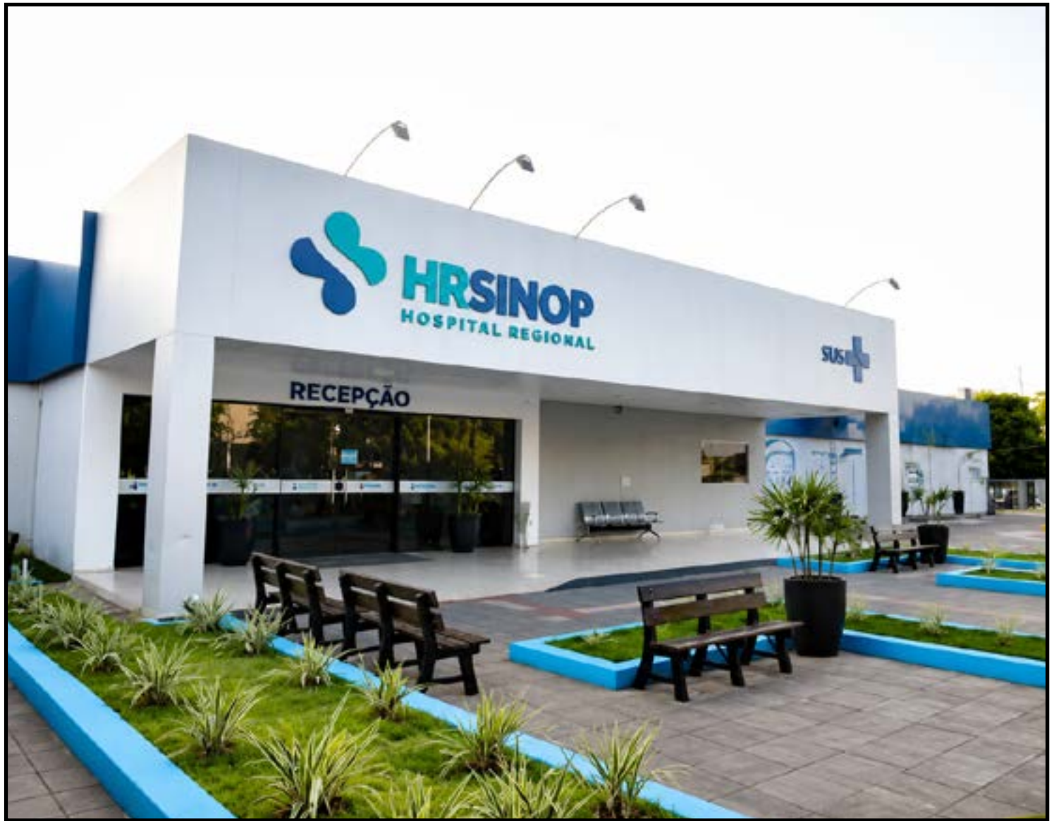
Decisão suspende contrato de R$ 321 milhões em Sinop