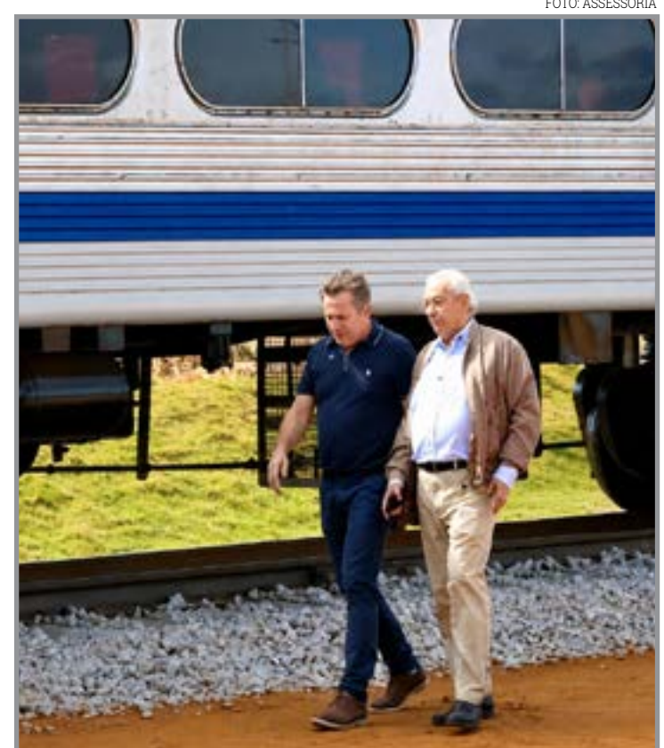
Ex-governador prega respeito em meio a disputa