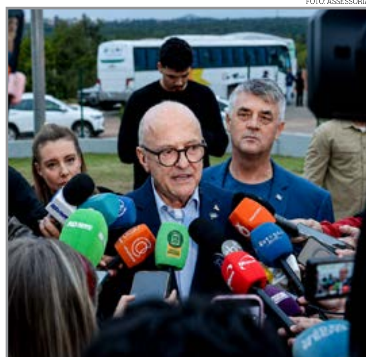
Governador diz desconhecer articulação nacional envolvendo Rep. e PL

Grosso, Pivetta disse não ter conhecimento de qualquer movimento nesse sentido e avaliou que, em período pré-eleitoral, especulações acabam fazendo parte do cenário político. "Toda ajuda é bem-vinda, mas eu não estou sabendo de nenhuma articulação nesse sentido. Neste período surgem muitas informações e comentários, mas não tenho conhecimento de qualquer negociação envolvendo essa hipótese", afirmou. Apesar de negar informações sobre os bastidores, o governador fez elogios ao chefe do Executivo paulista e destacou a relação política construída entre ambos ao longo dos últimos anos. "O governador Tarcísio conhece Mato Grosso, acompanha o trabalho que estamos realizando e temos uma rela-