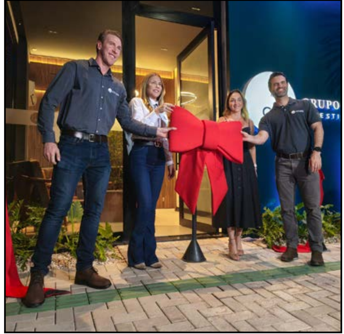
GCI amplia atuação em um dos principais polos produtores do país

Além do produtor rural, o Grupo Ceres pretende atender revendas, indústrias, empresas da cadeia agroin-