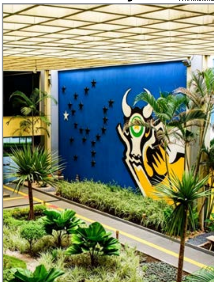
Receita estadual cresce quase 5% no ano e pode superar R$ 47 bi

A discussão sobre a elaboração do orçamento deve ganhar força nos próximos meses, durante a tramitação da proposta orçamentária para 2027, quando deputados voltarão a analisar as projeções de arrecadação apresentadas pelo governo e a forma como os recursos públicos serão distribuídos entre as diversas áreas da administração estadual.