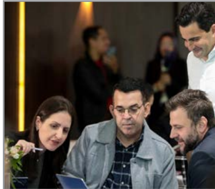
Prefeito e secretários participaram de encontro regional em Cuiabá

“Nós encaminhamos todas as demandas por meio da Diretoria Regional de Educação e dos sistemas utilizados pela Secretaria de Estado. Viemos acompanhar esse processo e aguardamos a definição dos investimentos que poderão contemplar Colíder. A expectativa agora é que o prefeito possa assinar os convênios assim que forem liberados”. O encontro reuniu representantes dos 17 municípios do Vale do Teles Pires e