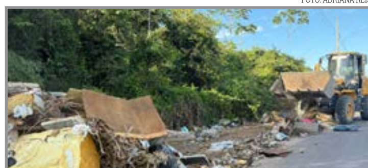
Limpeza urbana em bairros