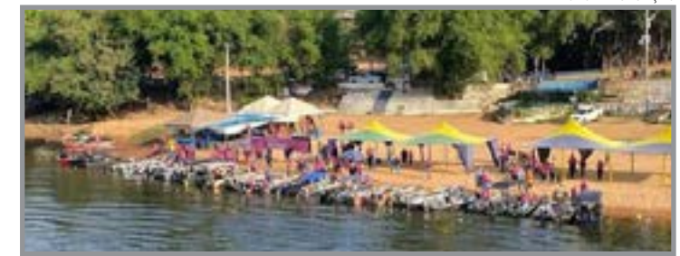
Evento começa no próximo dia 8 de agosto