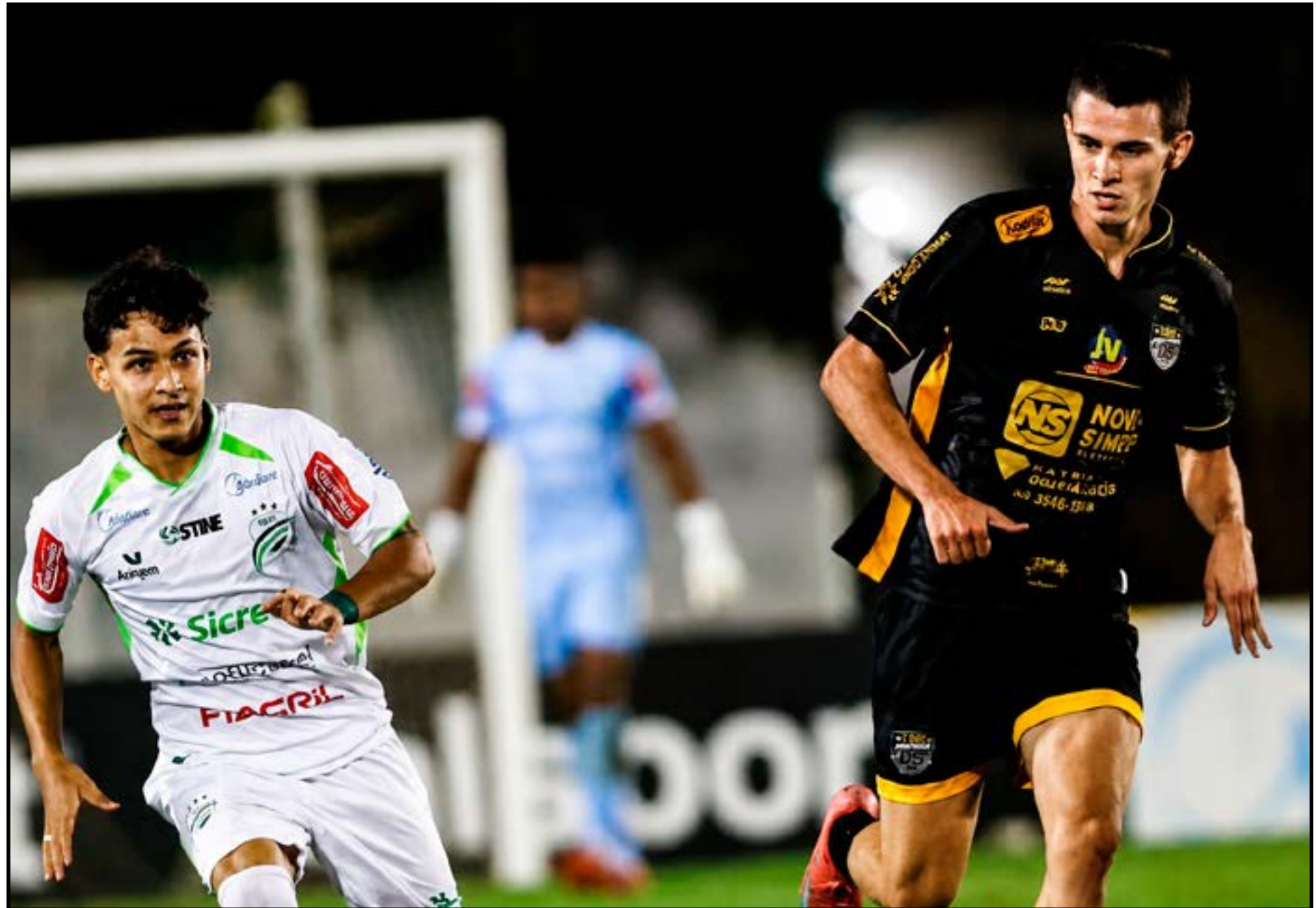
Sport Sinop e LEC ficaram no 2 a 2

No Grupo A, o Uirapuru lidera com 12 pontos em 5 jogos, seguido do Vila Aurora com 9 (o União poderia chegar aos mesmos 9 pontos). Já no Grupo B, o Cacerense encerrou a primeira