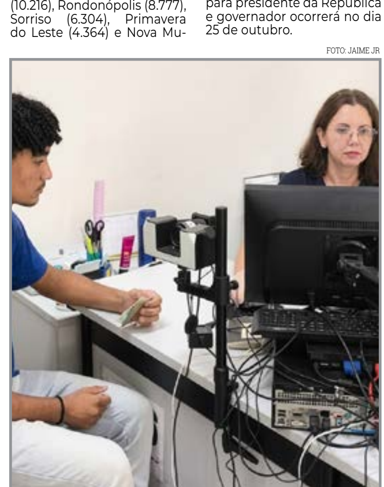
Eleitorado cresce e muda cenário político