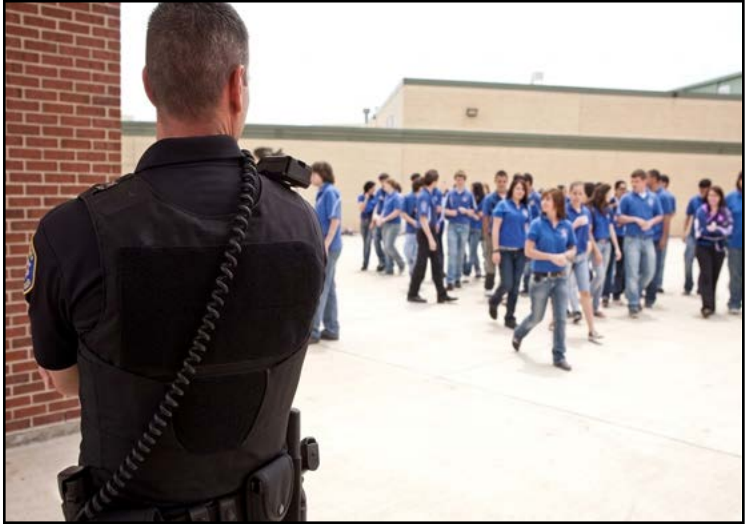
Norma prevê planos de segurança e atendimento multidisciplinar

Segundo a parlamentar, a proteção aos estudantes vai além da instalação de equipamentos de segurança e exige ações integradas