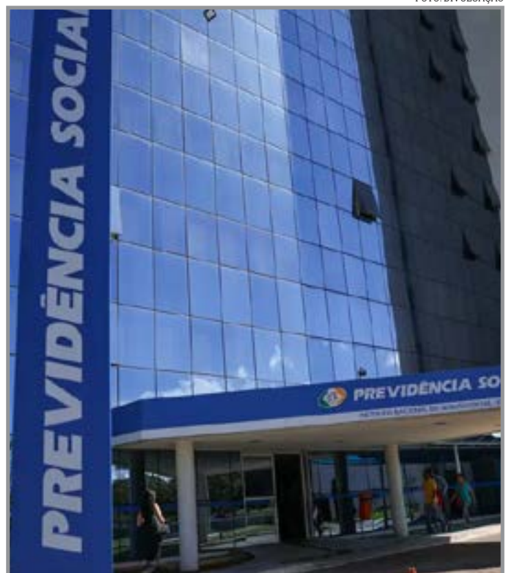
Reclamações por demora recuam 44% e concessões batem recorde

Os indicadores apresentados também mostram queda nas reclamações relacionadas à demora na análise