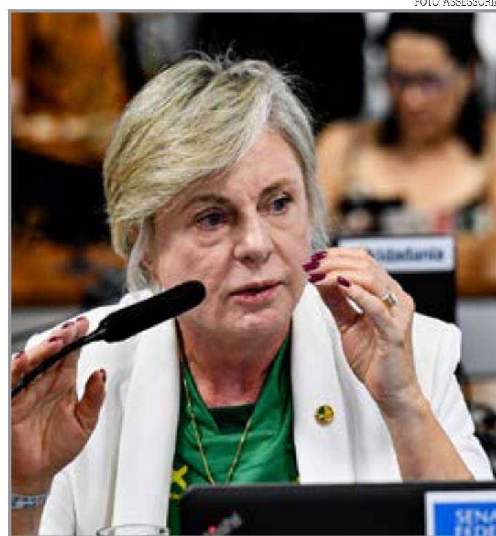
Senadora diz que ataques internos enfraquecem a direita