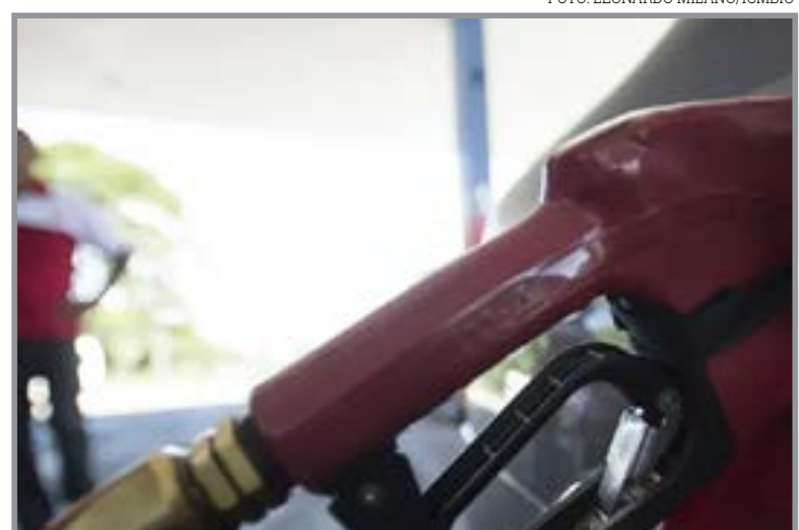
Retirada gradual dos benefícios busca preservar equilíbrio das contas públicas

A equipe econômica afirma que a retirada gradual dos benefícios também busca preservar o equilíbrio das contas públicas. A expectativa é que, se o petróleo continuar em patamares mais baixos, os demais subsídios também sejam reduzidos nas próximas semanas.