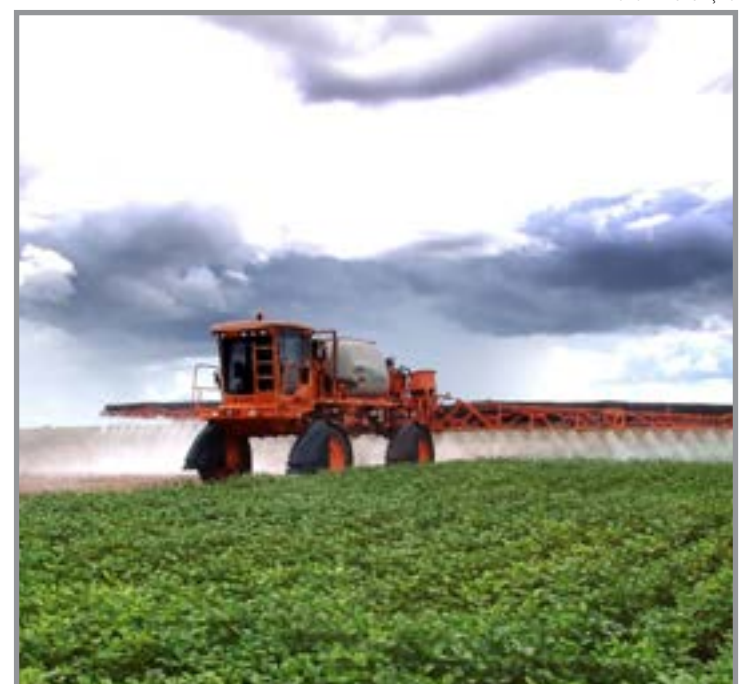
Brasil importou US$ 4,28 bilhões em defensivos químicos entre janeiro e maio

Nos cinco primeiros meses de 2026, esse segmento movimentou aproximadamente US$ 471 milhões, com volume de 112 mil toneladas, mantendo a liderança tanto em valor quanto em quantidade importada, apesar da retração em comparação com 2025.