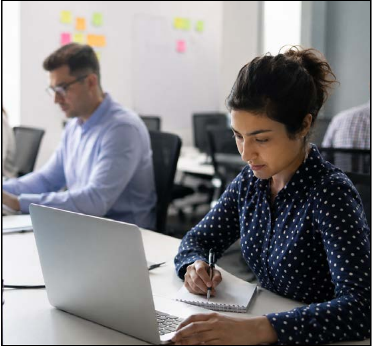
Suspensão da norma por 3 meses

Ela serve como base para todas as outras NRs e determina o Gerenciamento de Riscos Ocupacionais (GRO); exige que as empresas identifiquem, analisem, controlem e previnam os riscos presentes no ambiente de trabalho. Programa de Gerenciamento de Riscos (PGR): é o documento onde a empresa deve registrar todas as medidas de prevenção adotadas. Regras para treinamentos: Define como devem ser as capacitações (presenciais, online ou mistas) dos trabalhadores em segurança.