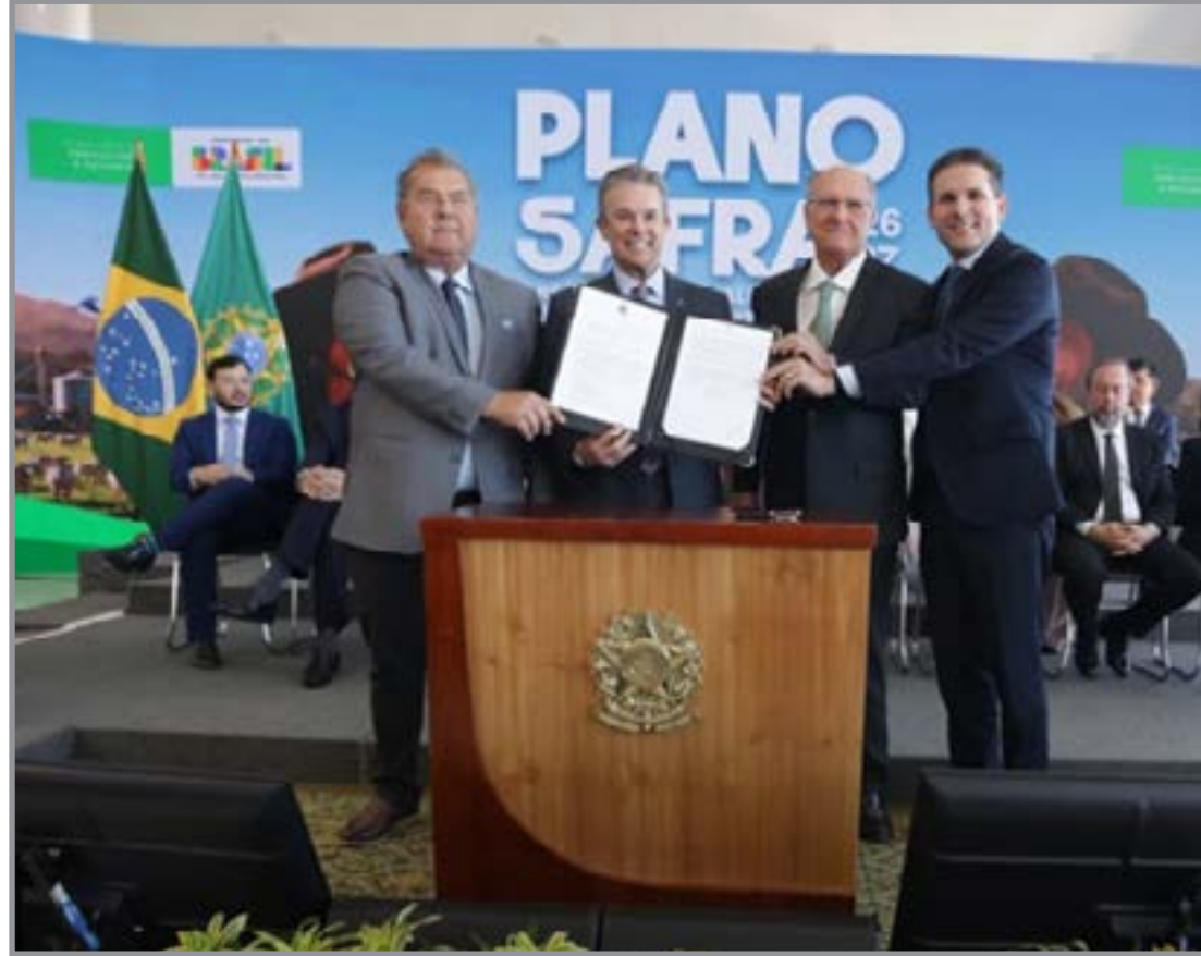
Programa Brasil-Bolívia-Pacífico cria corredor de exportação via Oceano Pacífico

Além da estruturação dos corredores logísticos, o