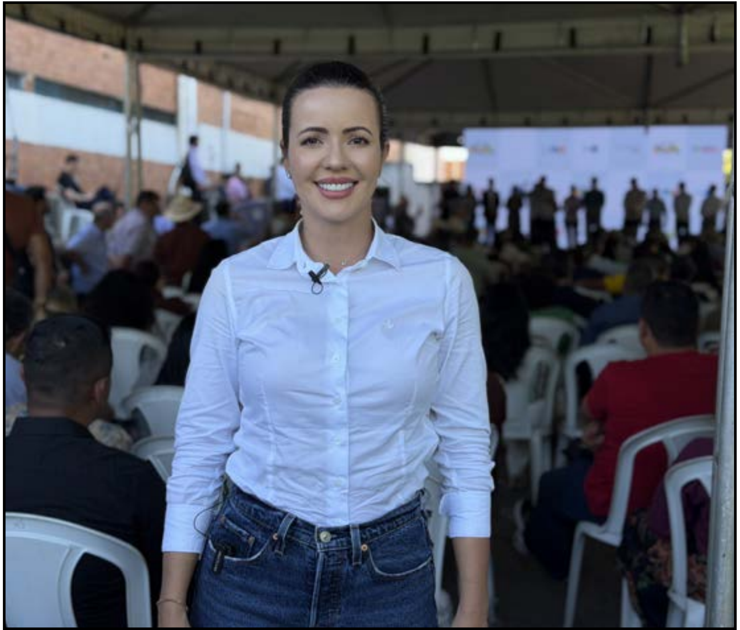
Ex-vereadora por Colíder participou de entregas

A cerimônia, realizada terça, marcou mais uma etapa da entrega de equipamentos destinados aos municípios mato-grossenses, com investimentos voltados ao fortalecimento da infraestrutura pública e ao desenvolvimento regional.