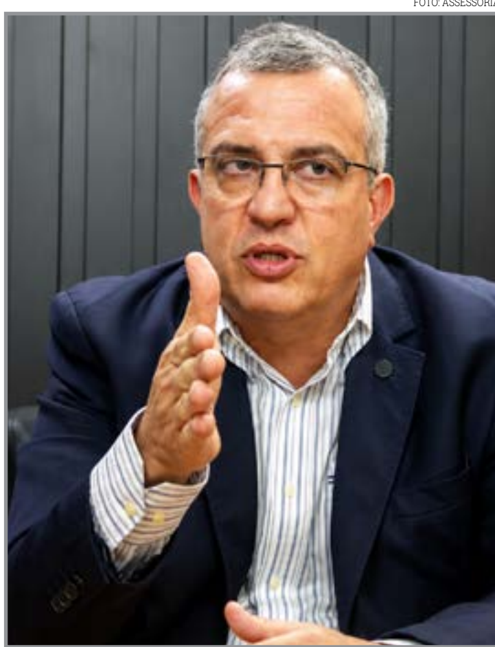
Inteligência artificial será usada para rastrear recursos suspeitos

O corregedor acrescentou que o financiamento de candidaturas com recursos oriundos do crime organizado configura abuso de poder econômico e será alvo de fiscalização permanente ao longo de todo o processo eleitoral.