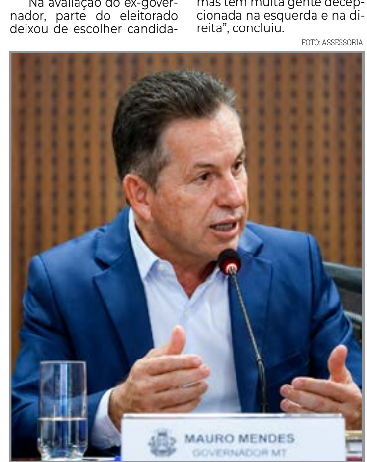
Para o ex-governador há insatisfeitos nos dois campos ideológicos