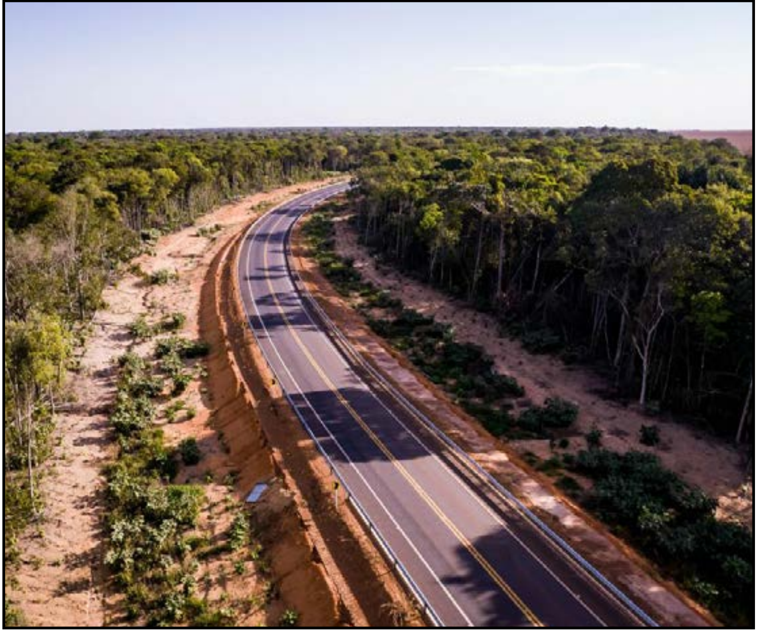
7 mil km de rodovias