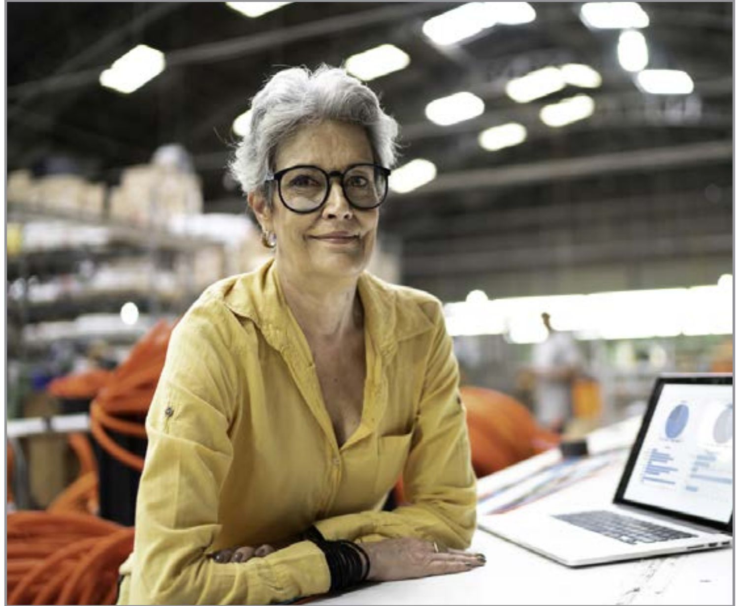
Impulsionar a produção, reduzir desperdícios e aumentar a competitividade

"A competitividade da indústria está diretamente ligada à sua capacidade de produzir melhor, com mais eficiência e menos desperdícios. O 'Brasil Mais Produtivo' tem mostrado que, independentemente do porte da empresa, sempre existem oportunidades de melhoria capazes de gerar resultados