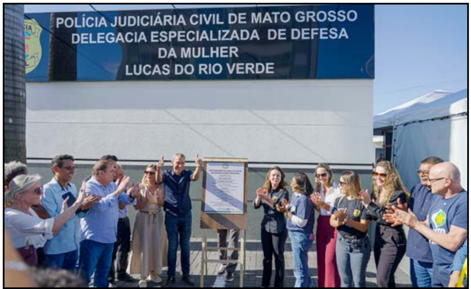
Ampliação do atendimento especializado no interior do Estado

Na mesma agenda, o Governo do Estado entregou oficialmente a nova Escola