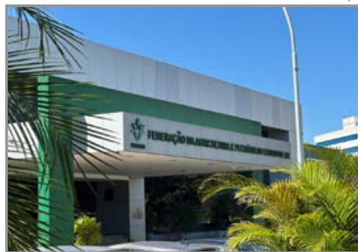
Famato orienta produtores sobre a aplicação da UPF no recolhimento das contribuições

A Famato alerta que produtores rurais, empresas, contadores e demais profissionais envolvidos na apuração das contribuições devem observar a mudança para evitar divergências nos cálculos e no recolhimento.