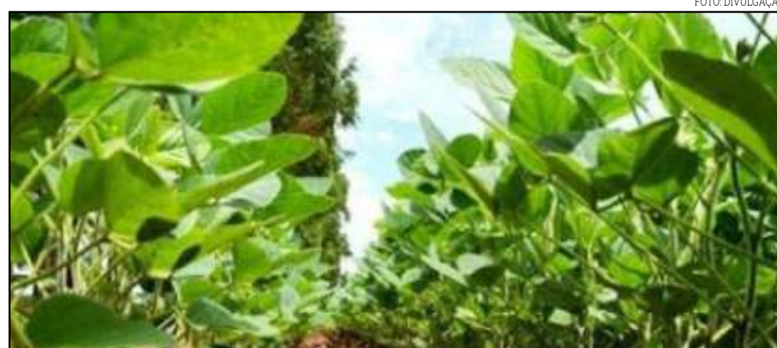
Momento ainda é oportuno para quem precisa adquirir os insumos

De acordo com o Instituto "o preço médio comercializado da soja em fevereiro/20 para a safra 2020/21 foi de R$ 74,45/sc, o que demonstra uma alta de 3,46% em relação ao mês anterior. Já o preço médio do fertilizante 00.18.18, muito utilizado no manejo da cultura, aumentou 4,83% no período. Com isso, a relação de troca a prazo safra (barter) ficou