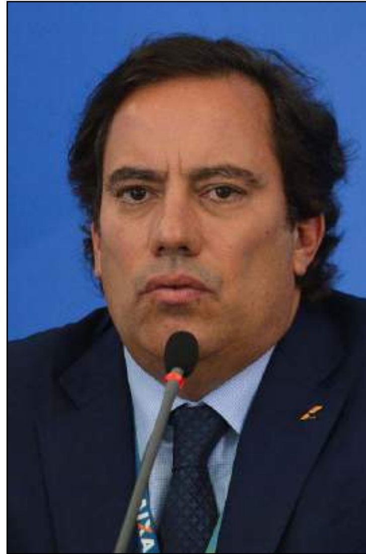
Medidas representam R$ 43 bi em recursos no mercado imobiliário