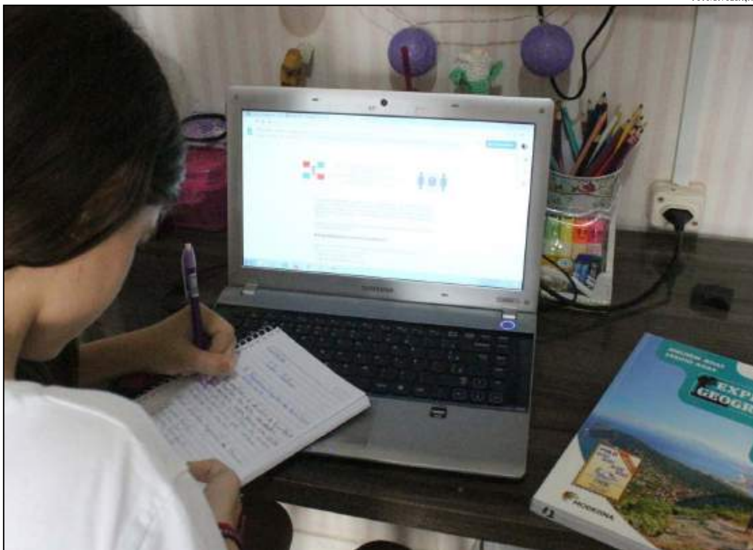
Aulas virtuais começam na segunda-feira (13)

Em meio ao avanço da pandemia, o governo federal determinou que as instituições de ensino estão isentas de cumprir o mínimo de dias letivos, mas manteve a carga horária necessária para completar o ano de estudo. Uma das formas de atender esta previsão é adotar a educação a distância, seja pela TV, pela internet, ou ainda adaptando trabalhos escolares escritos para aqueles que não têm acesso à tecnologia.