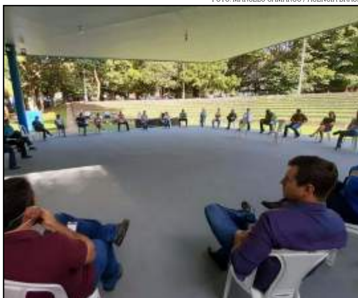
O transporte coletivo retorna na segunda (13)

O transporte coletivo deverá retornar na segunda-feira (13). Todos os ônibus serão higienizados e os pas-