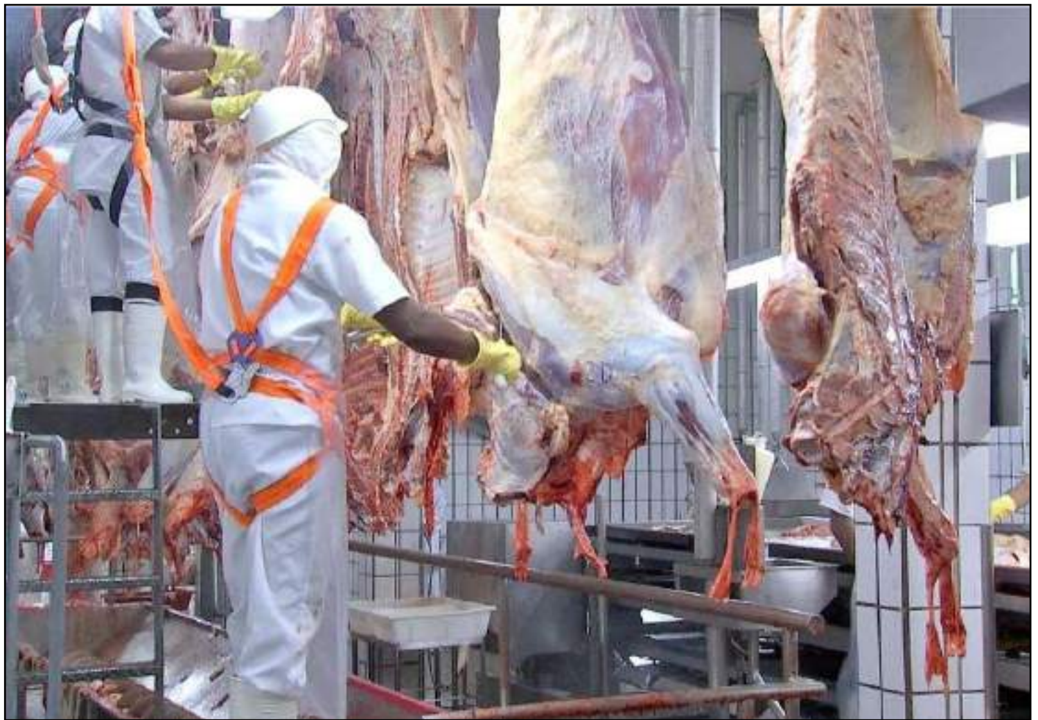
Em contrapartida, as exportações avançaram

Na contramão do cenário do mercado interno, as vendas de carne bovina para fora do país seguem firmes – apesar dos reflexos causados pelo novo coronavírus. Durante o mês de março, os embarques de carne bovina "made in MT" para outros países somaram 37,55 mil toneladas (equivalente carcaça), salto de 14,05% na comparação com fevereiro. As vendas foram puxadas principalmente pelo mercado chinês (China + Hong Kong). Segundo o Imea, as vendas para o país asiático cresceram 16,49% e passaram a representar nada menos que 51,75% das exportações da carne bovina mato-grossense.