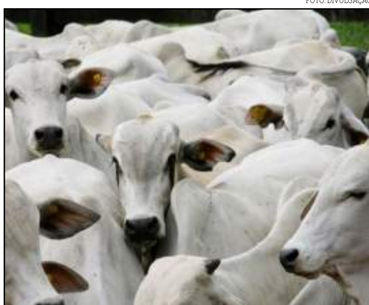
Alta foi de 11,4% no acumulado de 2020

Pontualmente, devido às incertezas do mercado do boi gordo em função da pandemia do coronavírus, e como o período de quarentena refletirá no consumo de carne no mercado interno, o cenário na reposição no estado está em compasso de espera. A expectativa é de estabilidade, tendo em vista a baixa movimentação, no entanto, a oferta restrita de animais é um importante fator de sustentação dos preços dos animais de reposição.