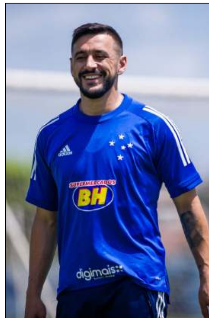
Cruzeiro deixou a Arena do Grêmio carregado deste ano