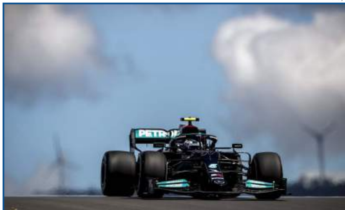
Valtteri Bottas no GP de Portugal de 2021

A zona DRS existente também foi reduzida em comparação com o evento