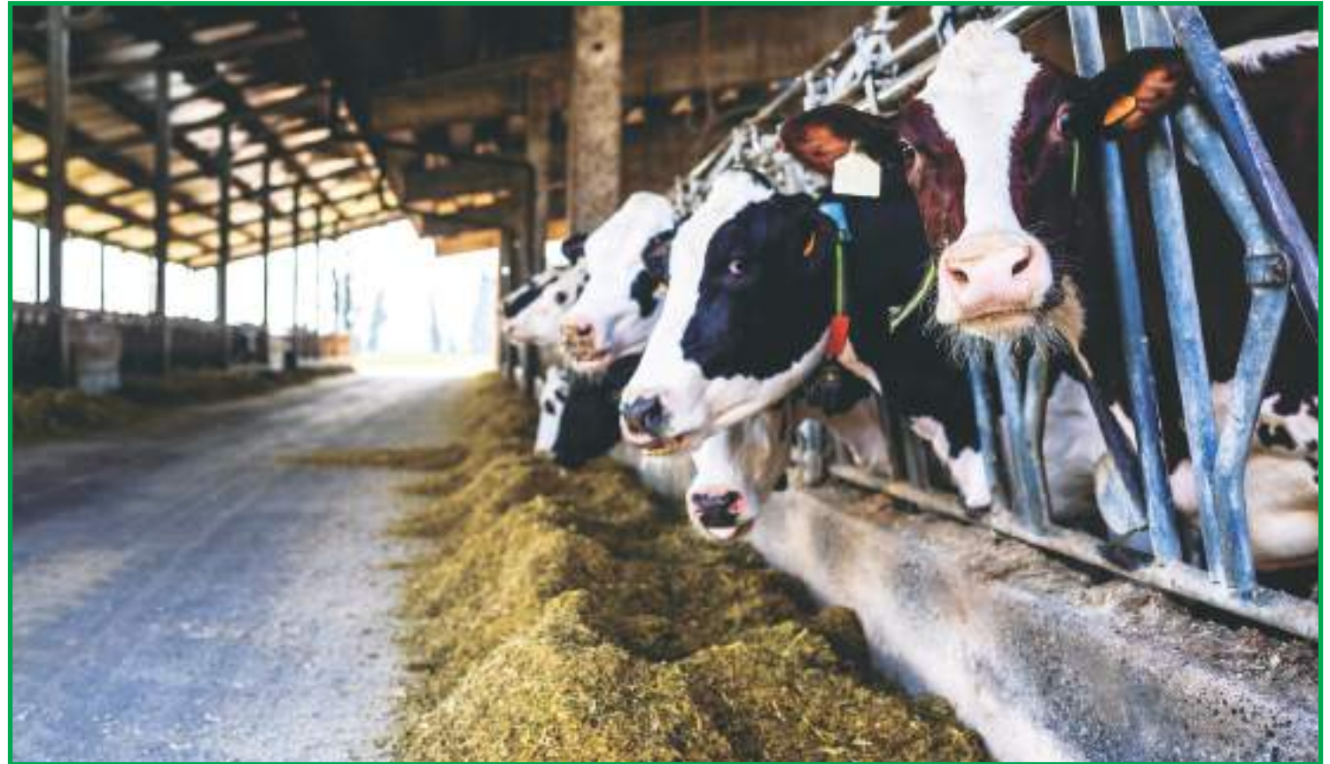
Avanço da entressafra é um fator de desequilíbrio entre oferta e demanda

Nesse contexto, as indústrias tentaram repassar as altas nos preços dos lácteos negociados. A pesquisa do Cepea realizada com apoio financeiro da OCB (Organização das Cooperativas Brasileiras) mostrou que os preços médios mensais do leite UHT e do leite em pó negociados junto ao atacado de São Paulo subiram 7,5% e 7,6%, res-