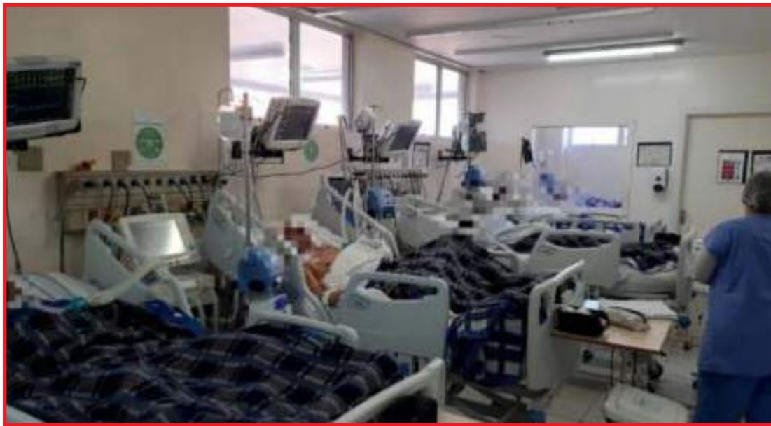
Dados são referentes até domingo

De acordo com boletim da Secretaria de Estado de Saúde (SES-MT) divulgado no domingo (2), foram confirmadas 35 mortes e 482 novos casos em 24 horas. Só a Baixada Cuiabana concentra 33% da população, isso porque além de Cuiabá conta com Várzea Grande, que são