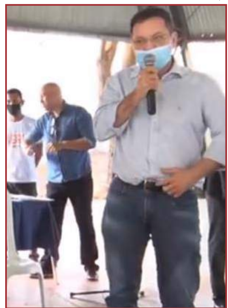
Programa é alívio à população que enfrenta a pandemia

(CIB), colegiado que oficializa o quantitativo de doses a ser destinado para os 141 municípios. O Estado de Mato Grosso já recebeu 836.260 doses de imunizantes contra a Covid-19 e aguarda a chegada da nova remessa.