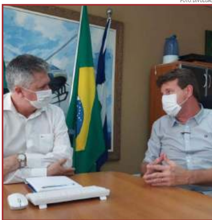
Pedido foi reforçado durante reunião na Secretário de Segurança Pública

Outro assunto questionado pelo chefe do executivo municipal, foi sobre a possibilidade de implantação da Patrulha Rural da Polícia Militar em Sorriso. "Estamos aqui fazendo gestão para que a Patrulha Rural seja implantada em Sorriso, pois já temos uma estrutura do próprio Ciopaer, que conta com um centro de operações, que pode atender toda a região", enfatizou.