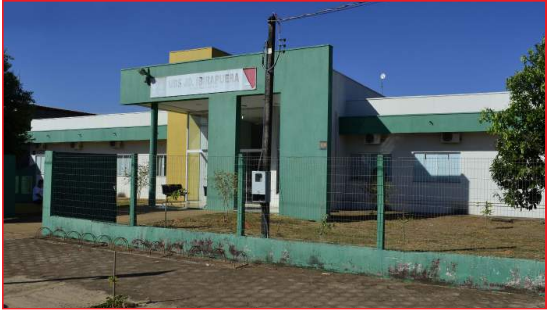
Ajustes entre unidades foram feitos para melhor atender ao município

As vacinas de rotina não foram suspensas em