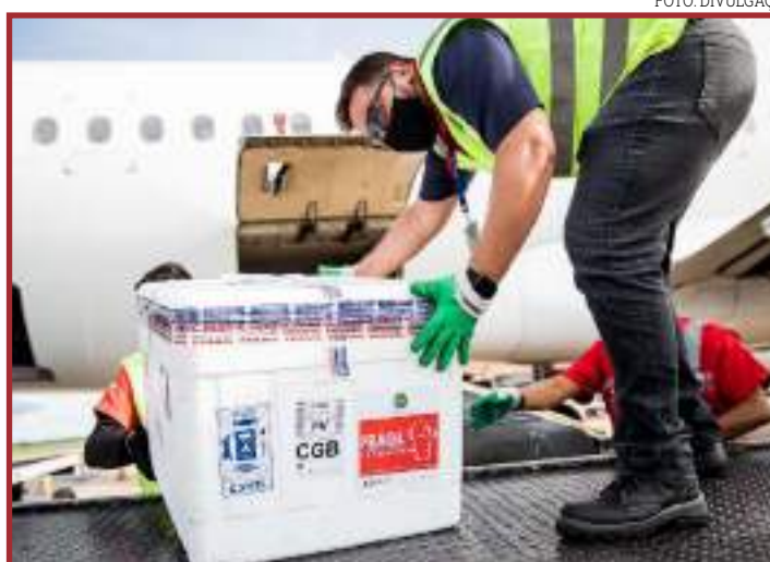
Estado já recebeu 836,2 mil doses de imunizantes

Simultaneamente à operação logística, as equipes administrativas trabalham na resolução da Comissão Intergestores Bipartite