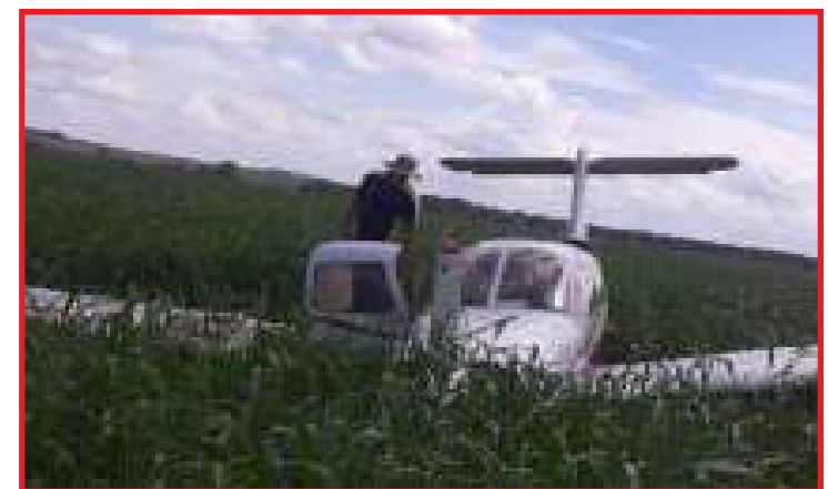
Aeronave pousou em uma fazenda próximo da MT-220