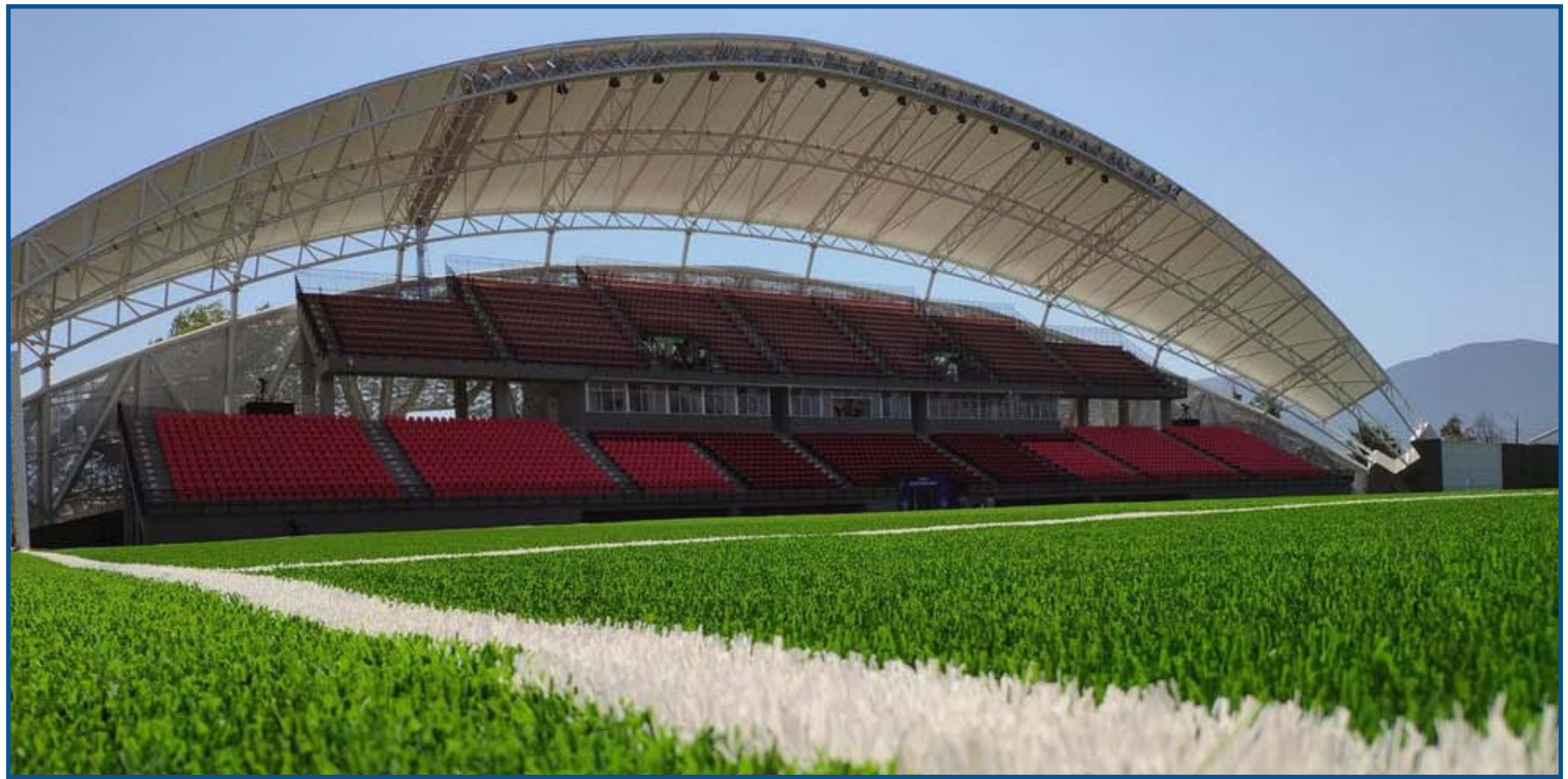
Estádio Nicolás Chahuán Nazar, palco do jogo com o Unión La Calera

A delegação rubro-negra desembarcou em Santiago e seguiu de ônibus para Viña del Mar, palco da partida. Ontem o elenco trei-