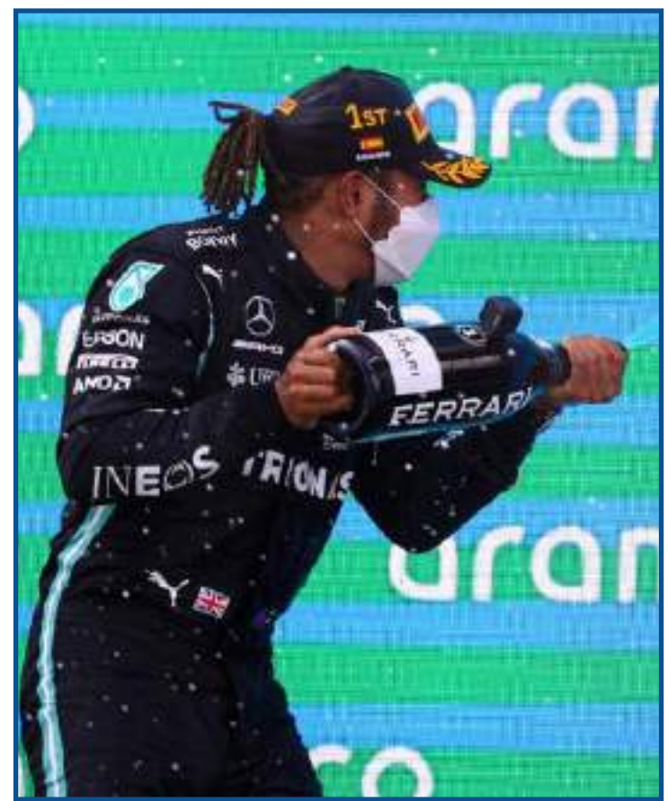
Hamilton joga champanhe em Verstappen no pódio