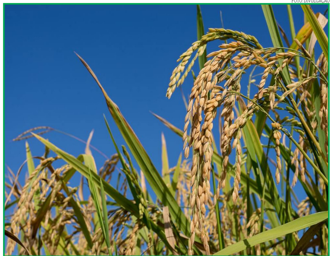
Arroz e feijão são destaque segundo diretor de comercialização

Especificamente para o trigo, estimativas preliminares indicam uma área de 2,5