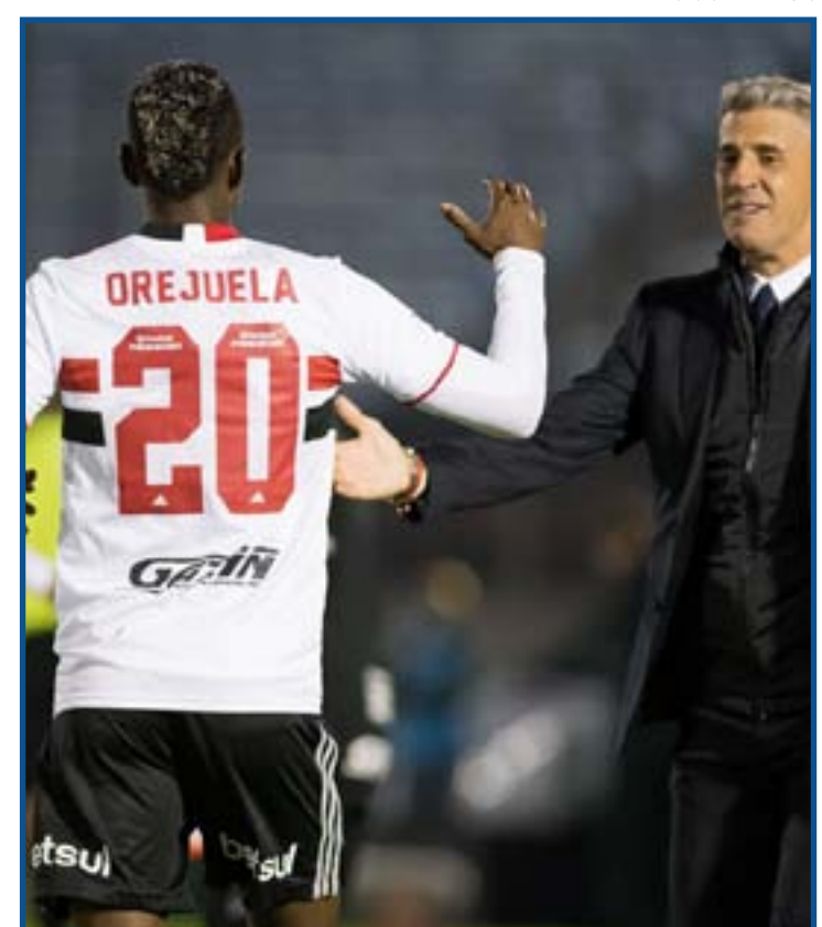
Hernán Crespo escalou reservas no Uruguai

Sorriso x Cáceres, Ação x Dom Bosco, Mixto x União, Vila Aurora x Santa Cruz e Cuiabá x Atlético.