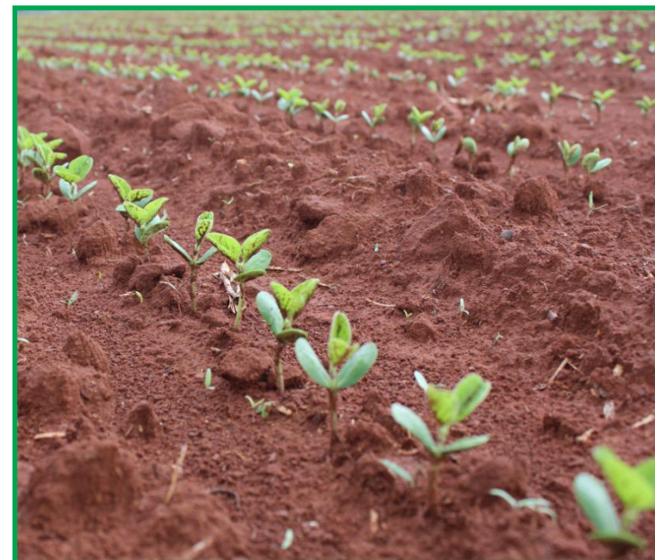
Comercialização avançou 4,7 pontos percentuais no período

Em relação ao milho que só vai ser plantado e co-