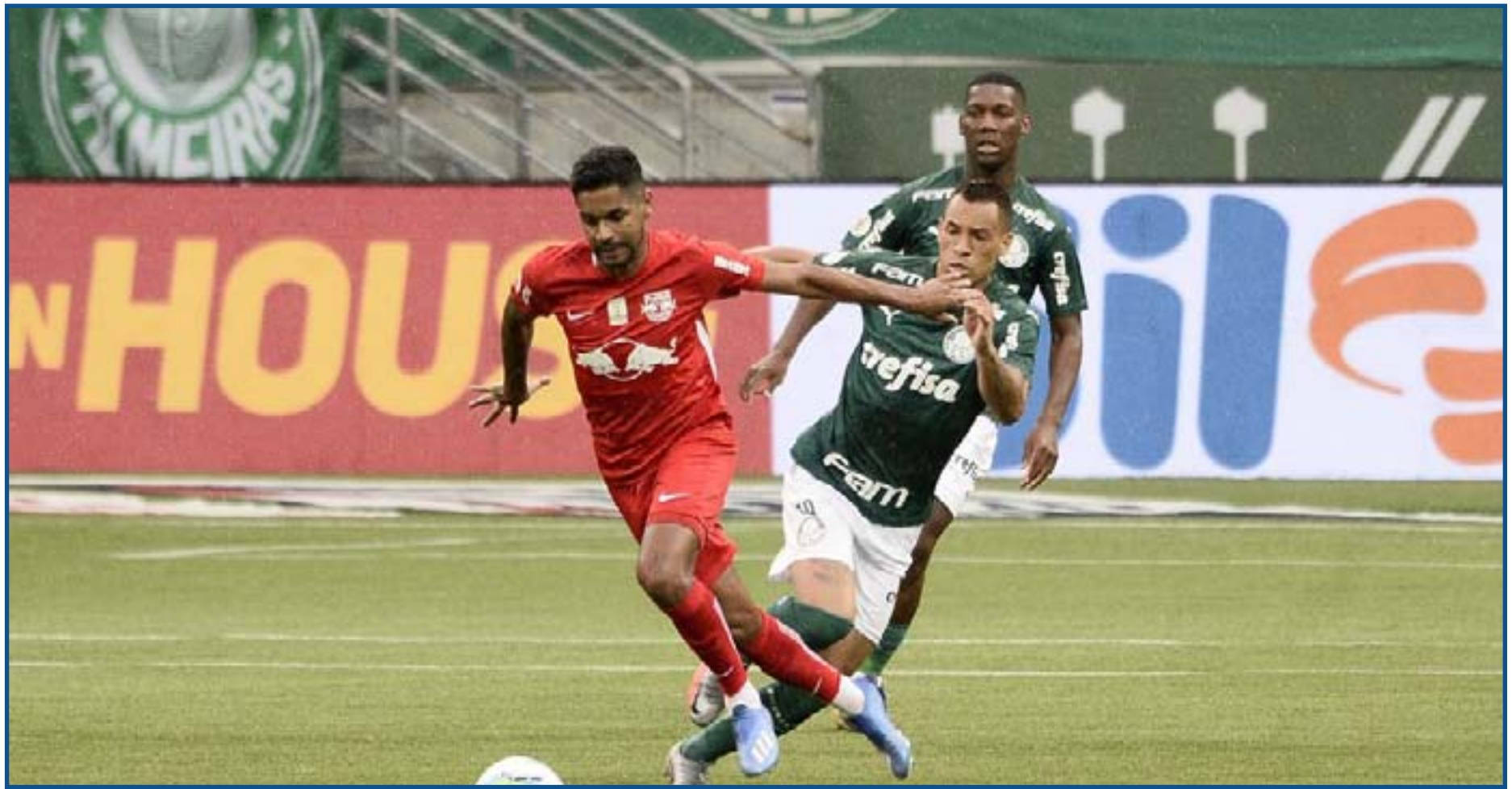
Bragantino e Palmeiras disputam vaga na semifinal do Paulistão 2021

O Bragantino tem a vantagem de jogar em casa por ter feito melhor campanha na primeira fase. O Massa Bruta foi o líder do Grupo C, com 23 pontos, e o Palmeiras ficou em segundo, com 21. As quartas de final são disputadas em jogo único. O Corinthians já avançou após vencer a Inter de Limeira por 4 a 1 na terça-feira.