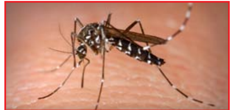
Acompanhamento dos vigilantes permite detectar focos e combater com precisão