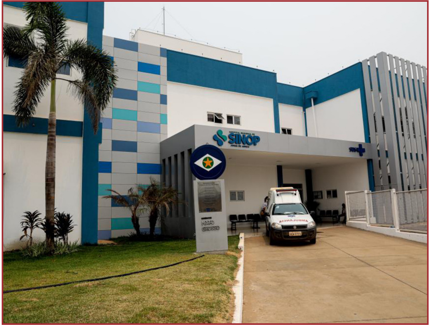
A suspensão temporária poderia levar ao colapso do sistema de saúde

A definição, segundo o Estado, se deve ao não cumprimento de normas e requisitos técnicos por parte da empresa Organização Goiana de Terapia, que é responsável por gerir os leitos. Não há previsão para ocorrer a reativação dos leitos. Foi dado um prazo de 15 dias para que se cumpra a decisão e o governo se manifeste abstando-se do fechamento dos leitos.