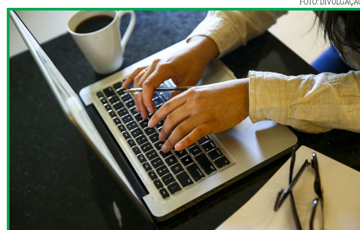
Pesquisa da Serasa Experian ouviu 508 empresas

Na pesquisa, os entrevistados revelaram ainda que a venda online ajudou a atingir públicos diferentes (51% das respostas mencionaram isso), criou mais exposição para o seu negócio (44,8%) e permitiu atingir novas regiões (34,5%). A pesquisa também mostrou que 24,8% dos empreendedores têm buscado empréstimos e financiamentos para manter seus negócios. Dentre as empresas que mais requisitaram empréstimos ou financiamentos estão as do setor de comércio (38,1%).