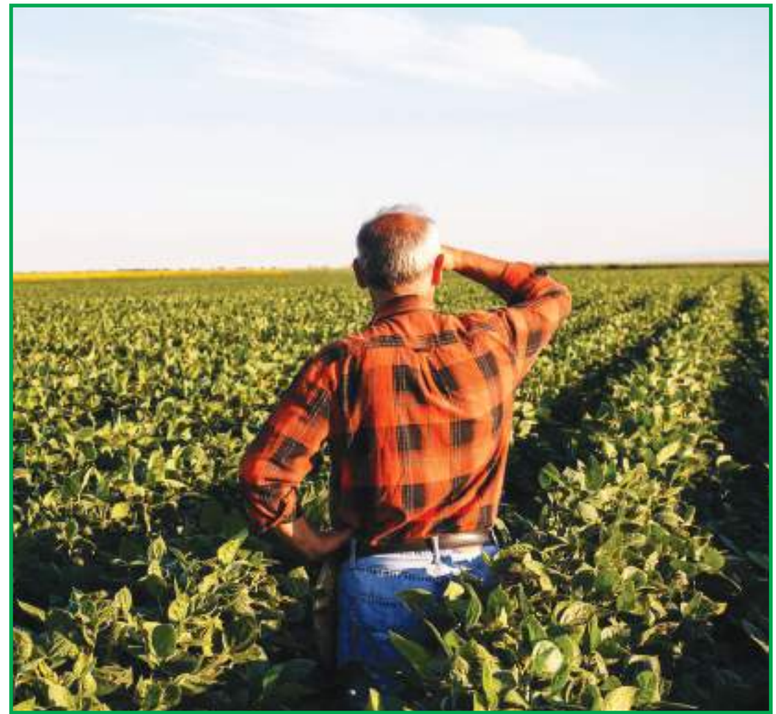
Valorização das principais commodities refletiu no custo do arrendamento

O setor produtivo também faz um alerta: a disputa eufórica também pode trazer consequências aos proprietários de terras. "A gente tenta conscientizar aqueles proprietários que arrendam estas terras para que pensem no amanhã. Estão querendo pagar muito e não vai ser mesma coisa, tomara que não aconteça de preços ruins, então a fidelidade com esse arrendatário que até hoje vem plantando, plantou naquelas épocas ruins e aguentou uma renda para esse proprietário de terra. É importante que ele dê um