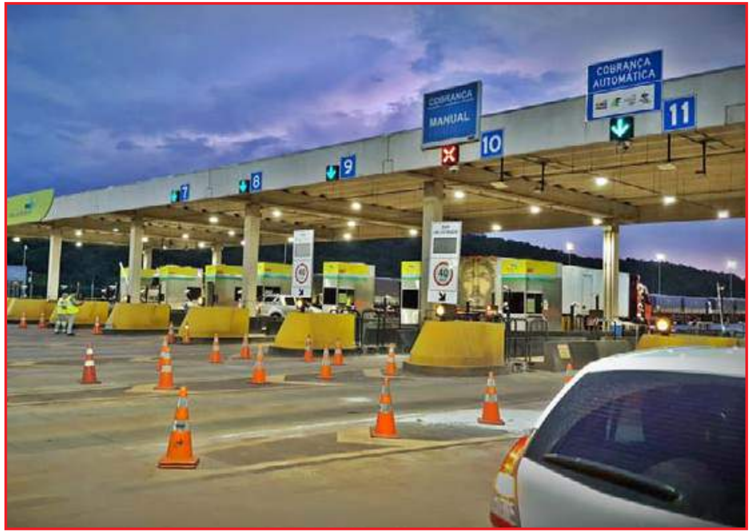
PL pode adequar sistema de cobrança aos contratos vigentes

A ideia é migrar essa modalidade para que todas as rodovias do Brasil contem com esse tipo de cobrança, sem pontos de paradas, deixando a cobrança mais justa. "A identificação dos carros será feita por sensores e câmeras e os veículos terão tags ou tecnologias de identificação para ter esse controle de quanto ele percorreu na rodovia. Será algo parecido como as cobranças automáticas de hoje. O veículo vai passar por uma velocidade delimitada nessas novas praças, como por exemplo a 40 km/h, para que haja a identificação da placa, porém, sem