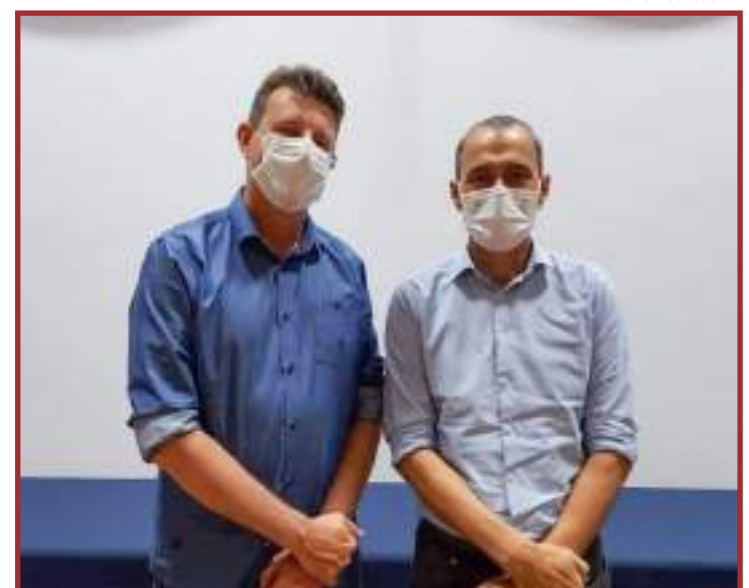
A busca agora é para que todos os prefeitos integrem as comissões de trabalho

zou a atitude. "Logo, a UPA (Unidade de Pronto Atendimento) será inaugurada, mas hoje com a parceria da família Riva, dá o pontapé para a construção do novo Hospital".