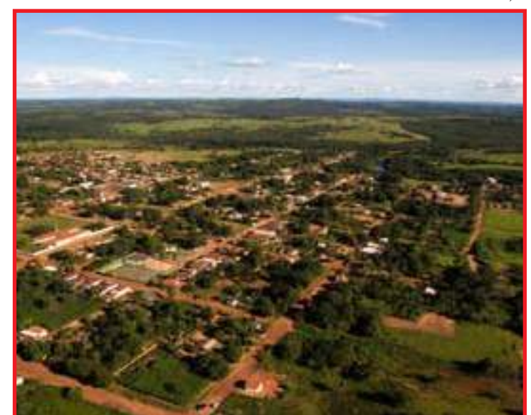
Araguaína não registrou mortes por Covid