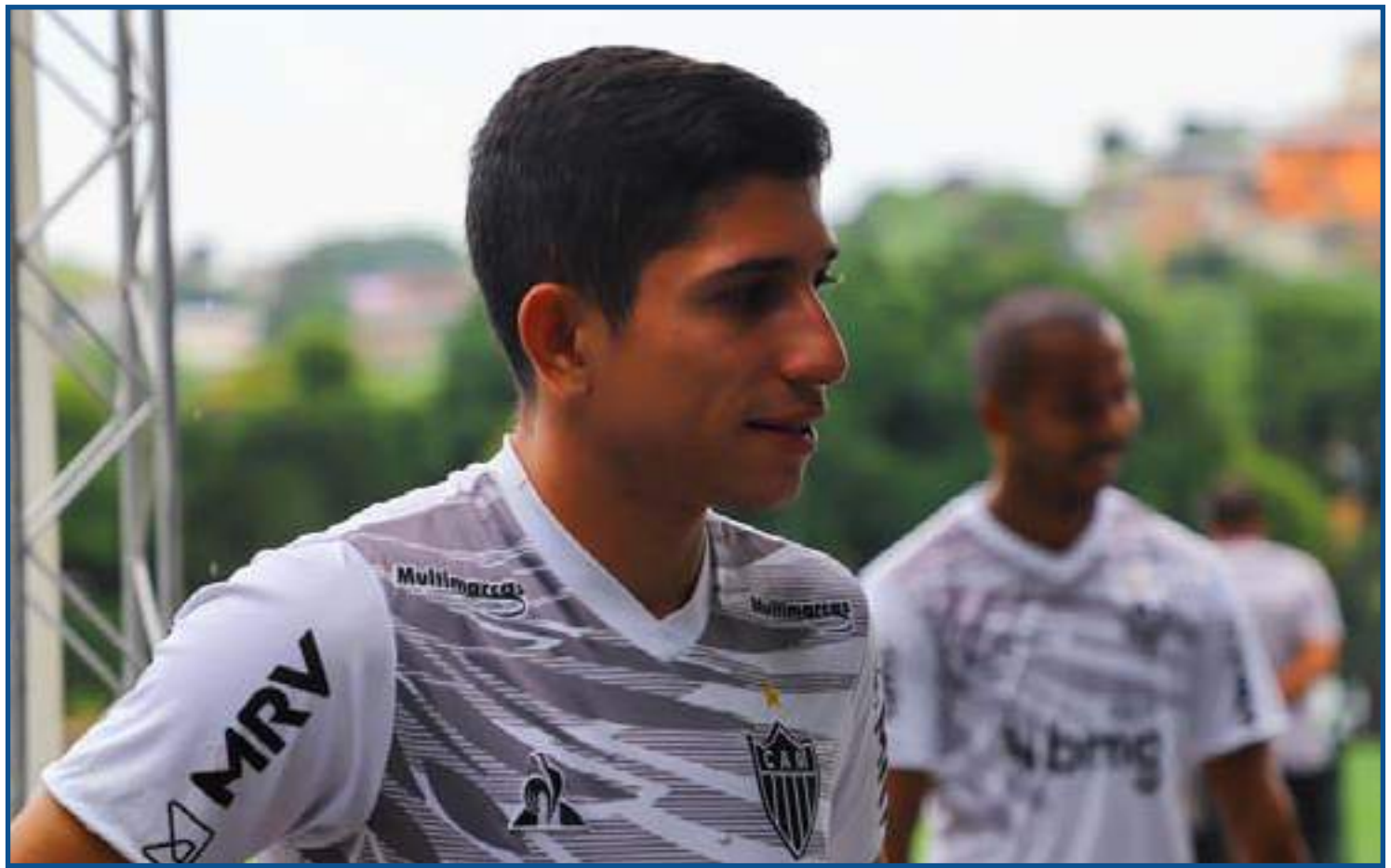
Savarino não viaja para encarar o Cerro Porteño (e vacinar)

Entre 11 e 20 de maio, o Atlético terá mais de 144