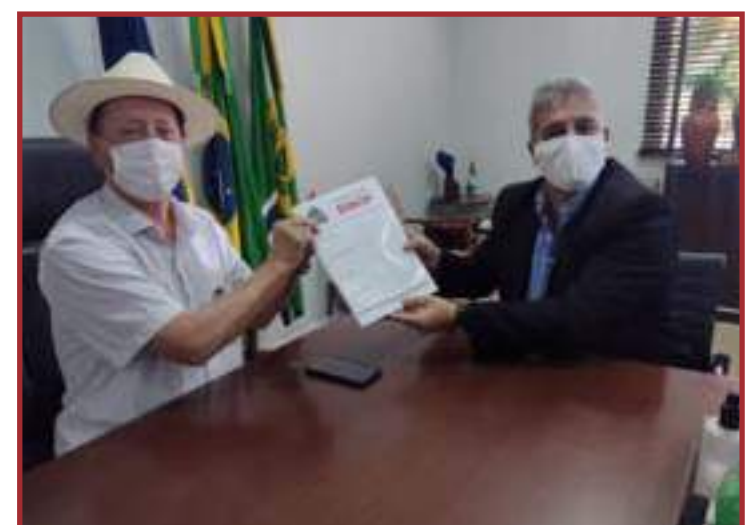
Gestão municipal contribuirá com a oferta de mão de obra