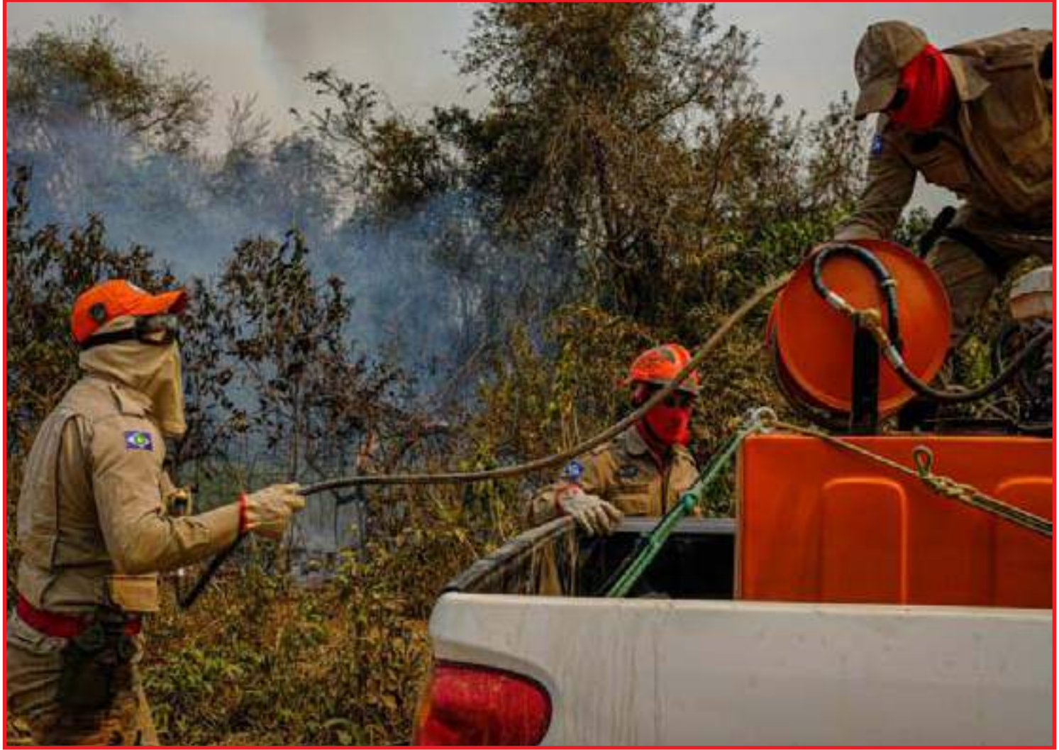
Serão contratados brigadistas para auxiliar forças de Segurança

"Iniciamos o planejamento das ações ainda no ano passado, intensificamos as medidas preventivas e de capacitação no primeiro trimestre de 2021, e agora as demais ações preparatórias para o período proibitivo serão reforçadas com a integração das agências e toda a sociedade para o enfrentamento do período de seca mais intenso no estado", afirma a secretária de Estado de Meio Ambiente, Mauren Lazzaretti. Conforme a gestora, o Estado conta com a sociedade para respeitar o período proibitivo e evitar os incêndios, e continuará fiscalizando e agindo dentro da política de tolerância zero com os