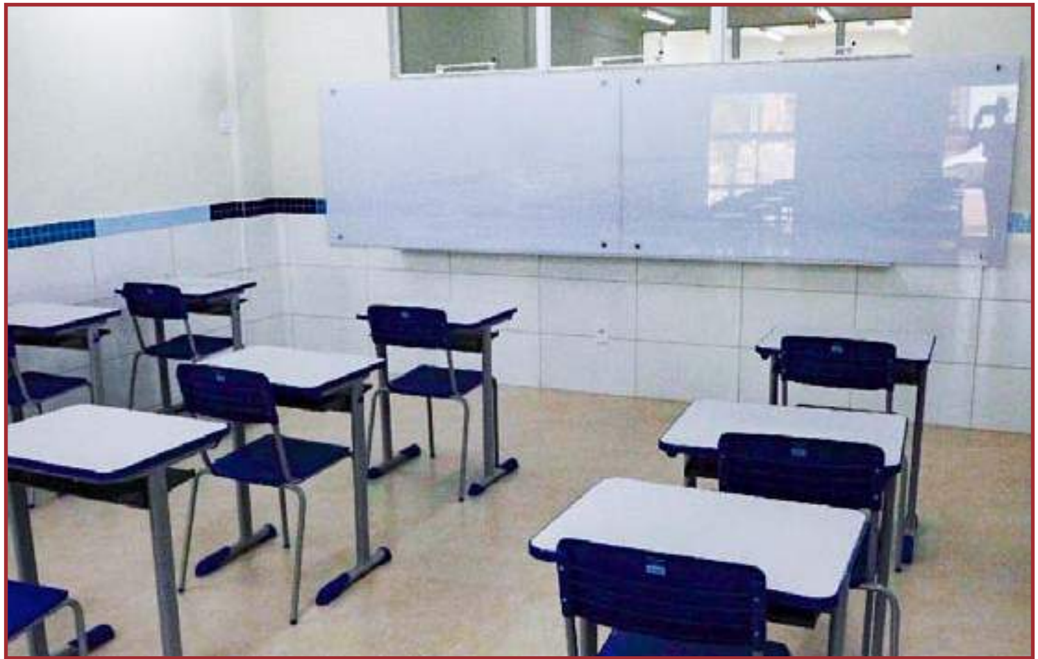
Definição poderá ser revista a qualquer momento

Alunos e profissionais sintomáticos, que apresen-