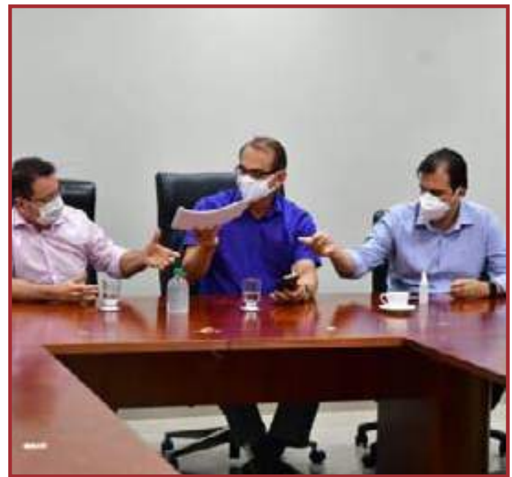
Prioridade também para as cidades preparadas para armazenar as vacinas