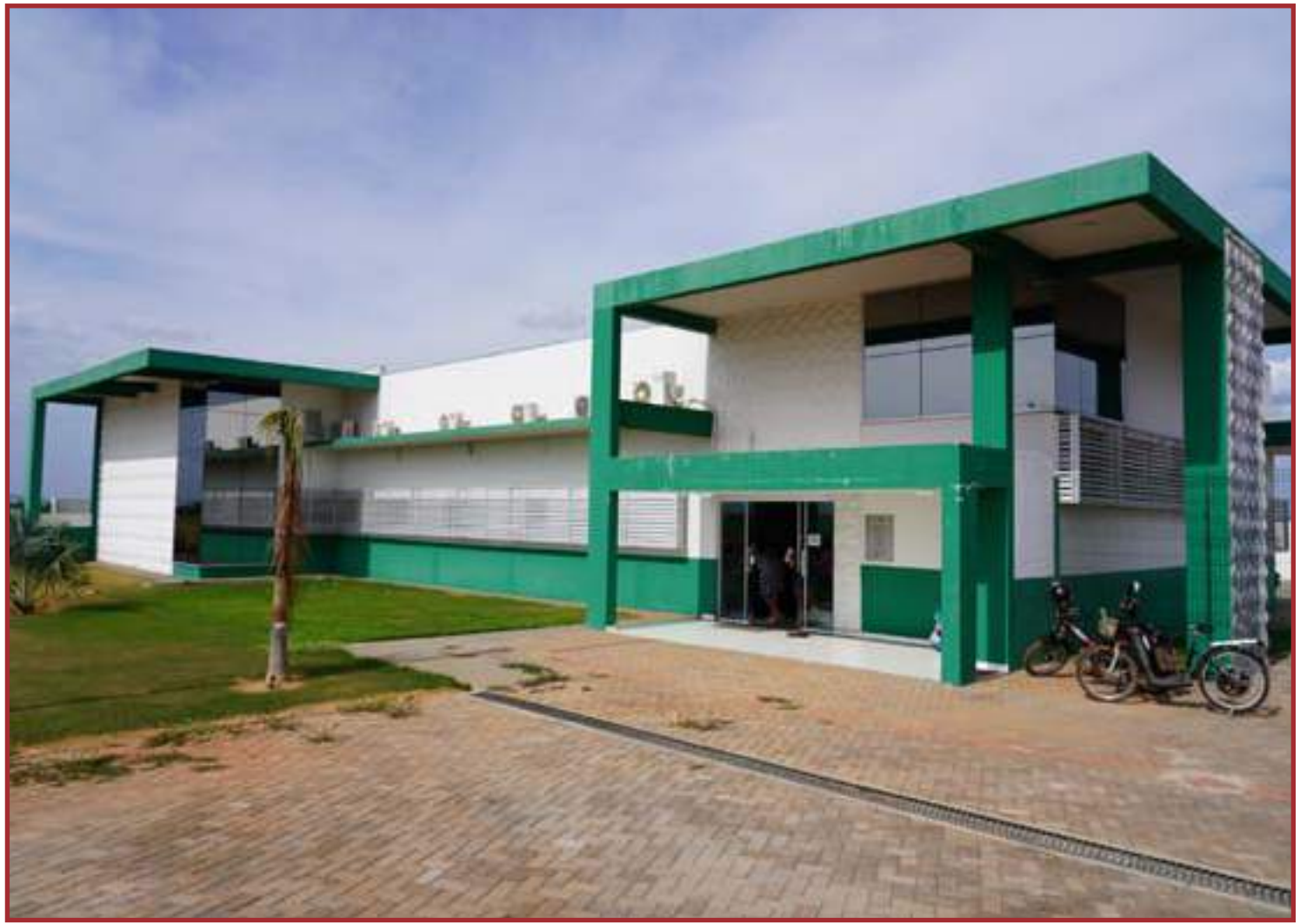
A ação faz parte da campanha nacional do Maio Vermelho, que faz alusão ao tema

Além disso, evite uso de alicates de unha de terceiros, seringas, entre outros objetos compartilhados. Em casos de procedimentos estéticos ou tatuagens, verifique se o estabelecimento tem certificado da Vigilância Sanitária e usa equipamentos de manuseio individual.