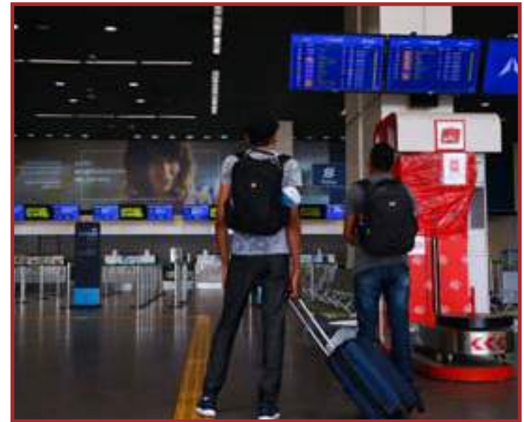
As regras criadas em razão da pandemia valerão até 31/12 deste ano