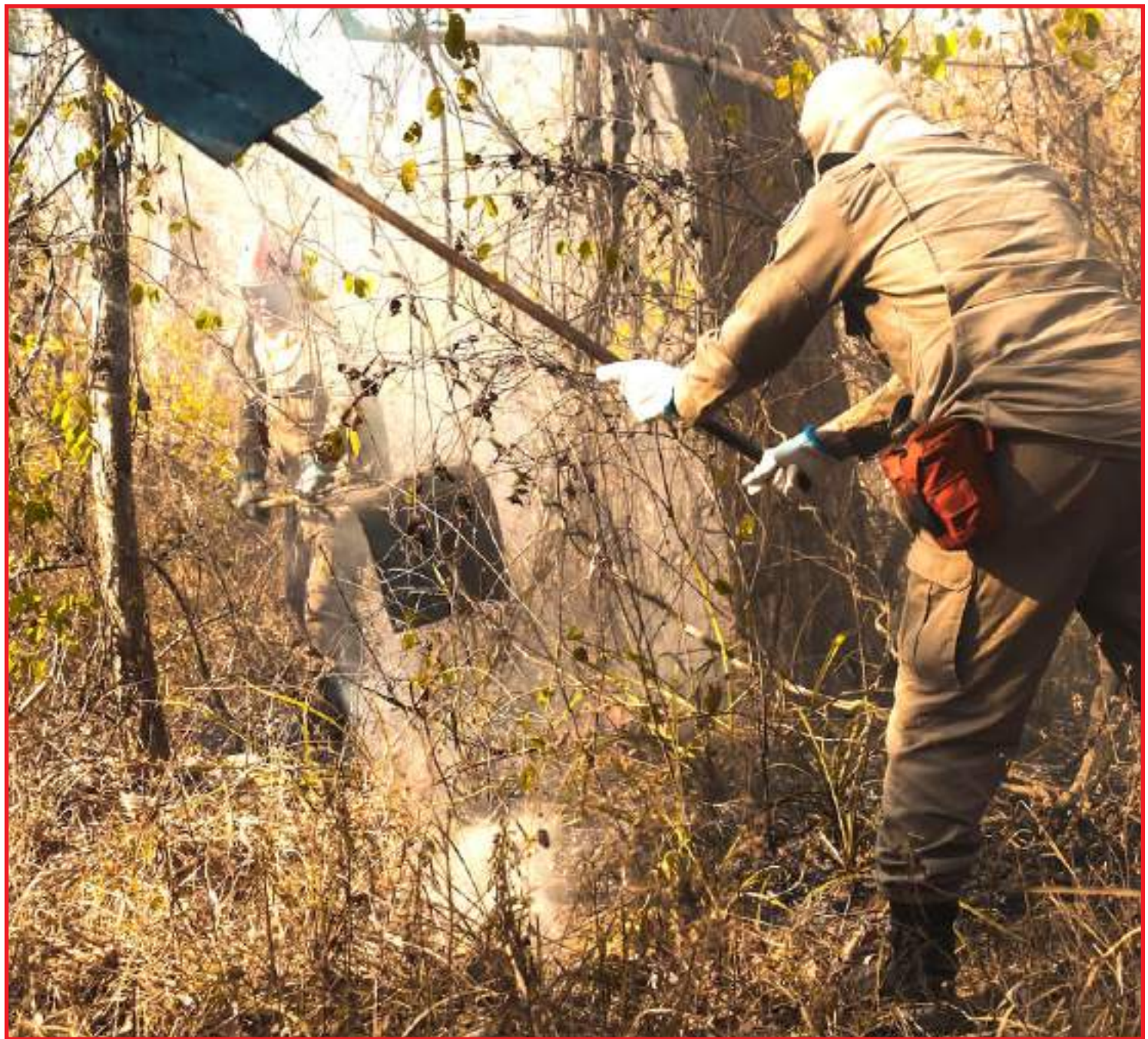
Trabalho de brigadistas é fundamental para conter avanço do fogo

O Governo Estadual está atento às questões ambientais e vem executando medidas antecipadas com planejamento e prevenção para combater incêndios florestais. Importante destacar que o Estado já decretou, a antecipação do período proibitivo de queimadas na zona rural, conforme conta no decreto nº 938/2021 do Diário Oficial, publicado no dia 19 de abril. Toda essa ação faz parte do Plano de Operações para a Temporada de Incêndios Florestais (POTIF 2021), que faz parte da política pública do Governo do Estado de Mato Grosso como instrumento de resposta preventiva e eficaz no combate às queimadas.