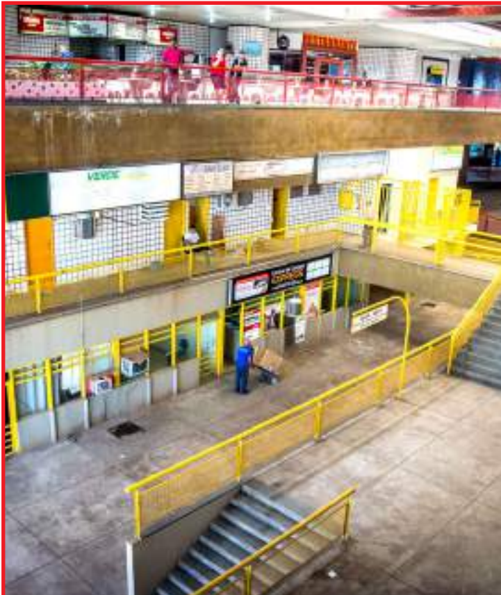
Terminal passará por reformas e melhorias no período de 25 anos

Dentre as melhorias a serem realizadas estão adequações nos banheiros, modificações na área de embarque e desembarque, central de operações, que deverá funcionar com monitoramento do fluxo dos usuários, além de melhorias no estacionamento e sinalização visual dos serviços prestados à população dentro do terminal, por exemplo.