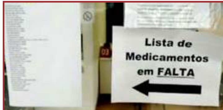
Unidades saúdes devem fornecer declaração sobre a falta de medicamento

previstos visam assegurar o direito fundamental de acesso à informação e devem ser executados conforme os princípios básicos da administração pública. Durante a