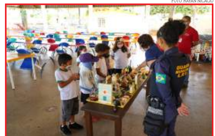
Alunos da Escola Caminho para o Futuro participaram de dinâmica lúdica

A intenção do Maio Amarelo é alertar a população para os perigos do trânsito, mas vale ressaltar que a orientação terá duração por todo o ano. A ação contou com o apoio da Guarda Municipal, Corpo de Bombeiros e da Polícia Militar.