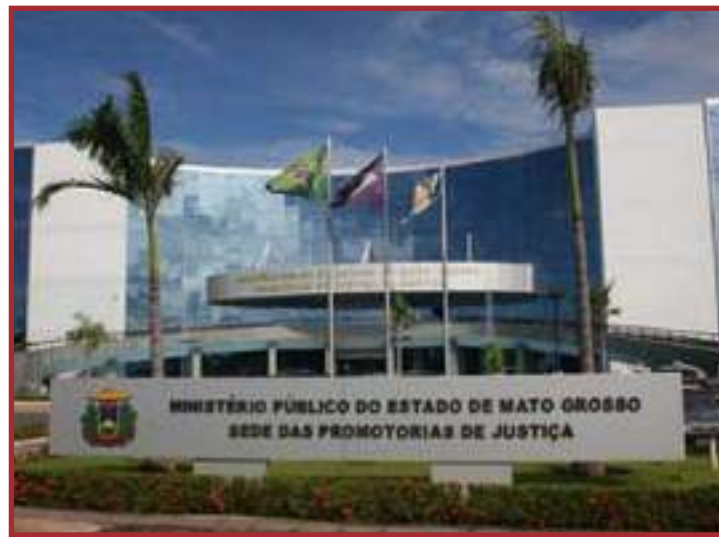
Decisão veio após nova classificação divulgada pela SES

A quarta etapa define que as unidades que se mantiverem na terceira etapa por pelo menos duas semanas e estiverem localizadas em municípios cuja classificação de risco epidemiológico seja "Baixo" por duas semanas subsequentes, retornarão,