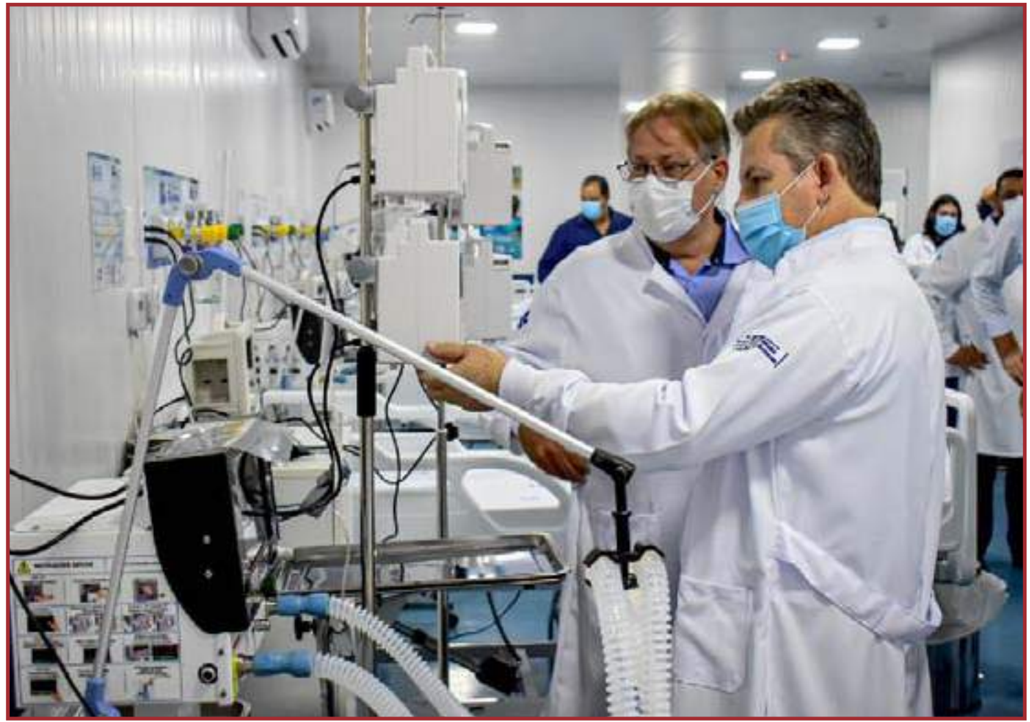
A lista foi encaminhada pela Controladoria-Geral da União à CPI da Pandemia