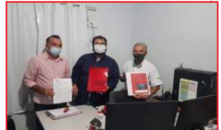
Plano de ação emergencial da usina