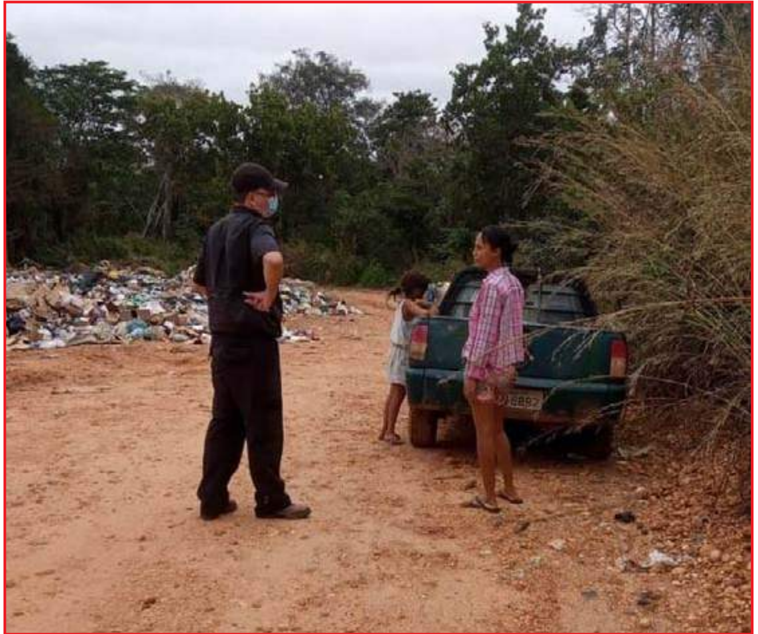
Crianças foram flagradas catando materiais recicláveis

A administração pública de Diamantino afirmou que não tem medido esforços para solucionar este problema que já havia sido identificada pela equipe de assistência social e pelo Conselho Tutelar.