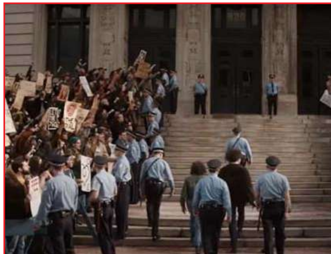
Filme narra história de um julgamento

uma dessas peças e deixá-las prontas para o confronto, Sorkin avança no tempo e vai direto para o julgamento, retomando cada um dos eventos que levou àqueles oito homens - que no decorrer do julgamento se tornariam sete - à corte. De forma nada discreta, Sorkin retoma a narrativa utilizada em A Rede Social, que também recorre à flashbacks nas cenas de disputa jurídica entre Mark Zuckerberg (Jesse Eisenberg) e seus antigos parceiros do Facebook. Além de mover a história para frente sem a necessidade de diálogos tediosos, essa escolha abre espaço para que seu elenco de peso brilhe, crescendo à medida que o filme aborda suas diferenças internas.