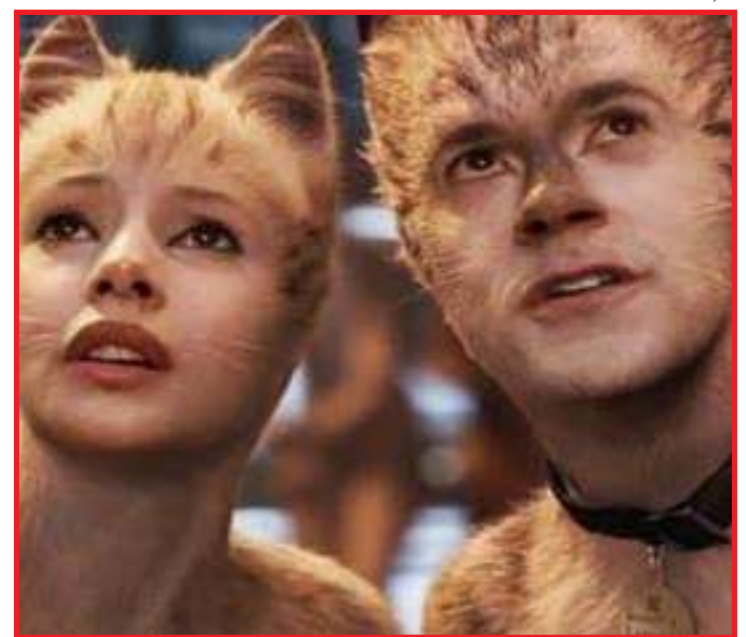
Filme recebeu críticas negativas já no lançamento de seu primeiro trailer