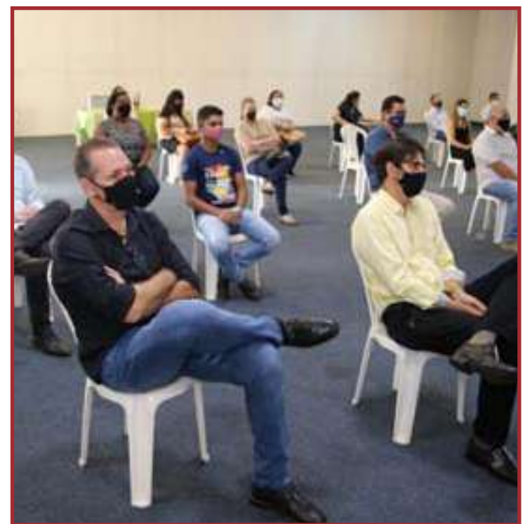
Sorriso está em risco alto

Entre os vetos mantidos, os senadores mantiveram veto à norma que permitiria estados e municípios a comprarem vacinas em caráter suplementar.