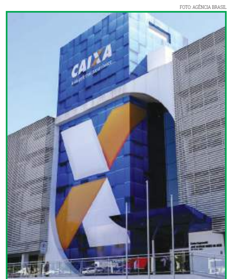
Parcela havia sido depositada em 20 de maio

A implantação da indústria em Nova Mutum irá gerar 54 empregos diretos e 200 indiretos, com capacidade de 100 toneladas de matéria-prima processada por ano, produzindo torta de algodão e litros de óleo bruto.