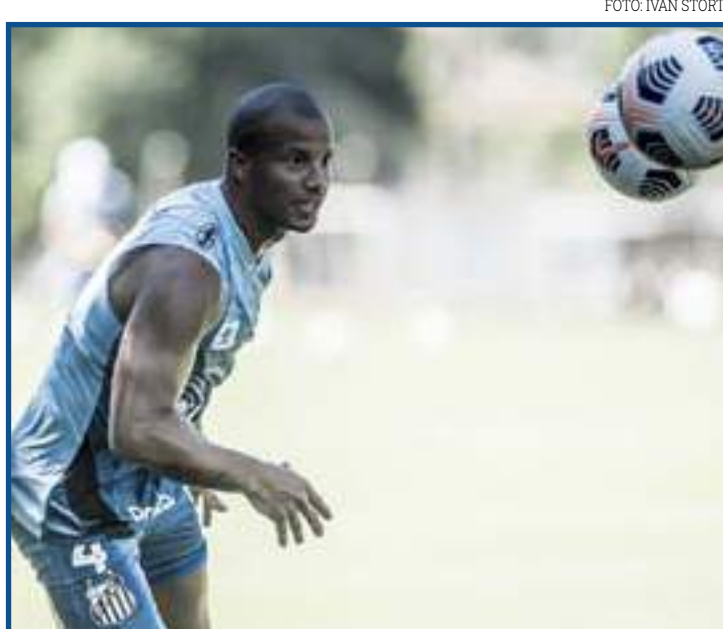
Carlos Sánchez em treino do Santos