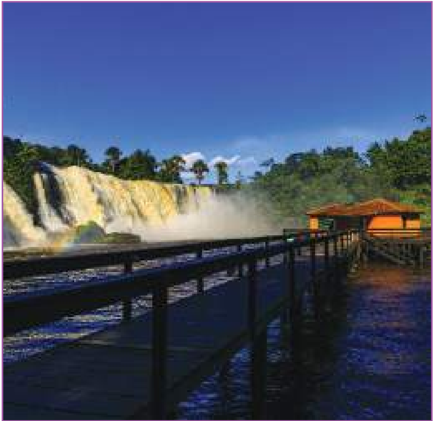
Despencar das águas na Cachoeira Salto das Nuvens, em Tangará da Serra

Descubra Mato Grosso: Cachoeira Salto das Nuvens, em Tangará da Serra, é o primeiro cenário que ilustra uma série de reportagens que serão produzidas para mostrar as riquezas naturais que o estado possui.