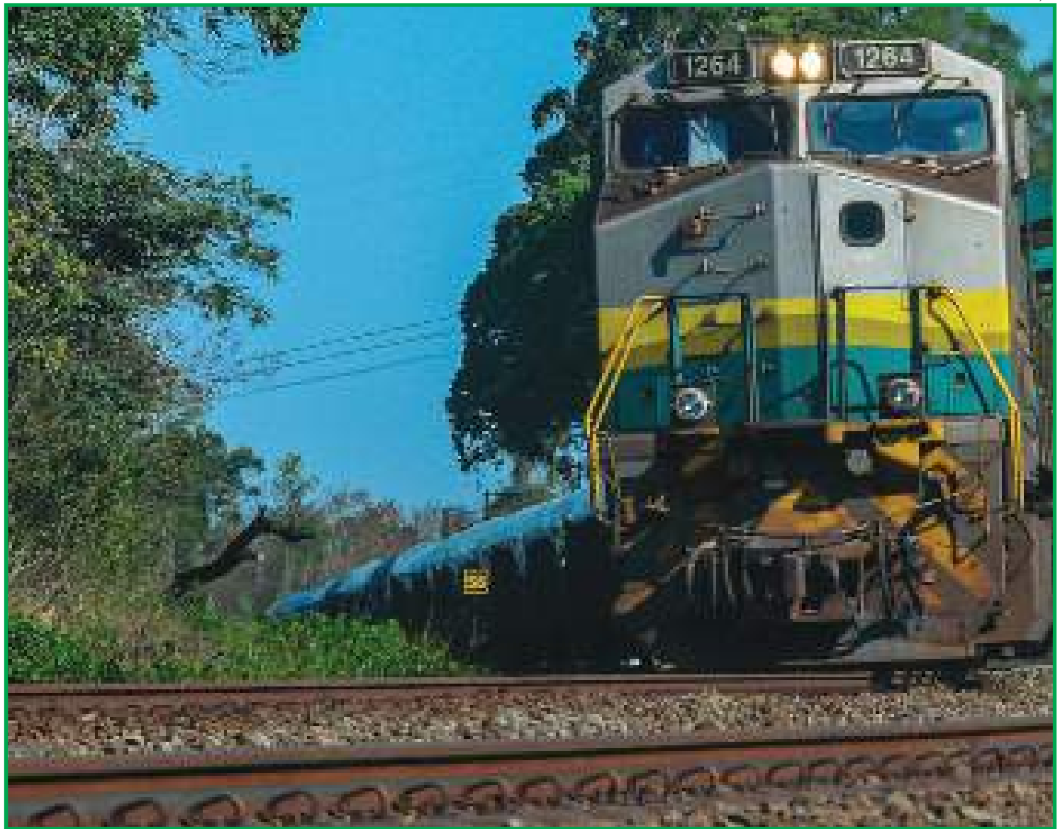
Ferrovia impulsionará industrialização, diz secretário

"Teremos mais indústrias, geração de emprego, valorização de área, que temos Cuiabá em sua posição estratégica, associado à abundância de energia que nós temos, temos aqui o Manso, o gasoduto, a termoelétrica, associado a um ponto seco, temos estação aduaneira aqui no Distrito Industrial, onde se pode importar e exportar pelo distrito, associado às principais facilidades e universidades, que forma uma mão de obra qualificada que vai ser absorvida pelas indústrias que virão para cá, empresas que vão crescer aqui dentro", disse. Com a vinda da indústria Cuiabá deve iniciar um novo processo de transformação. Além da posição estratégica, o secretário afirma que a Prefeitura já está elaborando outros projetos para tornar a capital do Estado mais atraente.