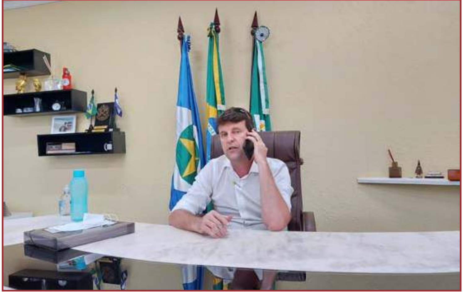
Lafin é considerado a renovação do tucanato mato-grossense

Acho que o mais importante no cenário é sempre ter a certeza que os números nos apontem o que é correto e assim que tiver pesquisas e a realidade anunciada através da opinião pública