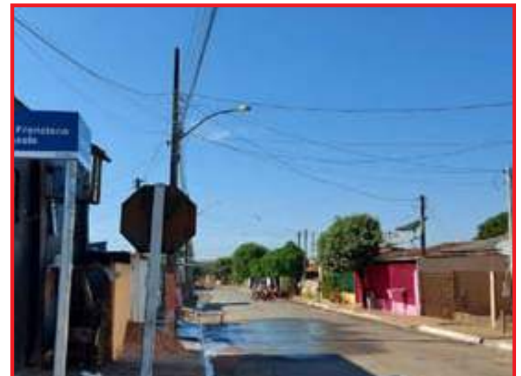
Placas estão sendo instaladas em diversos bairros

Congresso Nacional aprova proposta que abre crédito de R$ 19,7 bilhões para aposentadoria, seguro-desemprego e BPC