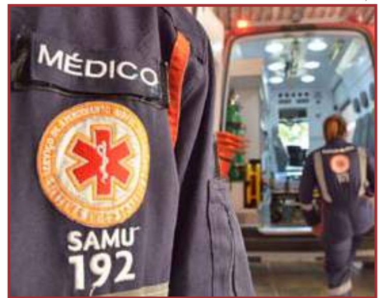
Proposta permite a remoção para hospitais particulares