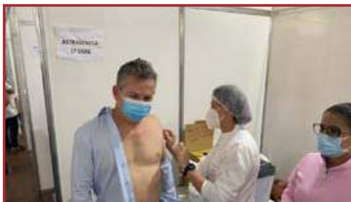
Este é o momento que todo mundo espera

O governador também explicou que todas as vacinas são boas e que os efeitos colaterais existem, mas são mínimos. "É coisa passageira, não demora mais do que 24 horas. Todas elas são eficazes, tiram o risco de falecimento. As pessoas tem que se imunizar, quem está fazendo isto [não querendo tomar], está