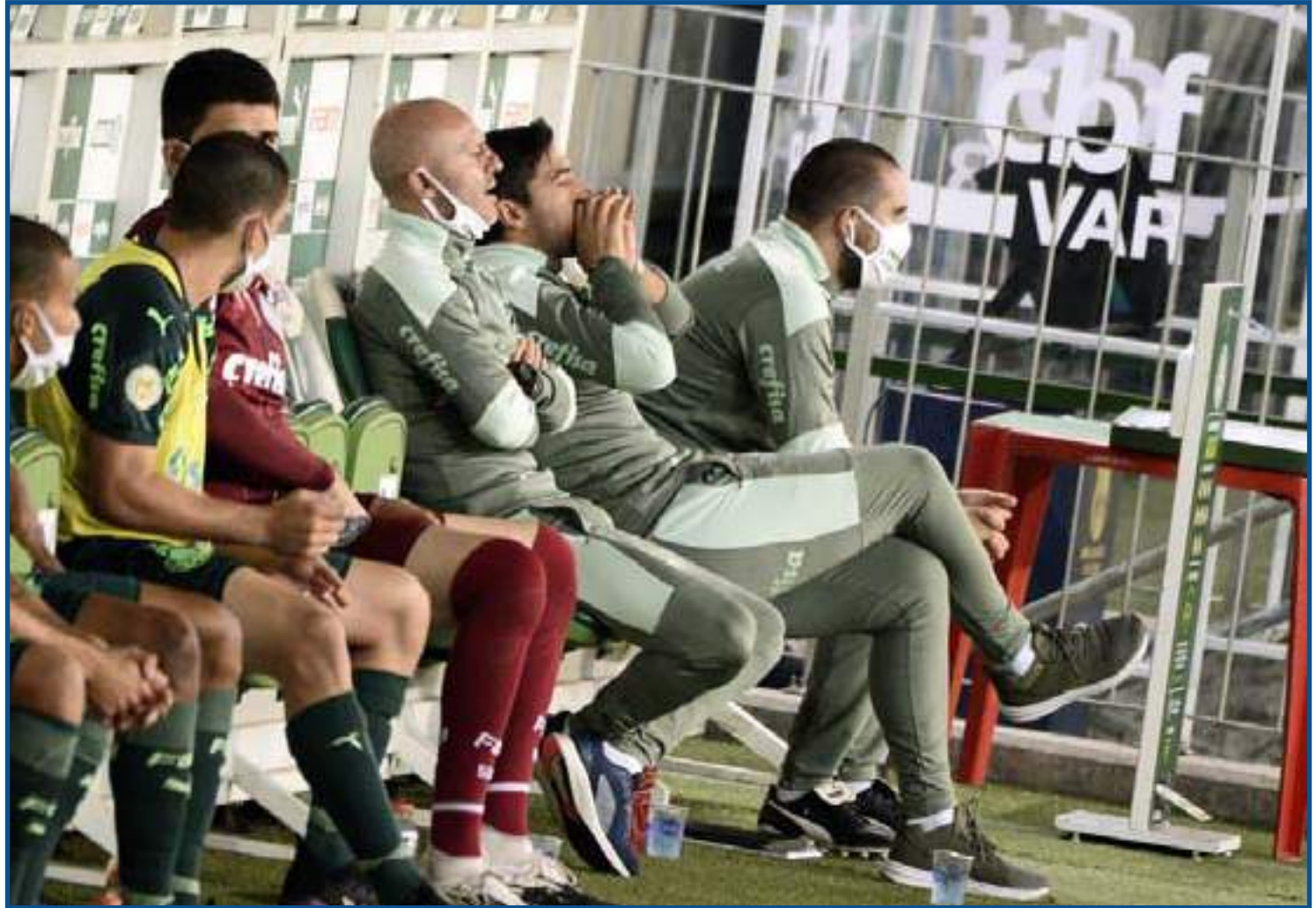
Abel Ferreira terá problemas para escalar o Verdão contra o CRB