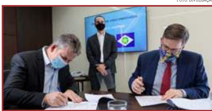
Cooperação visa obter o intercâmbio das melhores práticas

vestimentos, e fazer com isso o jogo do ganha-ganha para nós mato-grossenses e para esses investidores", afirmou o governador. O memorando prevê que o Governo de Mato Grosso e a Embaixada dos EUA vão cooperar em diversas áreas: educação; saúde, ciência, meio ambiente, mudanças climáticas e tecnologia; segurança pública, incluindo controle de drogas ilegais, medidas para combater o tráfico de pessoas, e administração penitenciária, migração; comércio e investimento; agricultura; turismo; economia verde e infraestrutura. De acordo com o documento, essa cooperação visa obter o intercâmbio das melhores práticas, serviços e tecnologias em todas essas áreas. Para o embaixador Todd Chapman, essa assinatura vai facilitar o estreitamento de