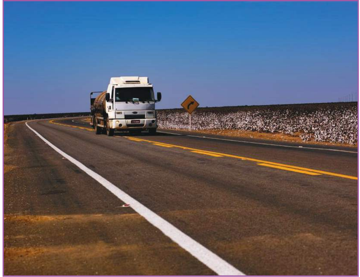
Governo licita obras de pavimentação de 200 km para melhorar logística

O lote 4 vai do subtrecho de Santa Rita do Trivelato até o Distrito Boa Esperança, em uma ex-