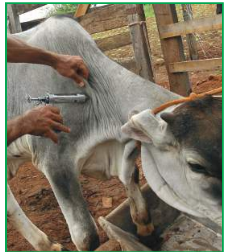
Propriedades não comunicaram sobre vacinação contra a aftosa