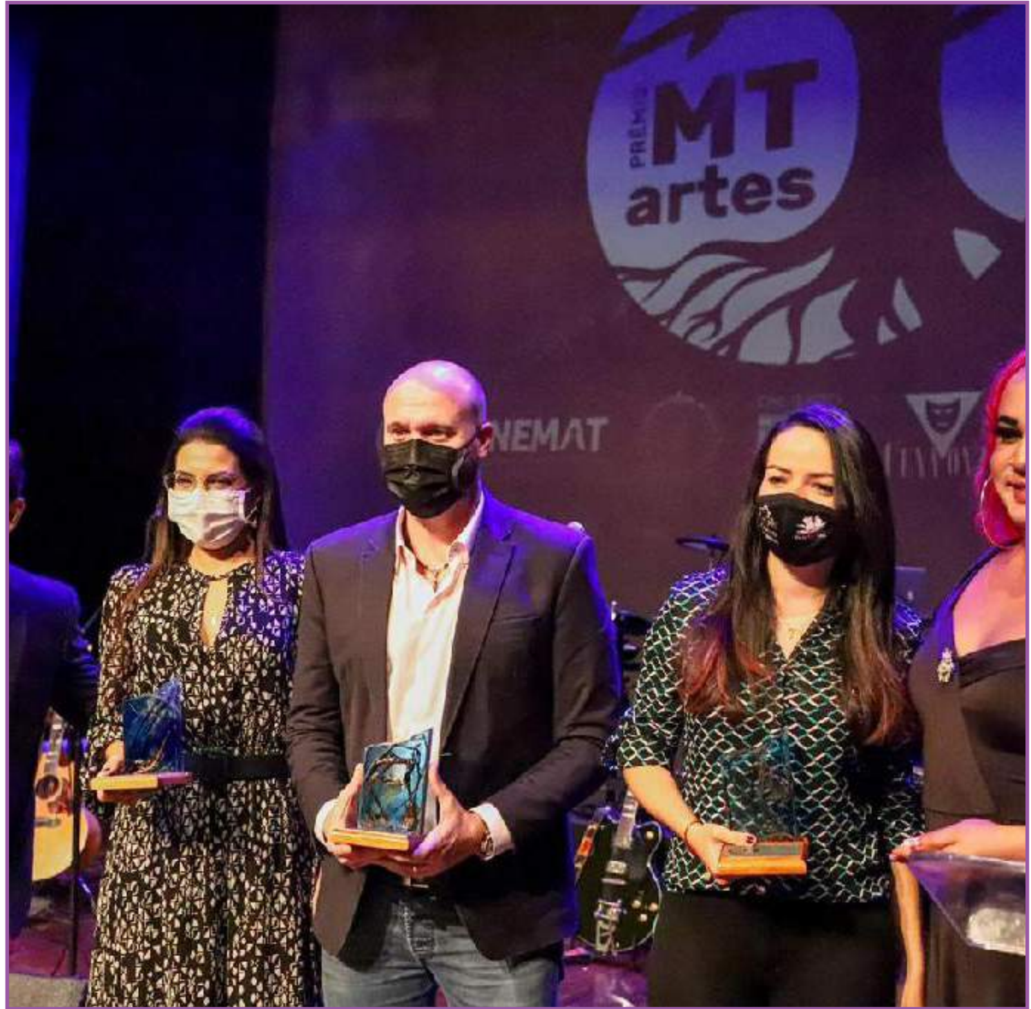
Classe artística foi homenageada nesta semana

Na categoria teatro, os vencedores foram "Depois do fim do mundo vem sempre um outro dia", dos estudantes do Núcleo 2 da MT Escola de Teatro; "Fiu Fiu - O encontro entre Pássaros", Grupo Tibanaré; e "O que restou do bairro silenciou a mulher na qua-