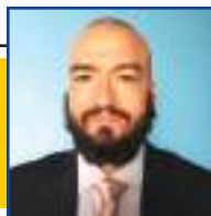
POR LEANDRO CARECA