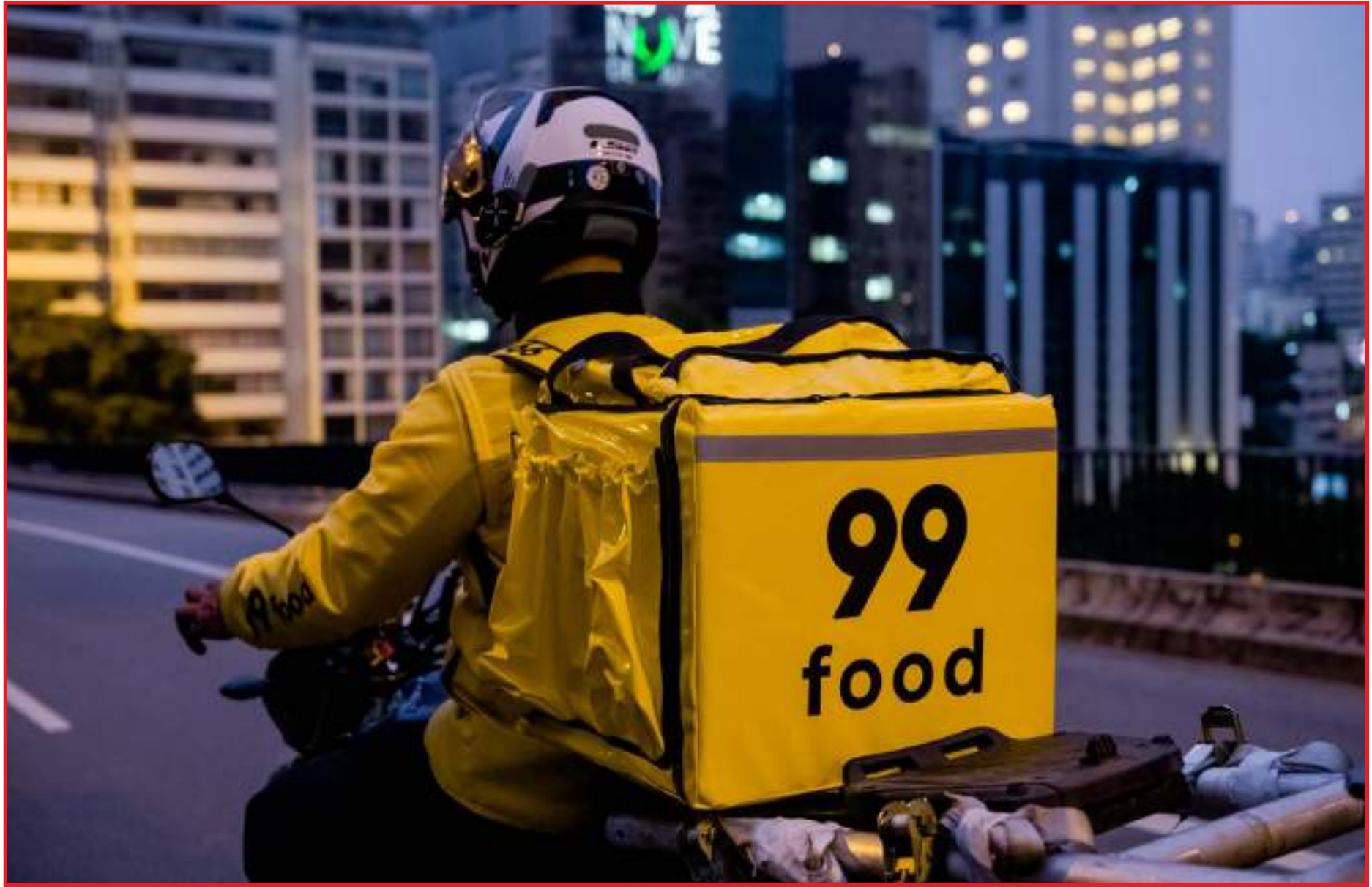
Sinop terá novo app de delivery

“O mercado de entregas está aquecido no Brasil e no mundo. Nesse momento, inclusive, o delivery se tornou uma alternativa para que muitos estabelecimentos tenham uma fonte de renda e se mantenham funcionando. Nossa chegada à Sinop pode ajudar muitos desses estabelecimentos. Além de ser uma alternativa também para entregadores parceiros”, explica o diretor de operações da 99Food, Pedro Gomes.