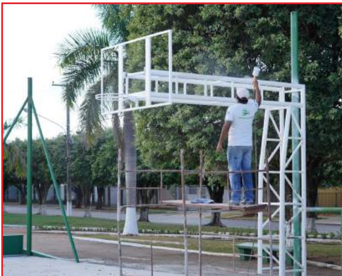
Será feita troca da pintura das grades, linha, traves e instrumentos esportivos

Na semana passada, a secretária implantou uma iluminação provisória para dar condição de trabalho mesmo no período noturno. A ação foi necessária visto que todos os refletores do local estão queimados e a troca deles depende da aquisição de novos por meio de licitação que