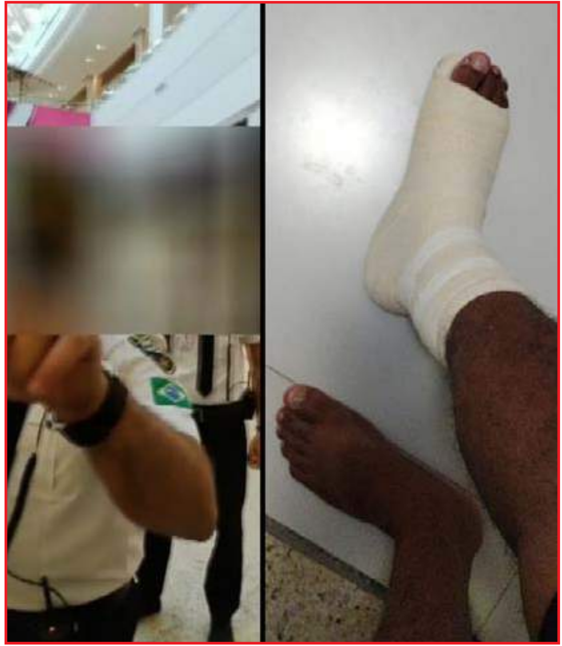
Ele disse que foi empurrado e teve uma torção no tornozelo

"O Pantanal Shopping esclarece que não tolera nenhuma forma de discriminação ou violência e que o tratamento narrado não faz parte das diretrizes do shopping, que baseia a abordagem com o público de forma geral em valores como ética, respeito, humildade e transparência", diz.