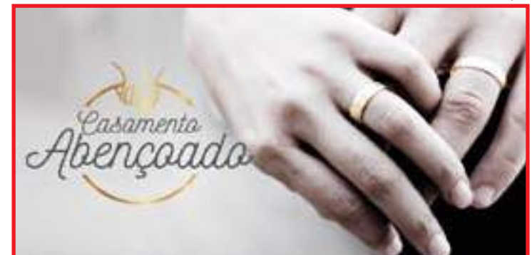
Iniciativa abrange todas as religiões, pessoas com deficiências e casais LGBTQ+