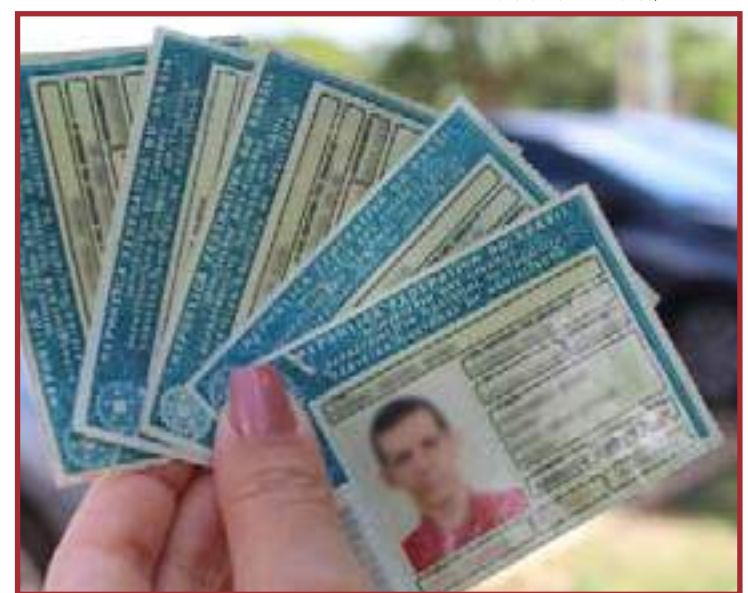
Validade é para as habilitações renovadas a partir do dia 12/04/21