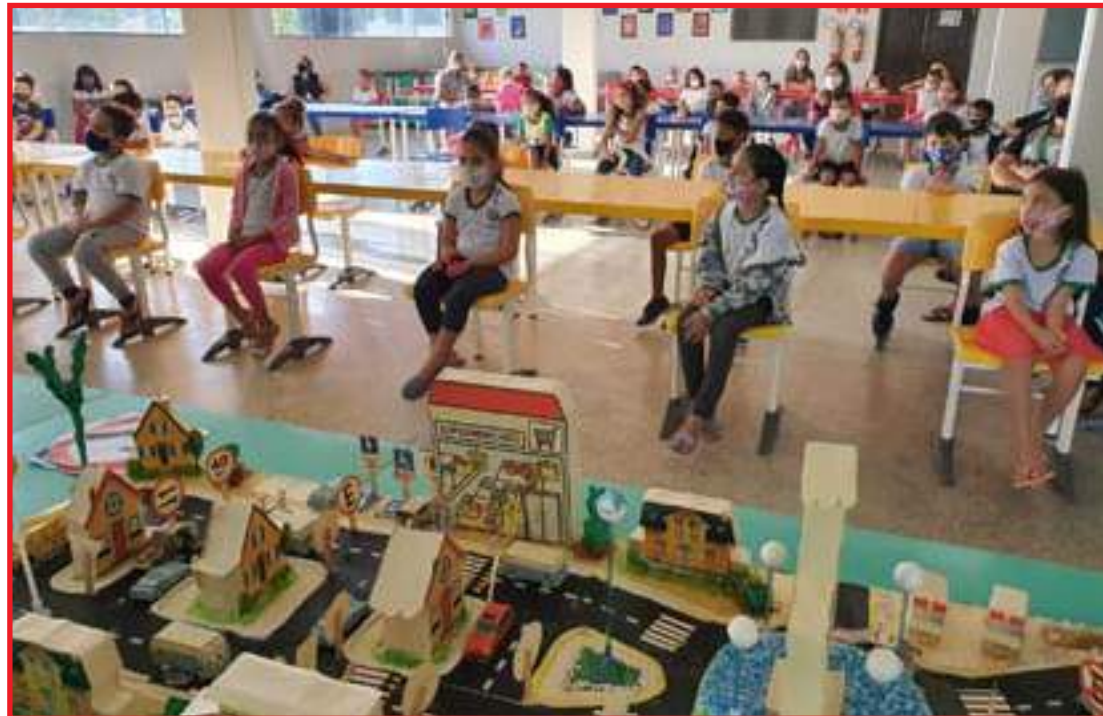
Ideia é orientar para criar adultos conscientes e responsáveis

Os projetos educacionais voltados ao trânsito são estimulados durante todo o ano, porém têm seu marco forte no mês de maio, quando é realizada a campanha nacional Maio Amarelo. A pedagoga responsável pela educação no trânsito na Se-