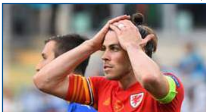
Astro afirma que seleção galesa sempre entra com este rótulo

Após o pontapé inicial, seremos apenas nós contra a Dinamarca. Não vou jogar como se fosse meu último