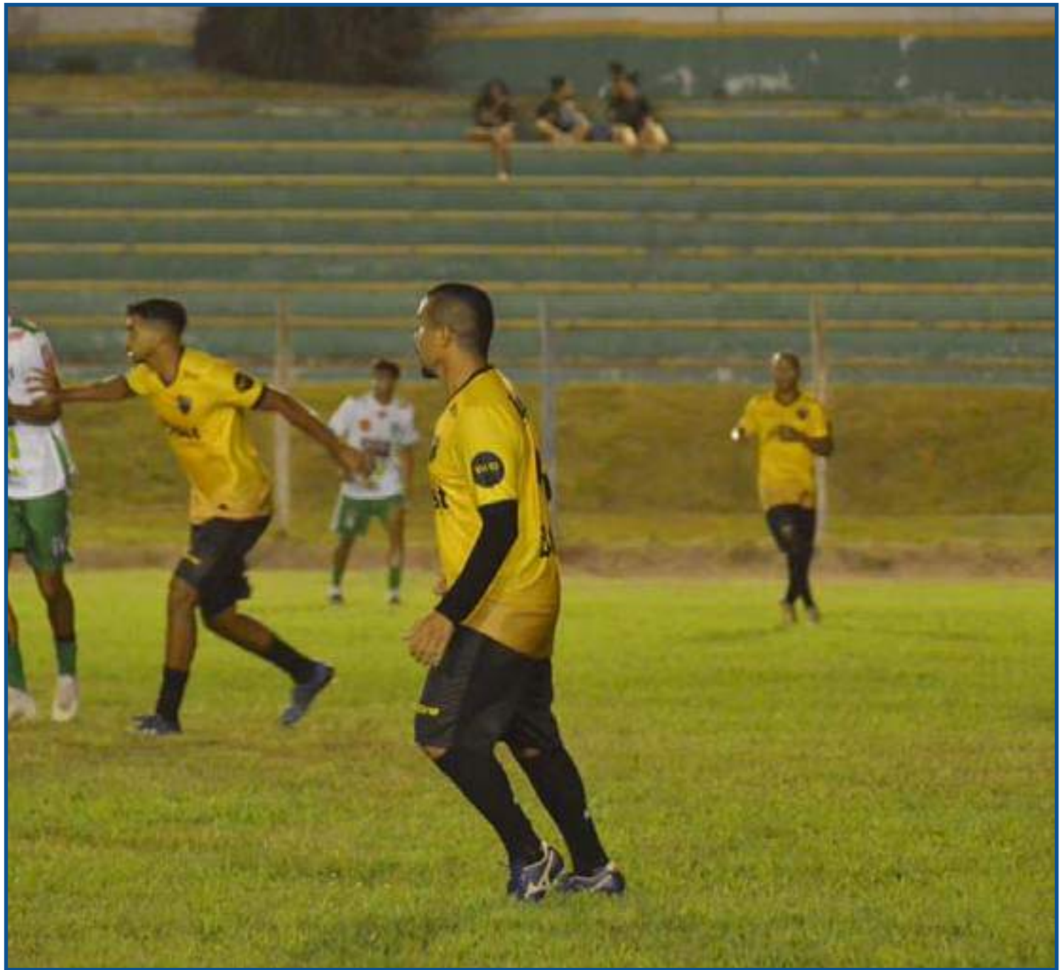
Sport Sinop busca colocar a Capital do Nortão de volta à elite estadual