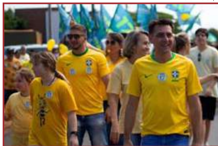
Gestões municipais são responsáveis pela sondagem e topografia dos terrenos

"O representado reincidiu por duas vezes condutas vedadas em um mesmo pleito, demonstrando desprezo com a legislação vigente, desrespeito com o dinheiro público e com seus concorrentes no pleito. A sua condição financeira é suficiente para suportar a aumento da pena, de forma que sinta os reflexos de suas