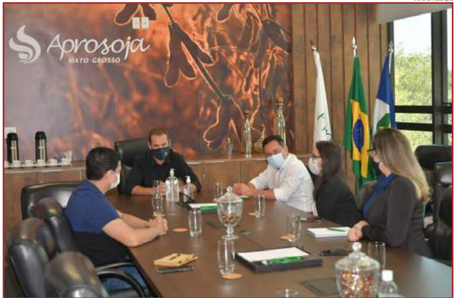
Deputados e Aprosoja definiram campanha que será lançada segunda-feira

Cadore também parabenizou a participação dos