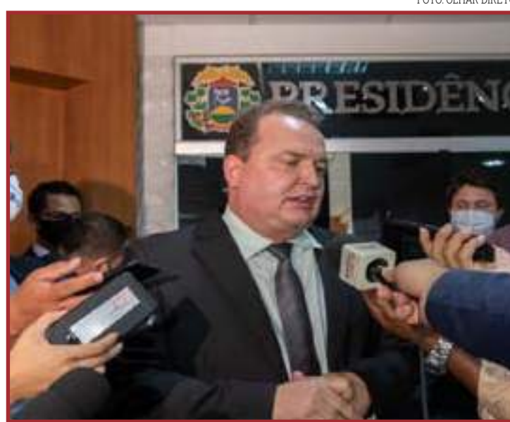
Deputados se reuniram com Mauro Carvalho para discutir aplicação de emendas

Cada deputado estadual tem direito a cerca de R$ 7 milhões em emendas impositivas. Deste valor, 25% deve ir para a educação, outra parte para a saúde, cultura e