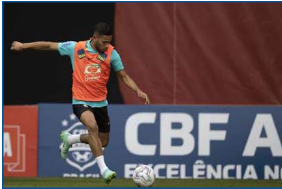
Lodi deu assistência para o gol de empate contra a Colômbia

Não, eu não sou só ofensivo. Sei defender também. As pessoas precisam dar prio-