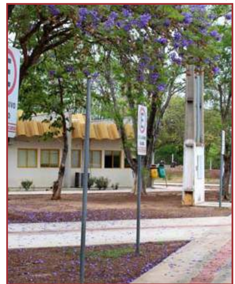
Benefício deverá valer após sanção do Governo do Estado

sente momento, posto que vem, reiteradamente, insistindo na prática deste ilícito", diz trecho da decisão.