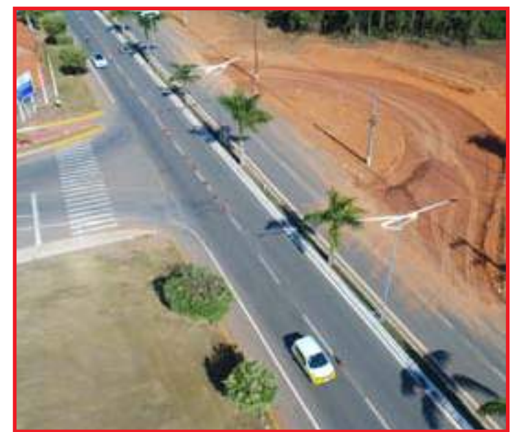
Via foi interditada desde esta terça