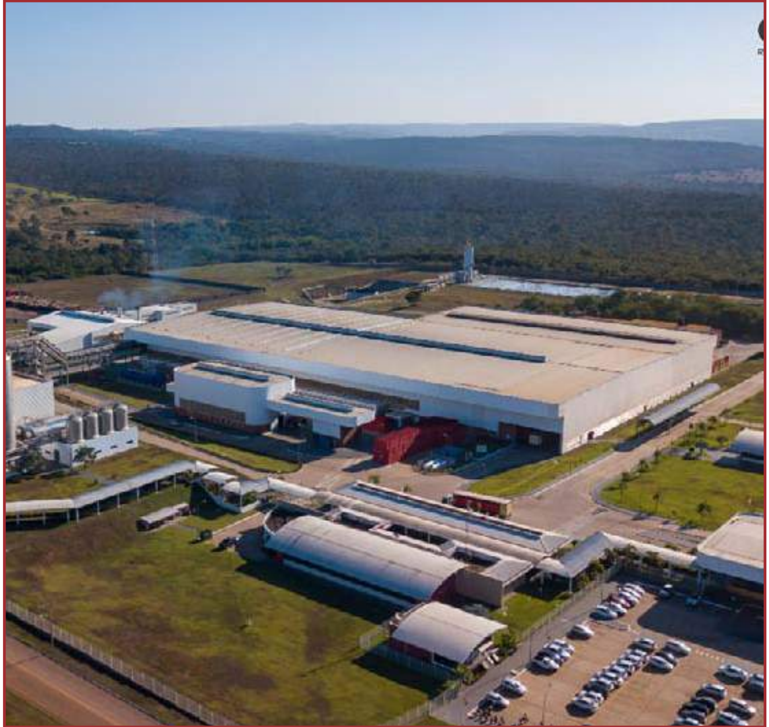
Concretização pode levar maior desenvolvimento para a região

O propósito principal é o desenvolvimento econômico e social da região metropolitana, a partilha equilibrada dos seus benefícios, a definição de políticas compensatórias dos efeitos de sua polarização e o estabelecimento de planejamento de médio e longo prazo de seu crescimento. Desta maneira, tal solicitação prende-se ao fato que com a implantação da Região Metropolitana de Sinop, as ações de planejamento e ordenamento do território, a execução de ações conjuntas entre legisladores municipais, poderão contribuir para questões de saúde (vacinação, epidemias), educação (demanda por alunos/séries), transporte (integração, mobilidade), econômicas (arrecadação de impostos, geração de renda) e violência urbana (índices de criminalidade), poderão ainda contribuir sobremaneira para à instalação de grandes equipamentos urbanos (shoppings, centros comerciais, grandes lojas ou redes). A partir dessa ação governamental, estima-se um incremento nas principais demandas de público-alvo ou perfil de renda e consumo, bem como as potencialidades de lucro que uma região metropolitana pode oferecer a toda a sociedade e principalmente aos municípios que a compõem.