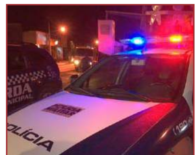
A Compdec segue fazendo monitoramento das áreas públicas