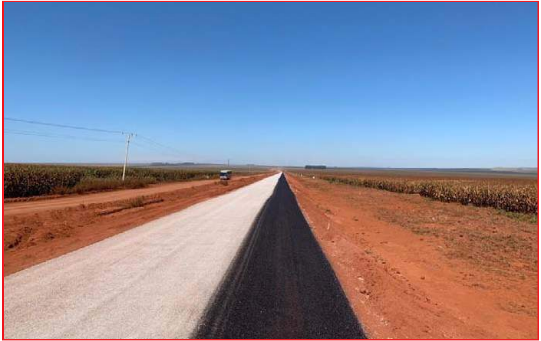
Serão 15 km de asfalto para interligar rodovia estadual às federais

No entanto, a falta da pavimentação dificultava o escoamento da safra, o transporte de cargas e o trânsito