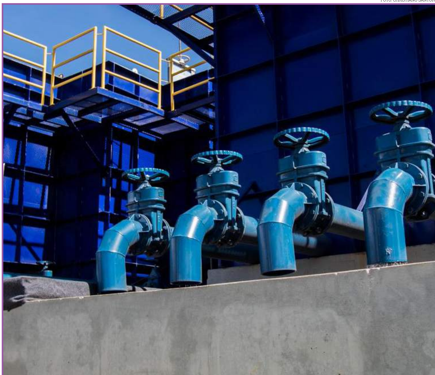
Programa foi criado a partir do novo Marco Legal do Saneamento

Nesta terça (29), o programa foi apresentado aos consórcios Médio Araguaia, Araguaia, Norte Araguaia e Portal do Araguaia. Já na quarta (30), às 9h, será feita a apresentação aos consórcios Vale do Teles Pires, Vale do Rio Cuiabá, Vale do Juruena e