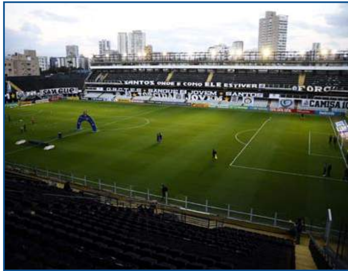
Vila Belmiro tem sido importante no momento de evolução do Santos na temporada

O Santos está há oito jogos invicto na Vila Belmiro, já que venceu os dois últimos compromissos no local antes de Diniz assumir o clube. E o próximo jogo do Peixe é justamente no estádio, nesta quarta (30), às 19h30, contra o Sport, pela oitava rodada do Campeonato Brasileiro. O