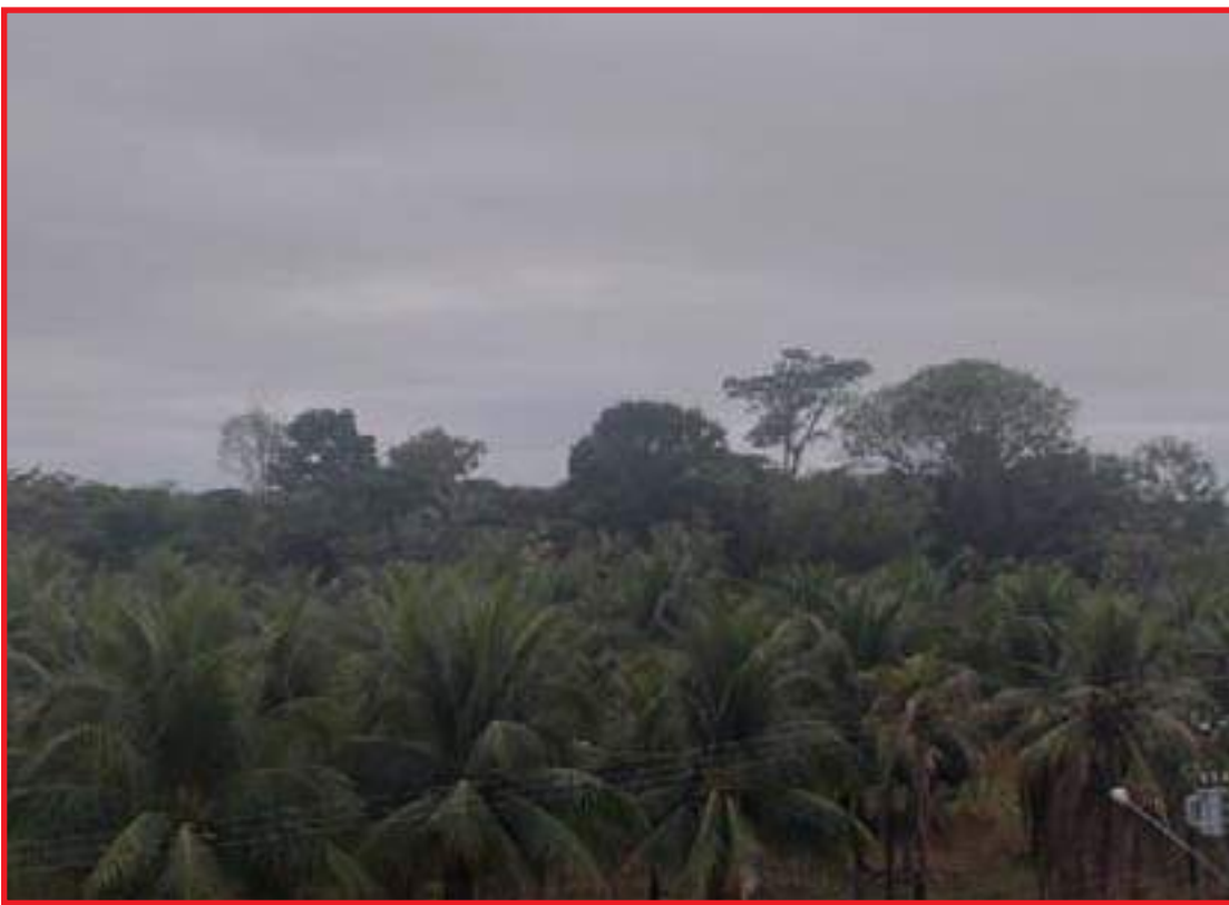
Terça amanheceu com nuvens e baixas temperaturas

mais frio também deverá ser na quarta-feira, com tempe-