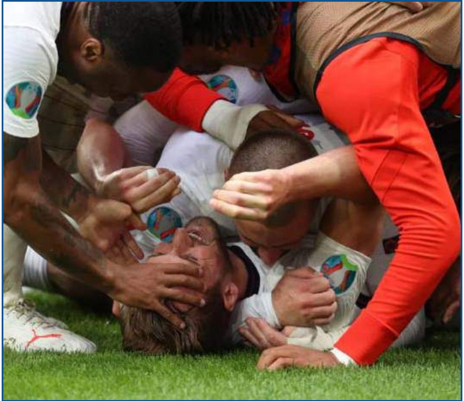
Kane marcou o 2º gol e levou 'bolinho' dos companheiros de equipe

Foi o último jogo de Joachim Löw como técnico da seleção da Alemanha. No cargo desde 2006, ele se despede com uma queda precoce na Eurocopa após ficar em segundo lugar no Grupo F, que também viu França e Portugal serem eliminadas. Campeão da Copa do Mundo de 2014 e da Copa das Confederações de 2017, será substituído por Hansi Flick, ex-treinador do Bayern de Munique.