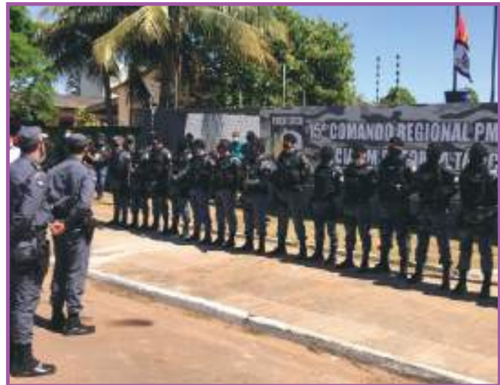
Inauguração foi realizada nesta semana, em Guarantã