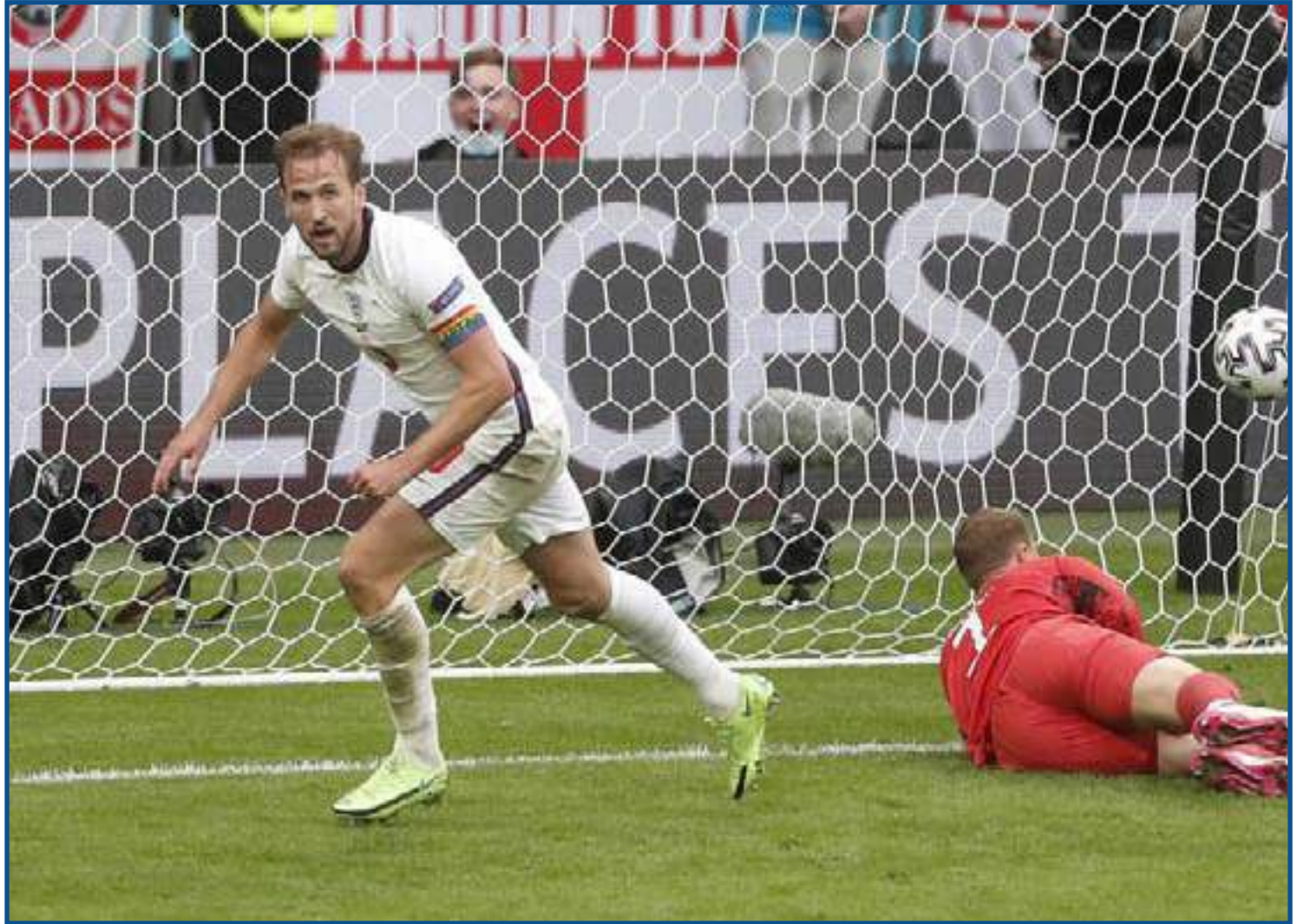
Kane sai para comemorar o segundo gol da Inglaterra sobre a Alemanha

A partida com mais gols nas oitavas foi a vitória da Espanha por 5 a 3 sobre a Croácia, na prorrogação, após 3 a 3 no tempo normal. Este é o segundo jogo com mais gols na história da Euro, um a menos que Iugoslávia 5x4 França na semifinal de 1960. A seleção