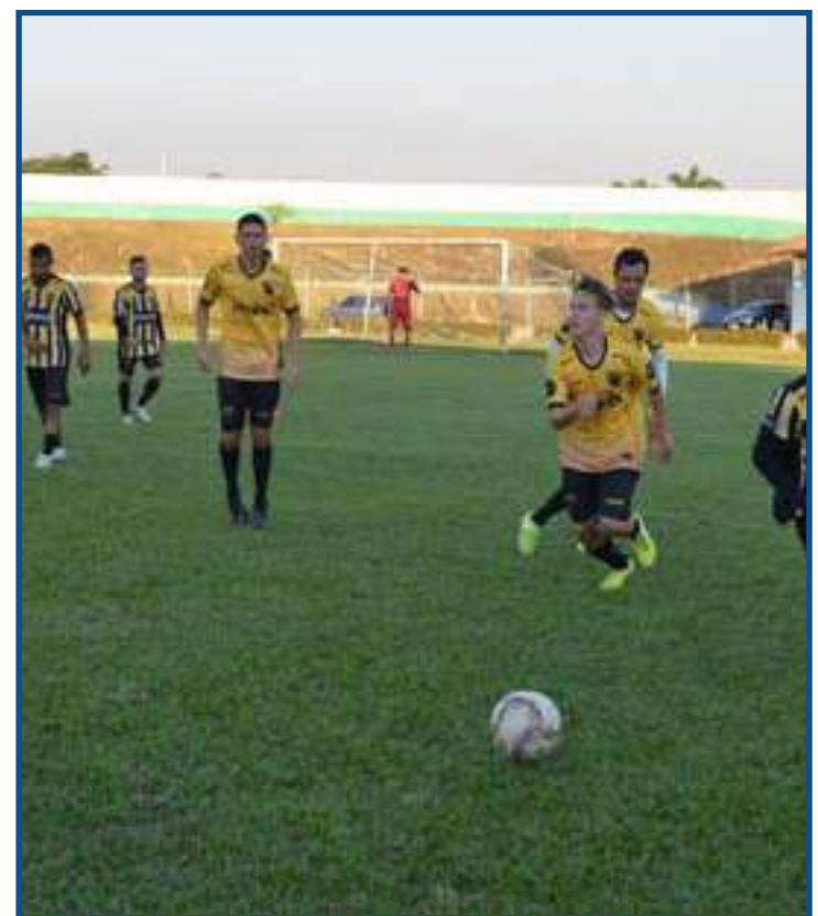
Equipe treina com foco na estreia da Segundona