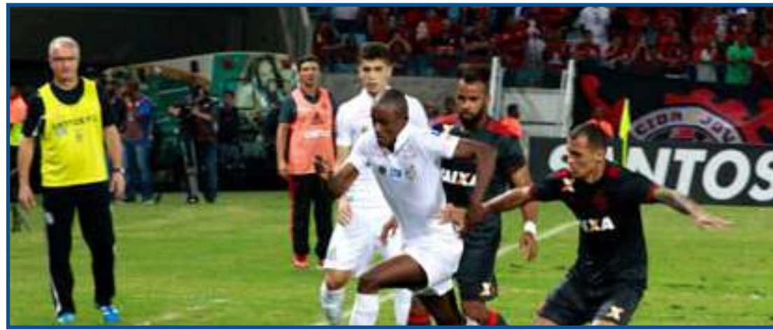
Melhor resultado foi empate sem gols com o Santos em 2016

Mesmo no jogo que teve o melhor desempenho,