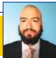
POR LEANDRO CARECA