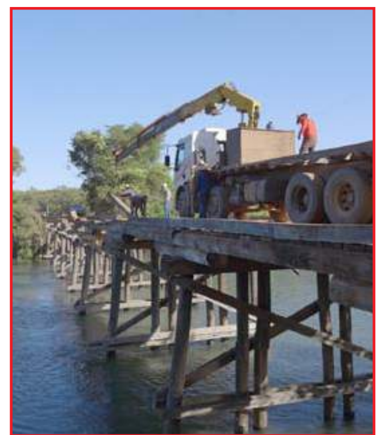
Prazo de conclusão da revitalização é de 30 dias

A aplicação da segunda dose é importante para que o organismo produza os anticorpos necessários para combater o vírus. Para o imunizante Coronavac (Sinovac/Butantan), o intervalo é de 14 a 28 semanas. Já para a AstraZeneca (Oxford/Fiocruz) e Pfizer, é de até 12 semanas. Observação: A data de retorno para recebimento da segunda dose pode ser verificada no próprio cartão de vacinação do usuário, próximo do registro da primeira aplicação.