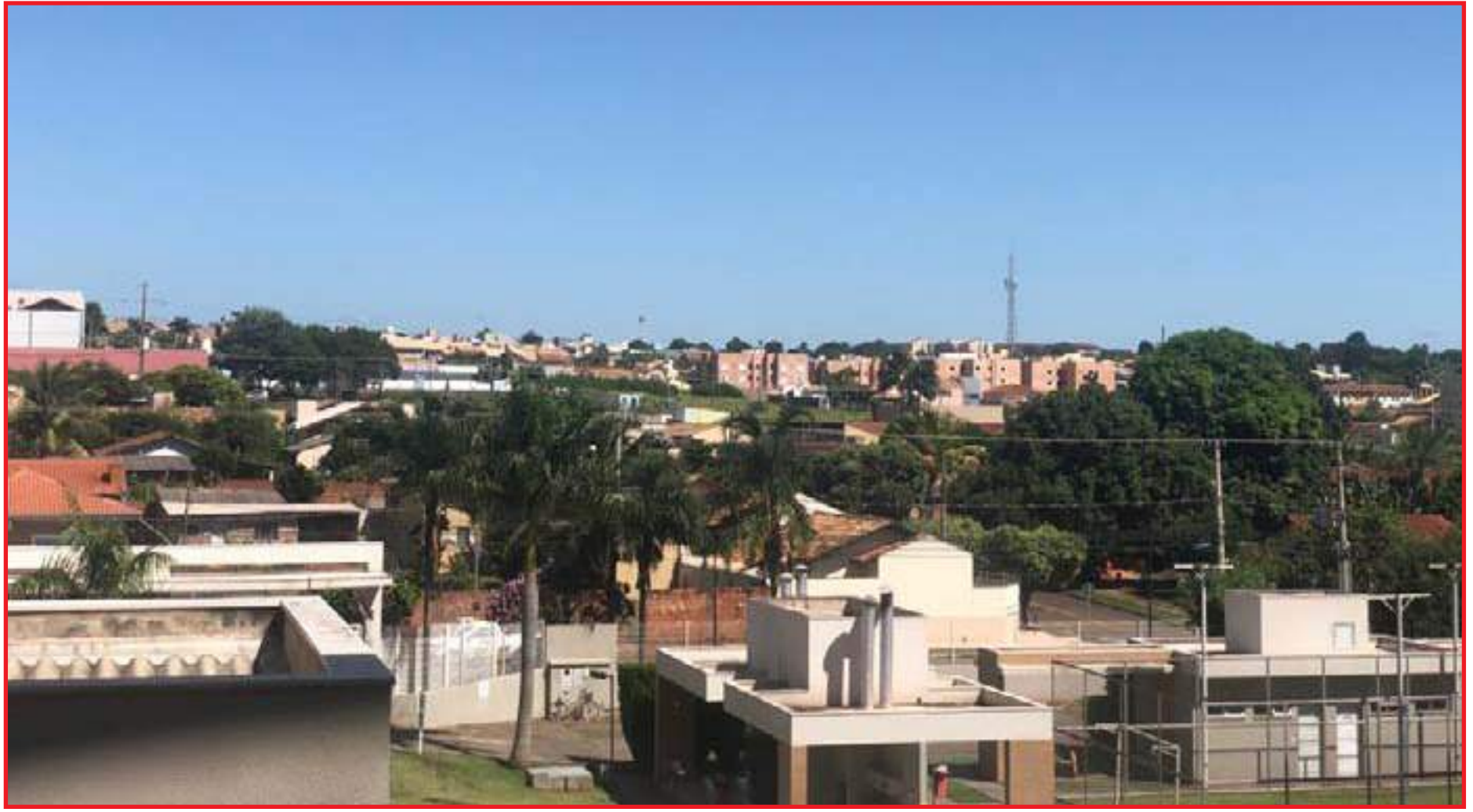
Após dias frios, temperatura volta a subir em Cuiabá

A temperatura deve seguir nessa média até terça (6). Na quarta-feira (7) o clima deve ficar ainda mais quente e a máxima deve ser de 37°C.