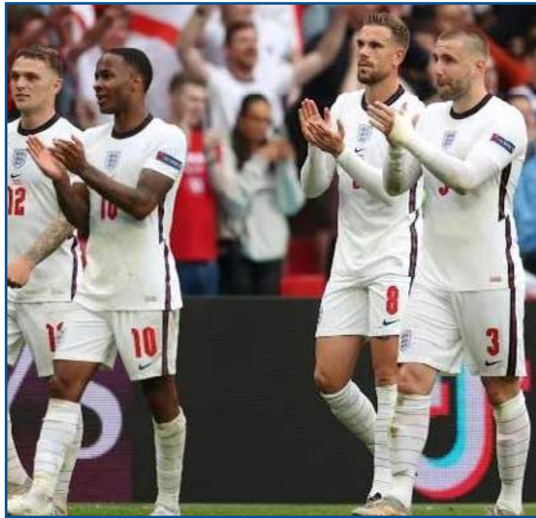
Jogadores ingleses comemoram gol diante da Alemanha

Os principais jogadores treinados por Andriy Shevchenko são Zinchenko, que atua pelo Manchester City, e Yarmolenko. Já do lado inglês, Gareth Southgate ainda não contará com Mason Mount, que teve contato com o volante Gilmour, da Escócia. Eles são companheiros de Chelsea e o escocês contraiu a Covid-19.