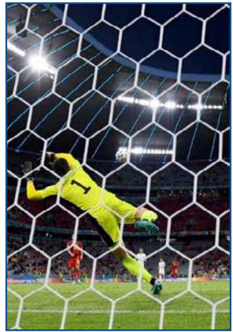
Insigne fez um belo gol na vitória sobre os belgas