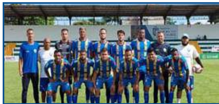
Poconé oficializou sua desistência junto à FMFMT

A abertura da competição está prevista para o dia 29 de agosto. O campeão será um dos representantes de Mato Grosso na Copa do Brasil de 2022.