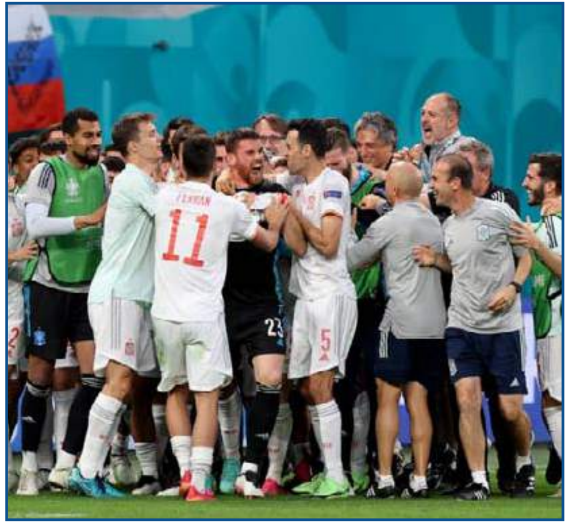
Jogadores da Espanha comemoram vaga na semifinal

Após 28 finalizações da Espanha contra apenas 8 da Suíça, a prorrogação também terminou empatada. O primeiro classificado às semifinais seria decidido nas