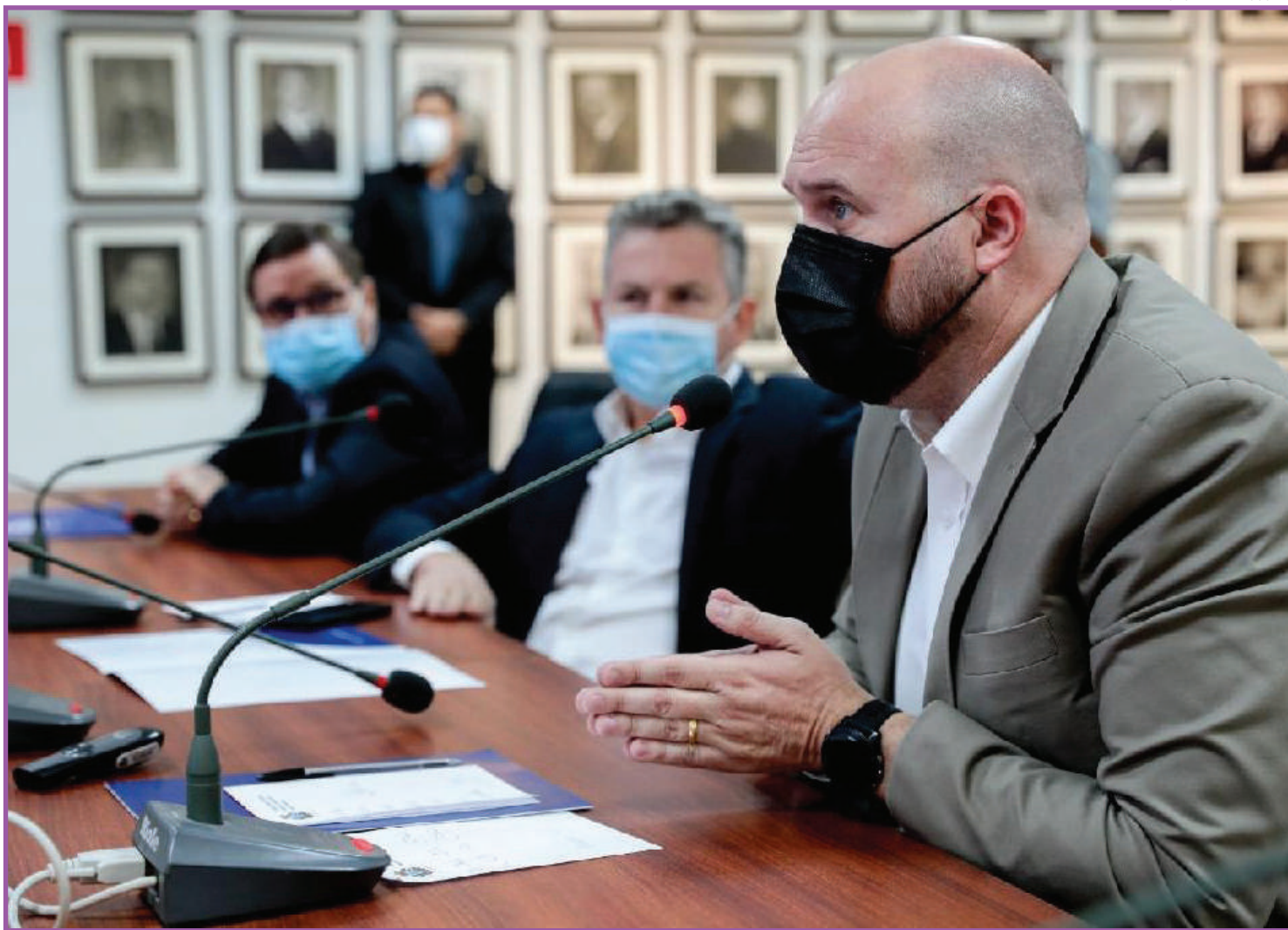
Total de investimentos no Projeto Olympus chega a R$ 3,2 milhões

"Um incremento de quase quatro vezes o orçamento inicial. Isso mostra o quanto o governo Mauro Mendes valoriza o esporte desde a base até o alto rendimento",