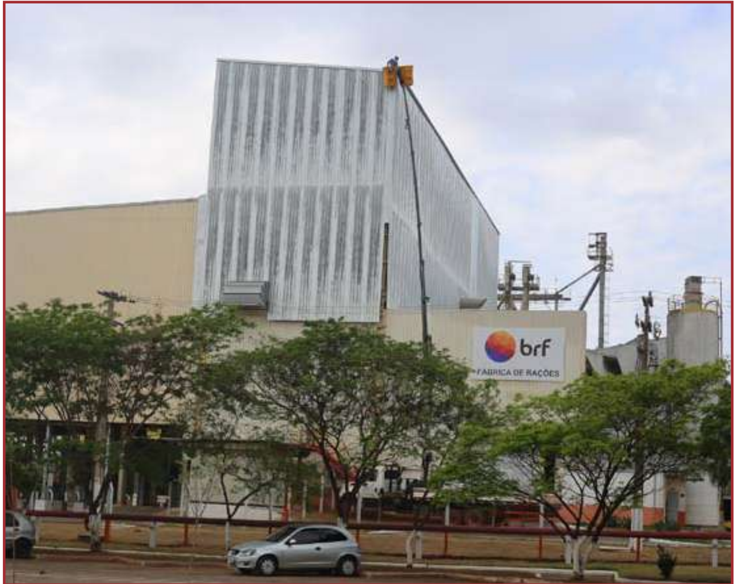
Crescimento robusta para os próximos 10 anos

Pautada pelos compromissos fundamentais de segurança, qualidade e integridade, a Companhia baseia sua estratégia em uma visão de longo prazo e visa gerar valor para seus 90 mil colaboradores, mais de 12 mil integrados, mais de 250 mil clientes no mundo, todos os seus acionistas e para a sociedade.