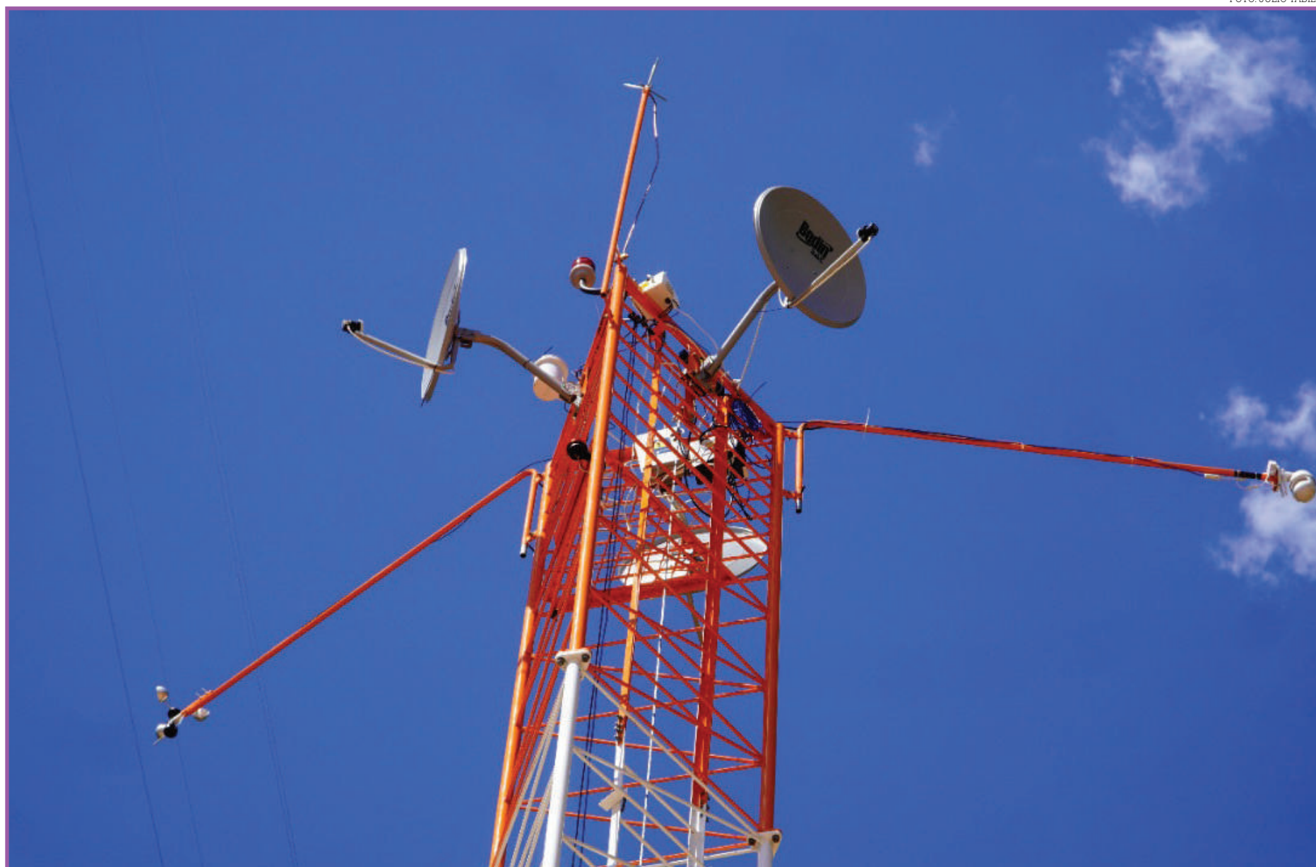
Torre com sensores tem 15 metros de altura

A Associação Mato-Grossense de Educação Ambiental (AMEA), de Sinop, com a colaboração científica da Universidade de Pepperdine, localizado na Califórnia, estado na região Oeste dos Estados Unidos, além do México, Namíbia e Quênia desenvolveram o software operado por inteligência artificial.