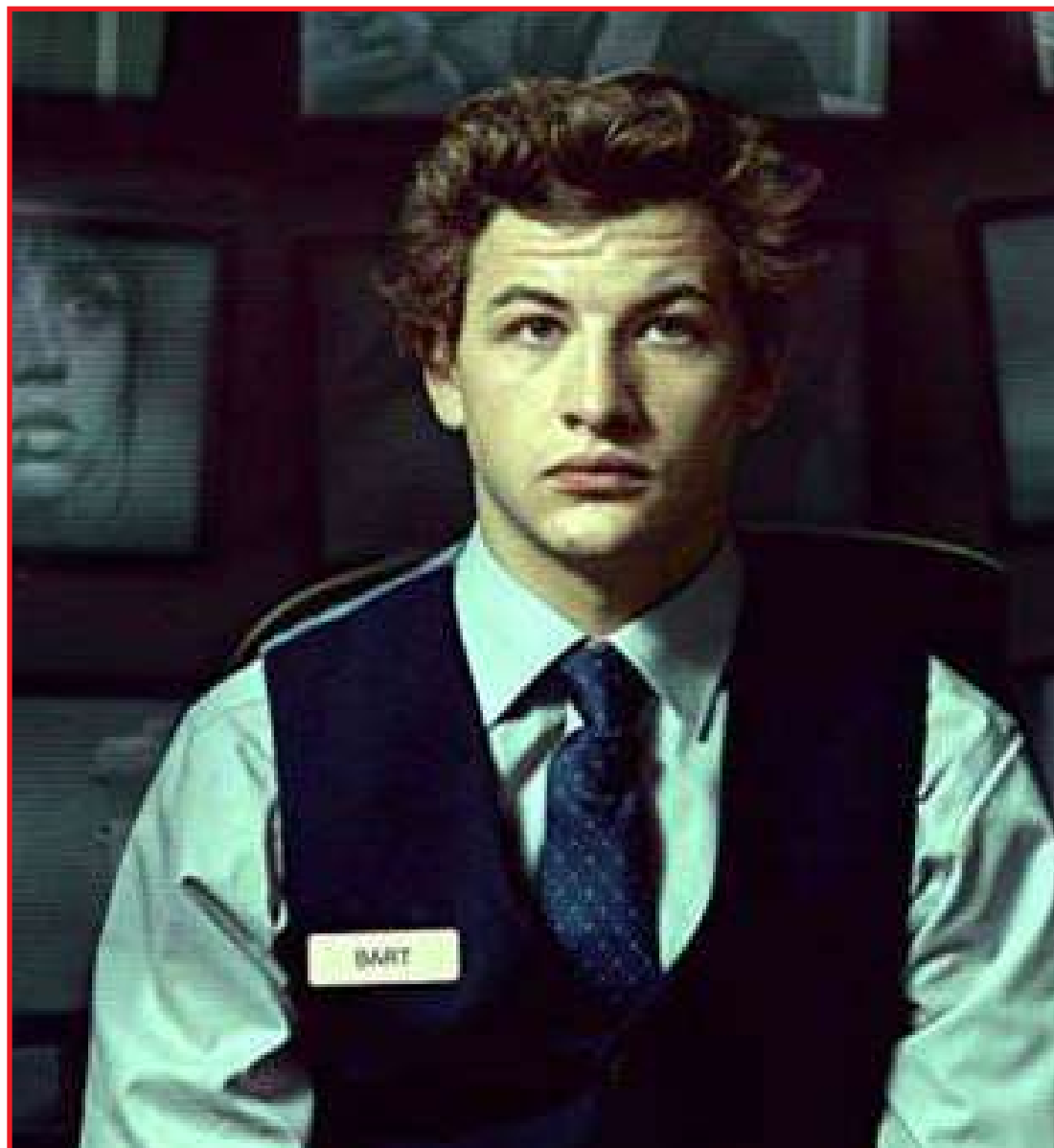
Jovem autista presencia assassinato e acaba se tornando suspeito de tê-lo cometido

"O Recepcionista" não sabe ao certo o tipo de filme que pretende ser. O suspense estilo "Janela Indiscreta" logo é deixado de lado, mas o drama sobre um jovem com transtorno do espectro autista tampouco é explorado. Elogiado por sua atuação, Tye Sheridan constrói um personagem com algumas nuances, mas caricato - como se o ator tivesse lido sobre o assunto e reproduzido todas as informações sobre o tema. Assim, Bart é um apinhado de clichês sobre síndromes do espectro autista, mas é necessário reconhecer o esforço do ator em um papel que não é de fácil composição. O roteiro equivocadamente ainda utiliza seu protagonis-