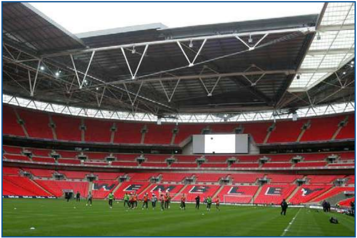
Wembley é o palco da decisão de domingo

Assim, não há como se apontar favoritismo, pois tanto a Inglaterra quanto a Itália fizeram boa campanha, neutralizaram seus adversários e mereceram chegar na fase final. Acredito que a Itália não irá utilizar a mesma tática