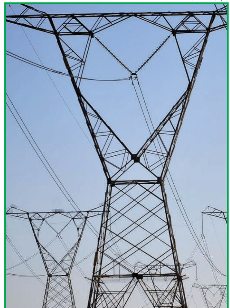
Informação foi divulgada pelo IBGE