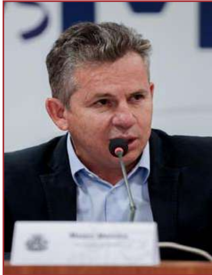
"É nosso dever ajudar a realizar esse sonho"

"Se hoje temos condições de anunciar esses investimentos, é porque conseguimos colocar o estado nos eixos e ter condições de fazer essas ações importantes. Estamos colocando R$ 15 milhões para concluir mais de 2.700 casas à nossa população. Só me resta agradecer a todos que têm trabalhado para isso: a população, o setor produtivo, comercial, nossos servidores, nossa base na Assembleia Legislativa e na bancada federal. É um trabalho feito por várias mãos", reforçou.