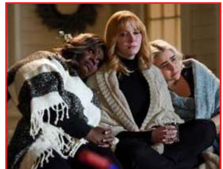
Retta, Christina Hendricks e Mae Whitman em cena de Good Girls