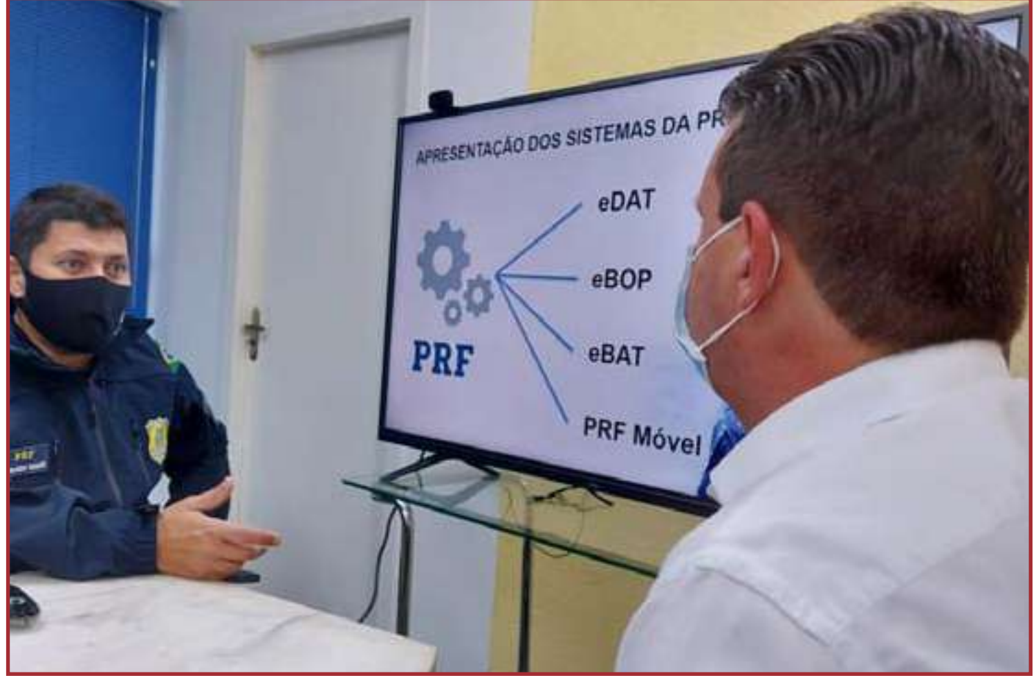
A coleta de dados é feita de forma padronizada