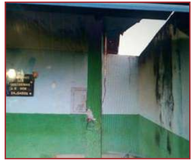
Levantamento do TCE aponta que 58 unidades são precárias em infraestrutura

Até 2022, pelo Programa Mais MT, serão construídas 35 novas escolas (contando com as 3 já entregues e as 10 em andamento) e 21 novas quadras poliesportivas. Em todo o estado, estão previstas reformas e ampliações em 380 escolas até 2022.