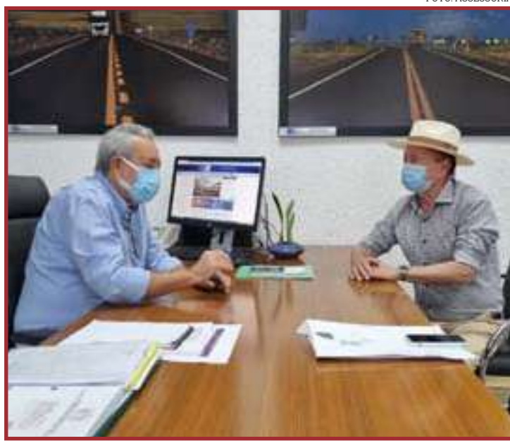
A municipalização da MT-140 também entrou em pauta