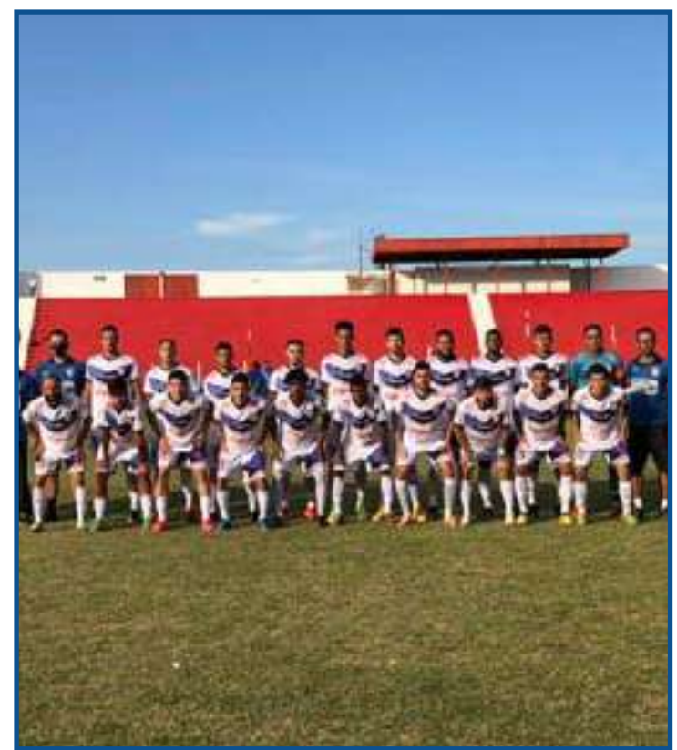
Academia somou 7 pontos e garante o acesso com mais duas vitórias