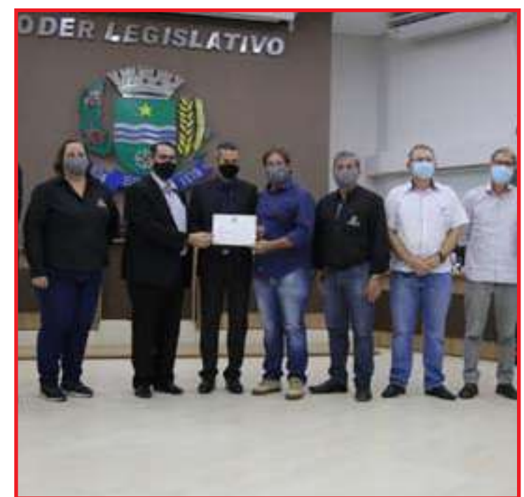
Diretores da Unesin recebem Moção de Aplauso pela luta em prol do Aeroporto