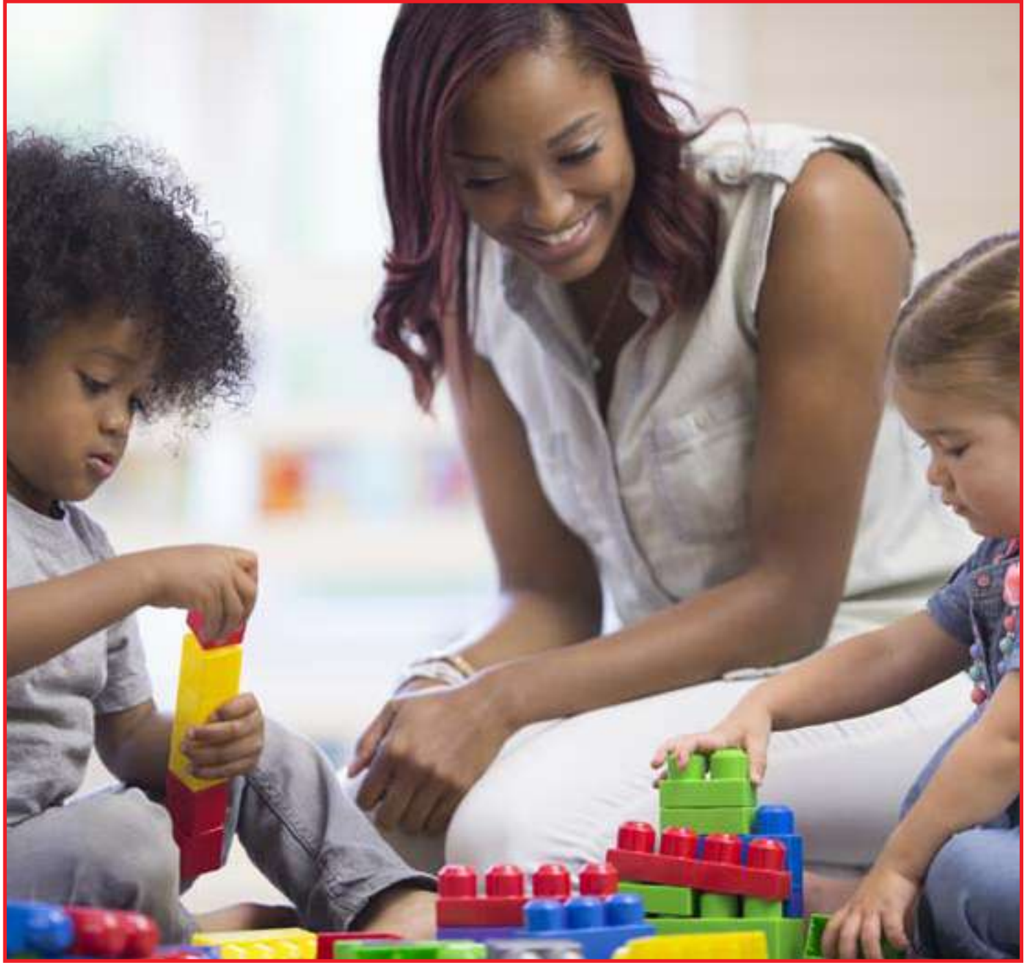
Crianças de férias precisam ser estimuladas

pais deem preferência a lugares mais vazios e orientem os filhos sobre evitar compar-