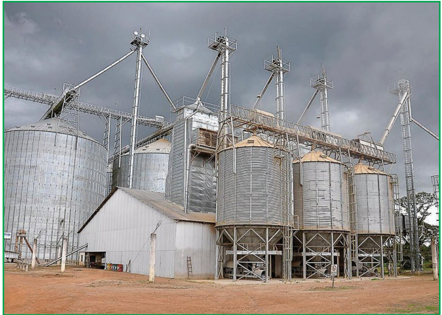
Armazéns pertencentes aos produtores podem ser fator estratégico para a venda

Conforme dados apresentados pelo Instituto Mato-grossense de Economia Agropecuária (Imea), com uma produção de grãos de aproximadamente 70 milhões de toneladas entre soja e milho, o estado conta com capacidade de armazenagem estática de pouco mais de 38 milhões de toneladas, sendo que apenas 30% destas estruturas estão em posse de produtores rurais.