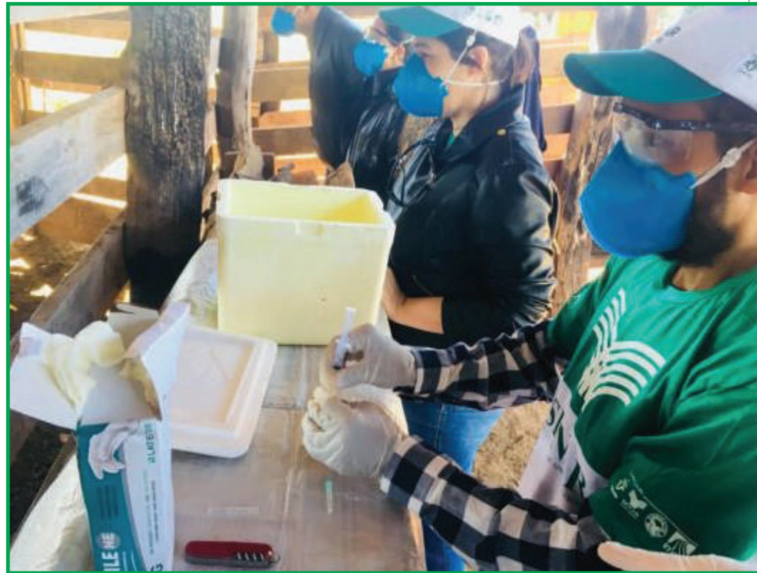
Profissionais são capacitados pra vacinação contra brucelose

Para se tornar um vacinador é obrigatório a realiza-