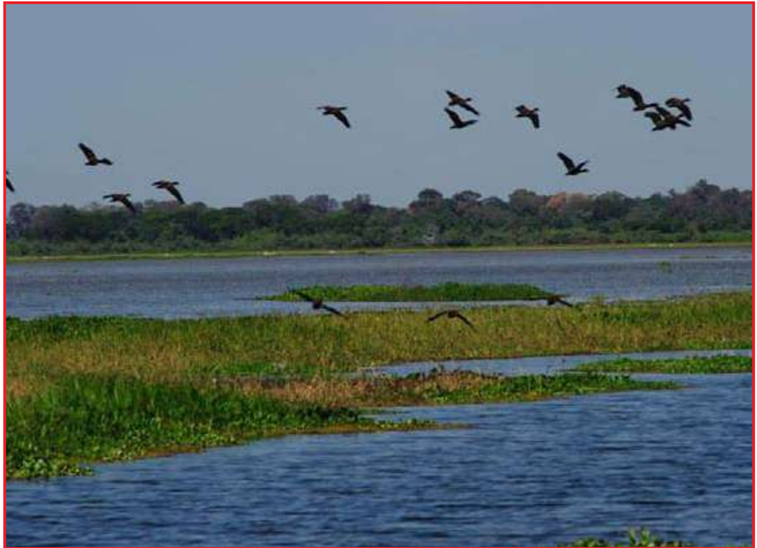
Medida deverá se estender até que estudo detalhado seja estabelecido

A elaboração do plano de ação deverá levar em consideração os dados e recomendações contidos nos relatórios técnicos anexados à inicial. Entre os problemas apontados estão o assoreamento da área úmida dos ribeirões Cupim e Água Branca, em ambas as margens da rodovia estadual MT-040; obstrução do fluxo de água na rodovia estadual MT-040, em razão da elevação do aterro, instalação de manilhas acima do nível de base e da própria insuficiência das estruturas de drena-