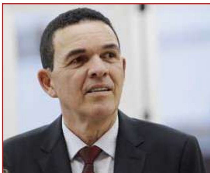
Juarez já destinou R$ 10 milhões para a saúde de Sinop

No início da tarde de ontem (14), o deputado utilizou suas redes sociais para confirmar o envio das emendas e disse acreditar que a gestão municipal fará um emprego desta verba. "Em um momento tão delicado que estamos vivendo com essa pandemia, tenho certeza que esse valor de R$ 4 milhões e 200 mil reais vai ajudar e muito. Conheço bem Sinop e sei da necessidade de colocar recursos na saúde. Por isso, destinei essas emendas, que foram pagas e já estão na conta da prefeitura", disse o parlamentar. Juarez ainda na mesma mensagem disse que ao longo desses dois anos e meio como deputado federal já destinou quantias consideráveis para a promoção da saúde na cidade de