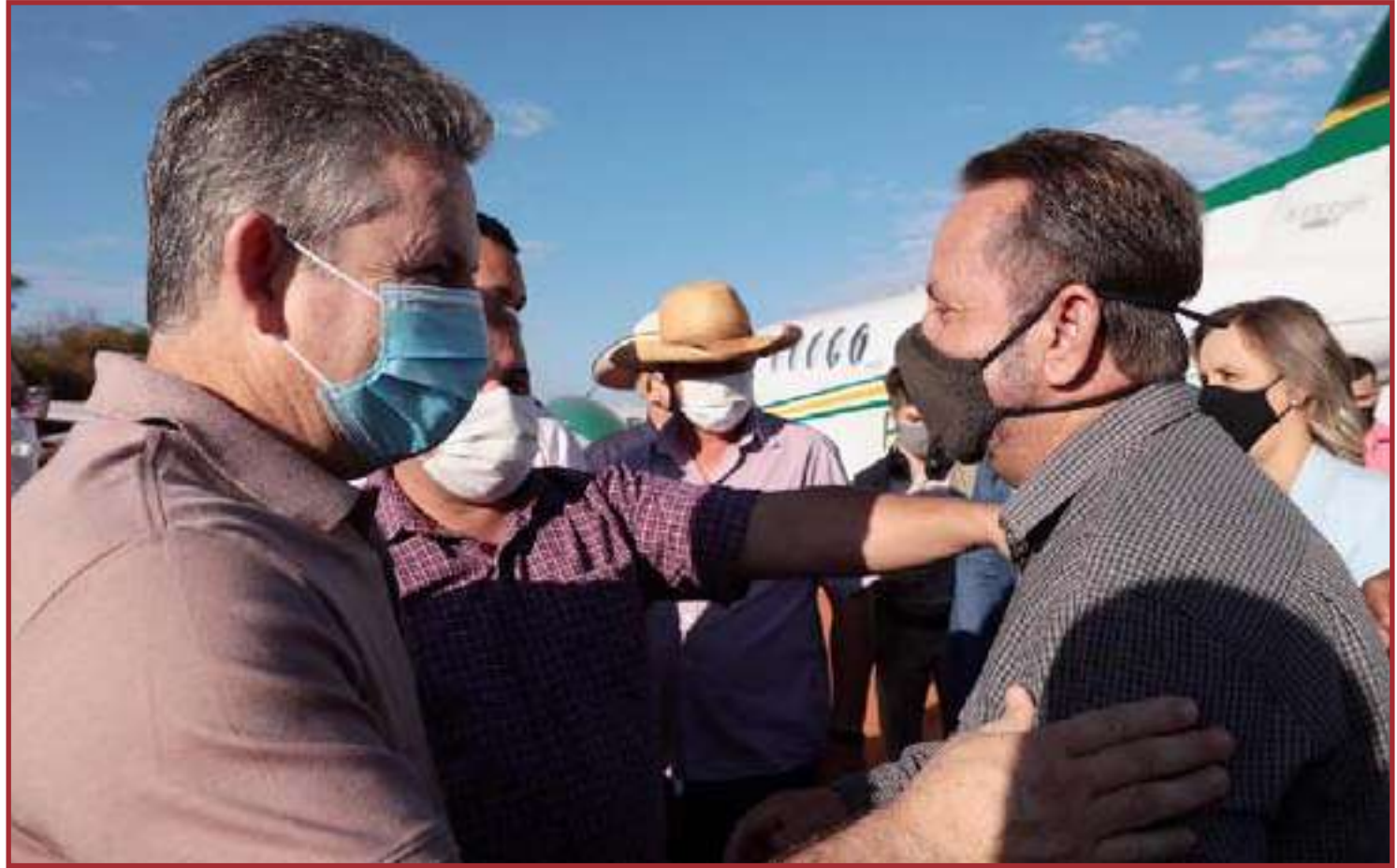
Vistoria aconteceu nos municípios de Porto dos Gaúchos e Tabaporã

"Ansiávamos por isso e é um sonho que o governador Mauro Mendes está realizando para a população. Tanto a conquista da ponte, como o asfaltamento da MT-220. Essa integração através da ponte e do asfalto vai transformar a região como um todo: vai facilitar muito para o escoamento das lavouras dos produtores