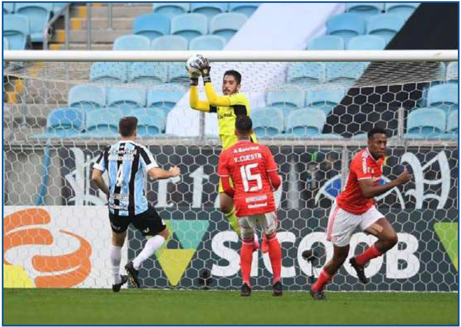
Daniel tem 16 jogos pelo Inter na temporada

O gringo agora busca confirmar as virtudes técnicas com a raça charrua. Na expectativa da partida, mos-