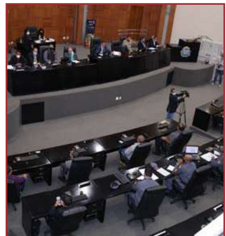
Projetos que garantem recursos para hospitais filantrópicos é um deles