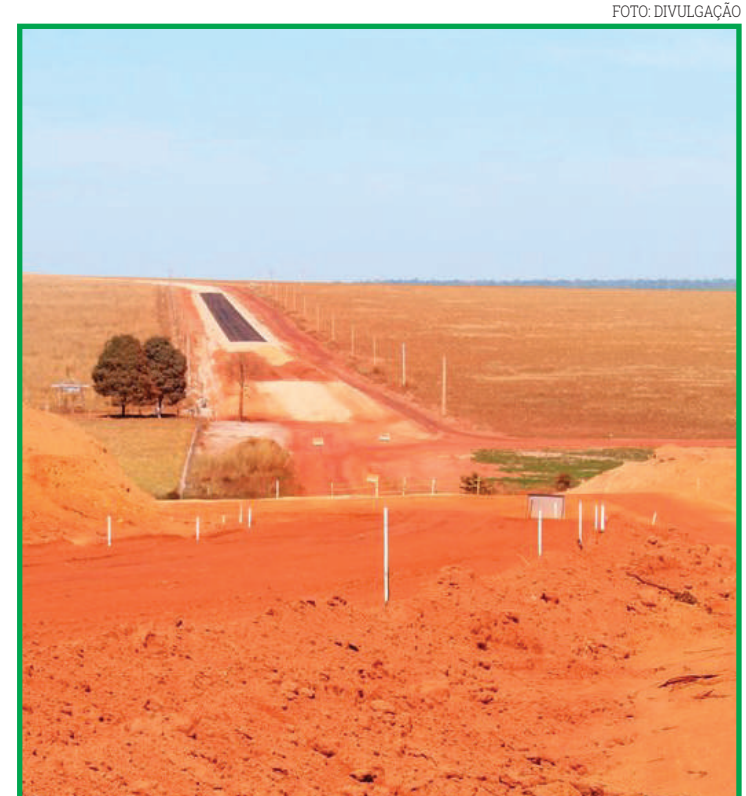
Rodovia tem extensão de pouco mais de 118 km

"O uso de drones nas atividades de rotina do órgão trará mais agilidade às fiscalizações, e consequentemente, mais eficiência ao serviço prestado. Por isso, iremos capacitar mais servidores para operar os aparelhos", ressaltou Tomazele.