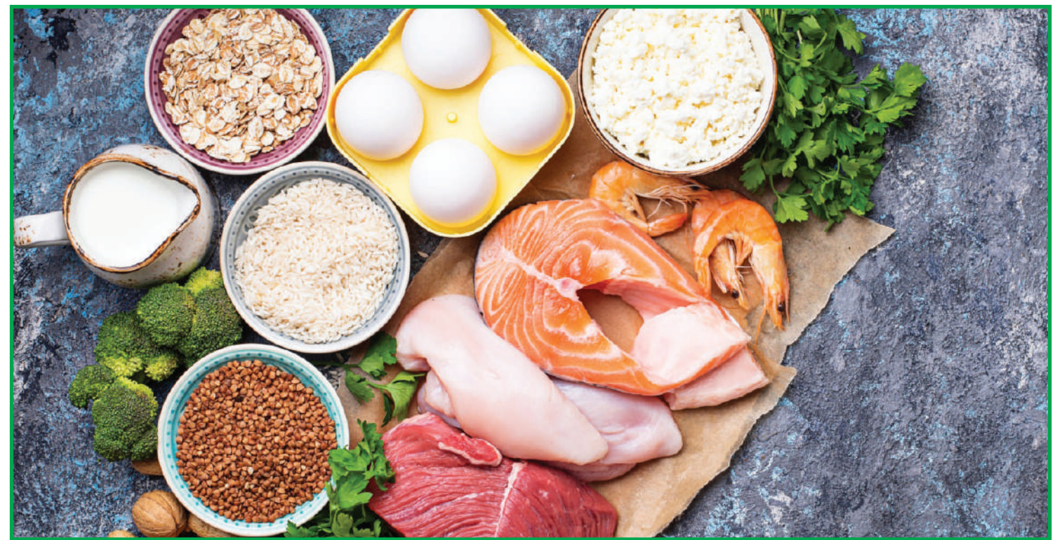
Preocupação é com impactos que podem ser causados por uma eventual restrição de cultivo

"Se a quebra do milho for realmente muito alta em função da cigarrinha, precisamos buscar alternativas na área de pesquisa, nas grandes instituições do país como a Embrapa, quanto universidades, para se fazer um trabalho de pesquisa e ver o que pode diminuir o impacto da cigarrinha ou acabar com ela, para que não haja penalizações em toda produção em Mato Grosso, principal-