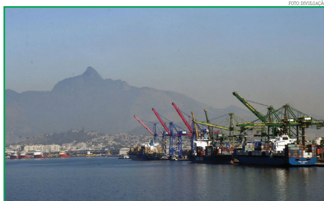
Altas previstas terão reflexo positivo no cálculo do PIB, diz entidade