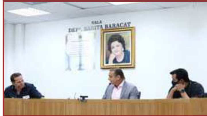
A proposta é uma unânime entre os parlamentares da Comissão

Por isso, a cobrança a ser discutida em Mato Grosso pode ter como parâmetro