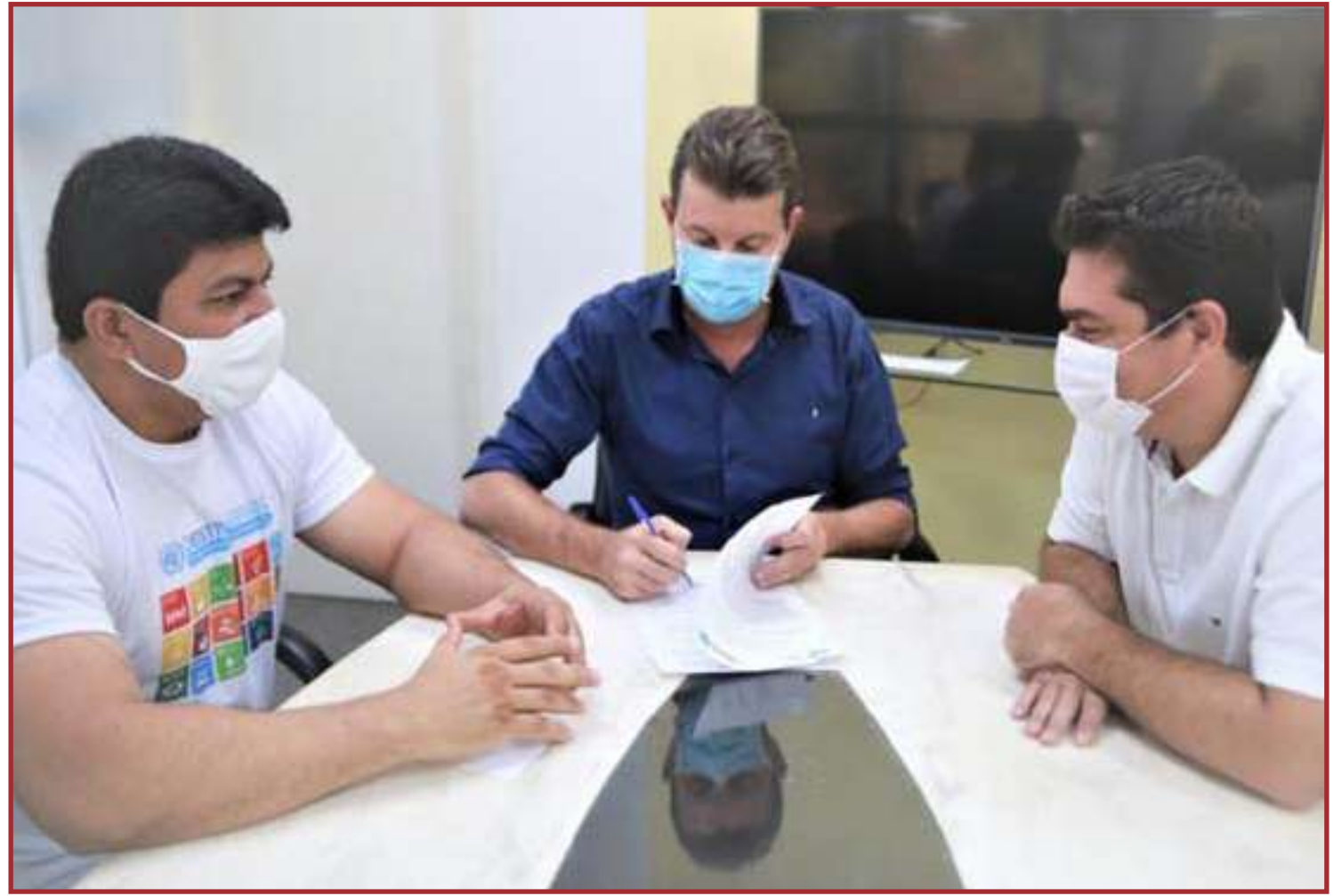
Sorriso é o 2º lugar quando o assunto é Transparência

A adesão ao PCS é mais uma ação em busca da consolidação da Capital do Agro como uma cidade que consegue equilibrar a balança dos aspectos sociais, econô-