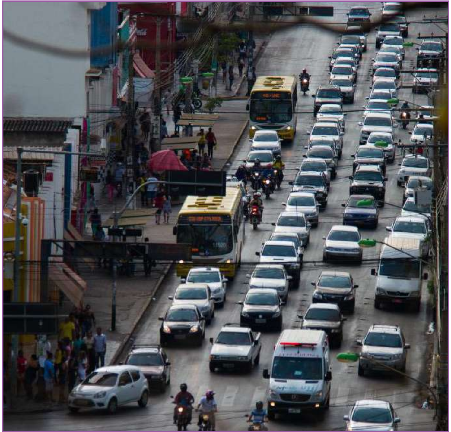
Trânsito no Avenida Isaac Póvoas no Centro de Cuiabá

É importante que o contribuinte fique atento às regras para parcelar o IPVA. Para essa forma de pagamento é determinado um o valor limite por parcela, de uma Unidade Padrão Fiscal (UPF/MT). Além disso, o parcelamento deve encerrar dentro do ano de 2021, ou seja, a última parcela deve ser quitada no mês de dezembro.