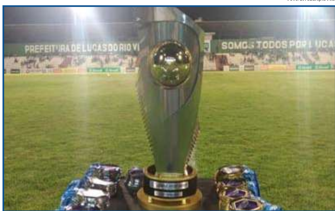
7 clubes estão na disputa pelo título, que vale vaga na Copa do Brasil/2022

Os jogos da primeira rodada são: Sinop x União Rondonópolis; Grêmio Sorriso x Cuiabá; Ação x Nova Mutum. O Dom Bosco não entra em campo na primeira rodada. O campeão garante vaga na Copa do Brasil de 2022.