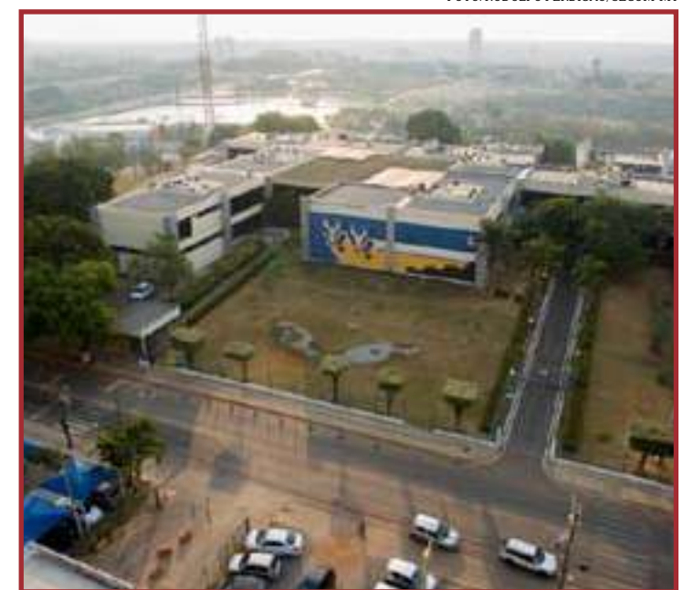
A sanção da Lei foi publicada em edição extra do Diário Oficial de quarta-feira