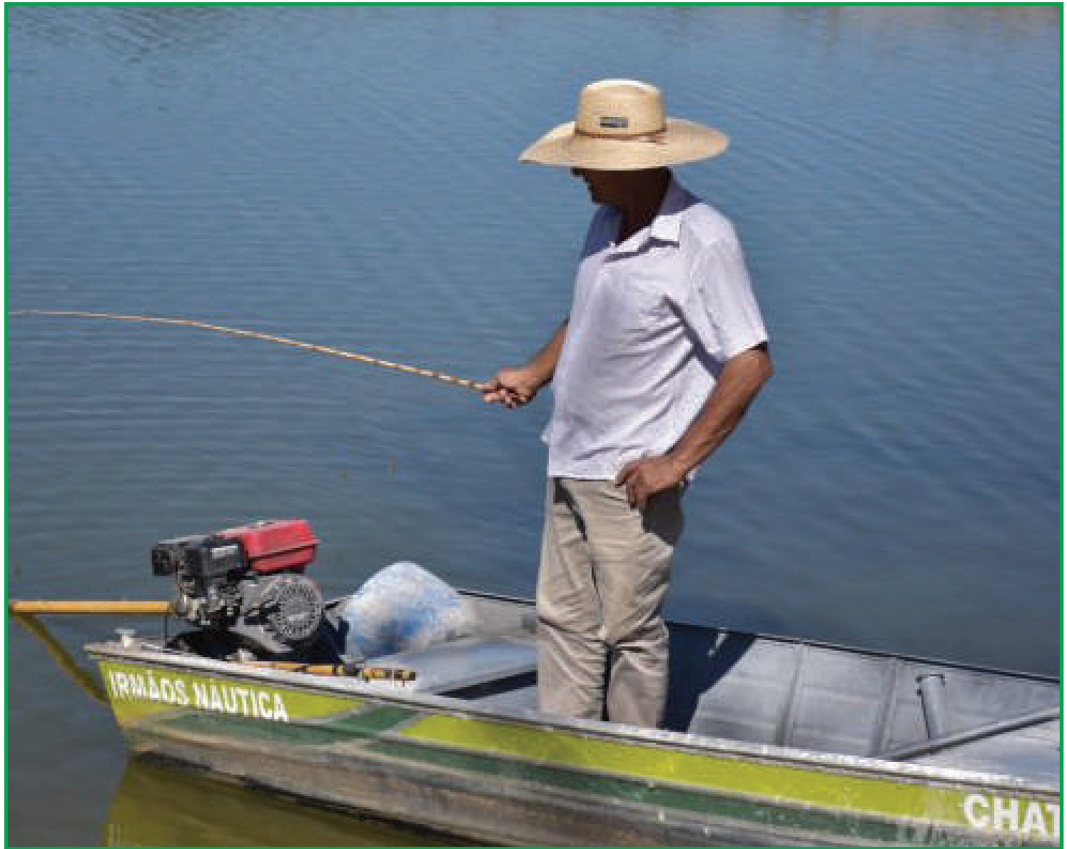
Produção tem dobrado com instrução feita pelo Senar