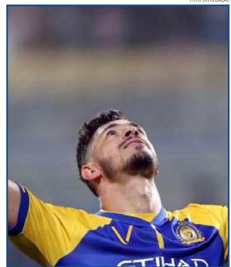
Jogador é a primeira contratação do Timão para a temporada 2021