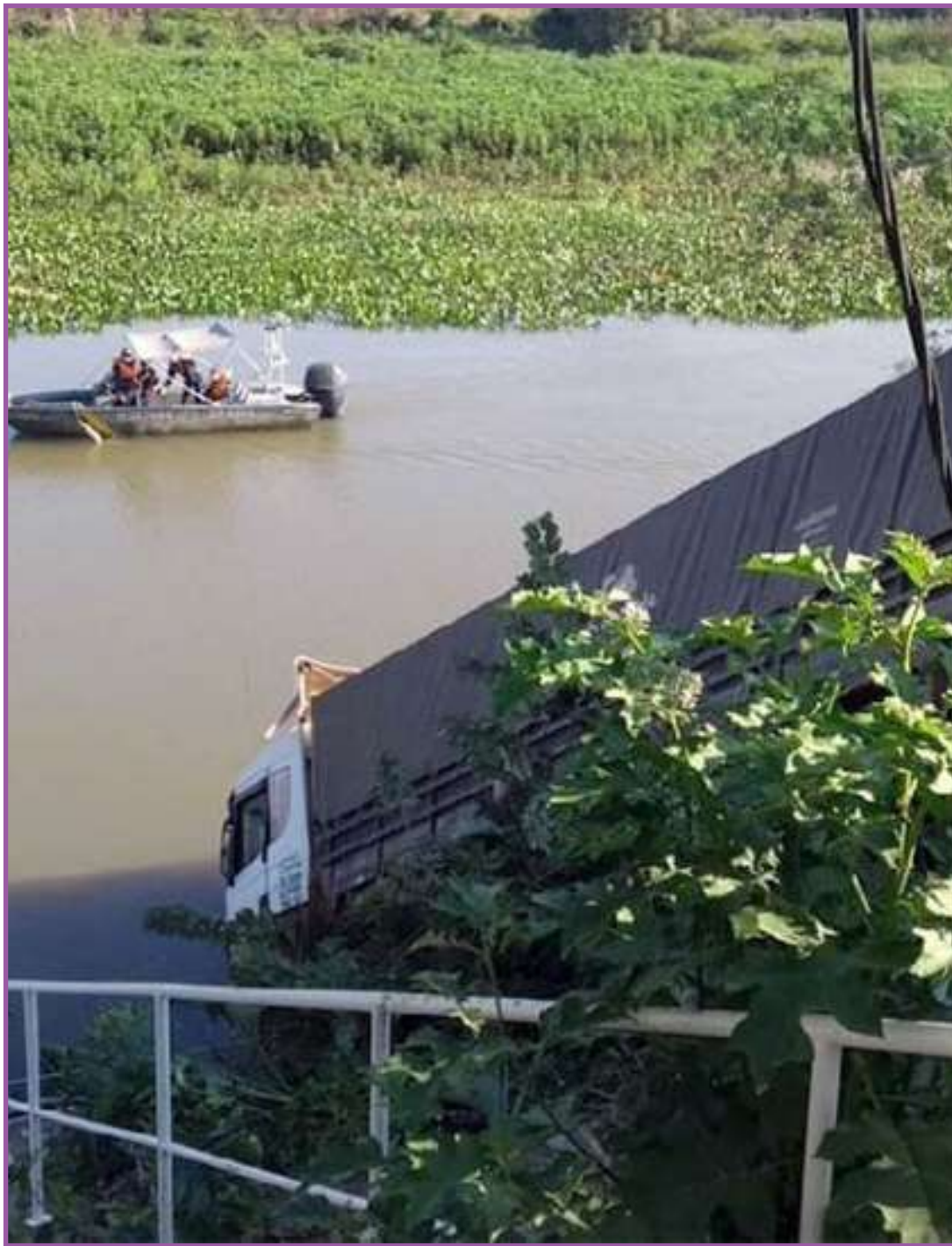
Caminhão furou barreira policial e caiu em rio

A caminhonete, ao ver a barreira policial, atingiu um Fiat Uno, branco, que seguia na rodovia. O motorista desse carro atingido foi socorrido, mas morreu. O passageiro estava bem e reclamava apenas de uma dor na região do peito. Duas pessoas que estavam na caminhonete deixaram o veículo e fugiram em uma mata. Enquanto isso, parte dos policiais fez buscas pelo motorista da caminhonete e os demais seguiram em perseguição do caminhão.