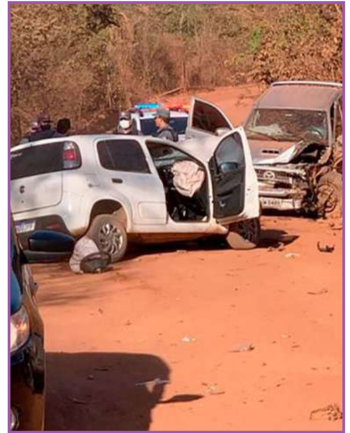
Hilux bateu em Uno, cujo motorista morreu