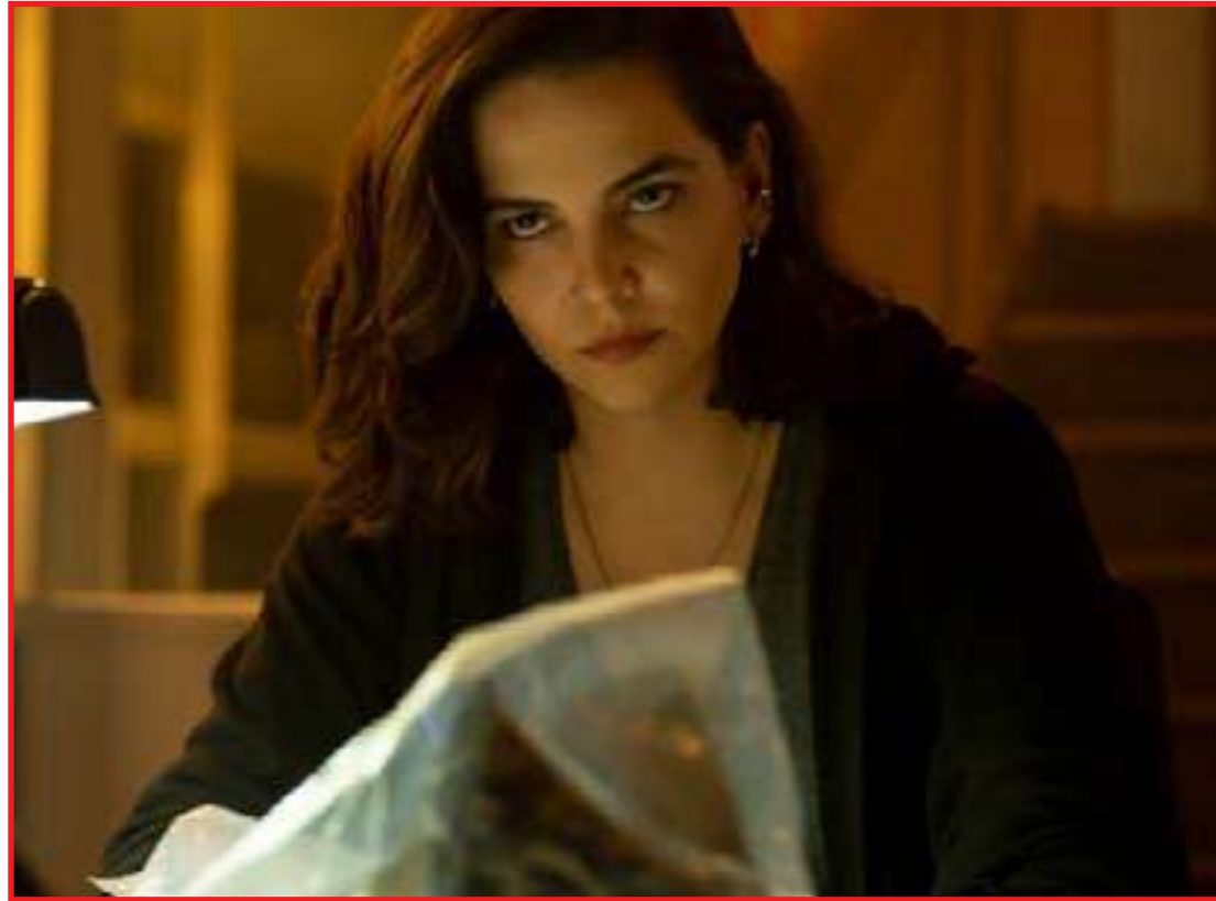
Série brasileira acaba não tem a mesma coragem do livro de Ilana Casoy e Raphael Montes

Não é uma história fácil de digerir. É visível que a produção se esforçou em como representar um tema tão delicado sem banalizá-lo. Isso transparece especialmente no arco de Janete, que é conduzido com tamanha sensibilidade que não transforma a dor em espetáculo, mas sim expõe as pequenas e contínuas violências cotidianas. A abordagem, porém, não impede que o seriado seja repleto de ação. O suspense policial carrega viradas a todo momento, e não desperdiça um minuto de seus oito episódios. O ritmo é rápido e os acontecimentos, intensos e impactantes. É surpreendente que um drama sobre algo tão pontual e doloroso seja tão maratona, sem perder a compostura.