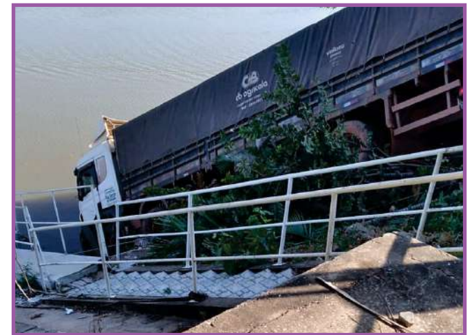
Caminhão passou reto e caiu em rio