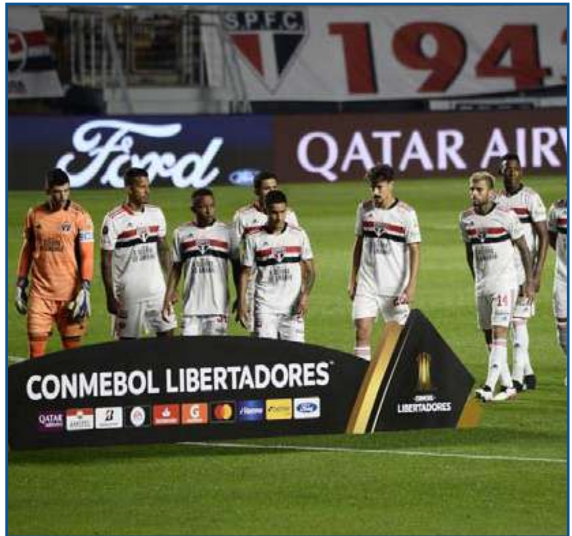
São Paulo encara o Racing nesta terça-feira

O argentino afirmou que vai “aguardar até o último minuto” e trabalha com alternativas para o jogo em Avellaneda, que pode alterar o contexto são-paulino na temporada. “Se queria tranquilidade, ficaria em casa (risos). Sabíamos que o trabalho era difícil, também pela situação financeira do São