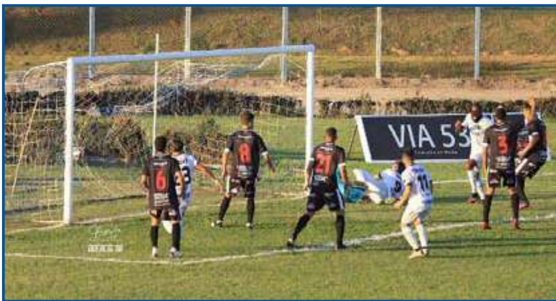
Fera do Norte venceu o Mixto por 2 a 0 e ultrapassou rival