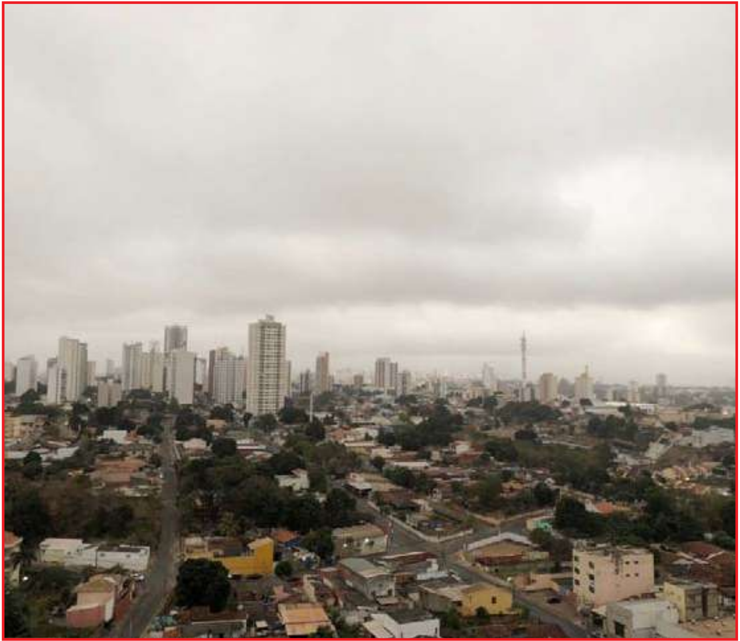
Nova massa de ar frio baixa temperaturas na Capital