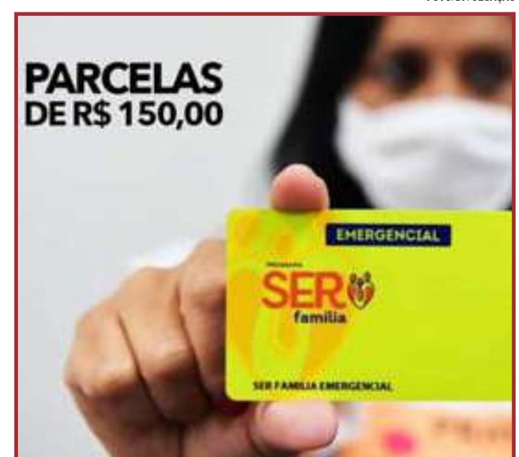
O recebimento é garantido com realização de curso de qualificação