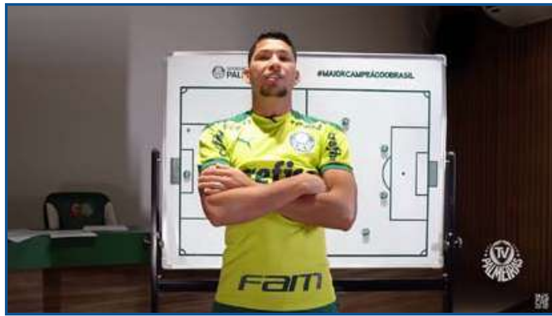
Jogadores explicam em vídeo detalhes daquela goleada

"O Abel sempre pede para que a gente olhe para