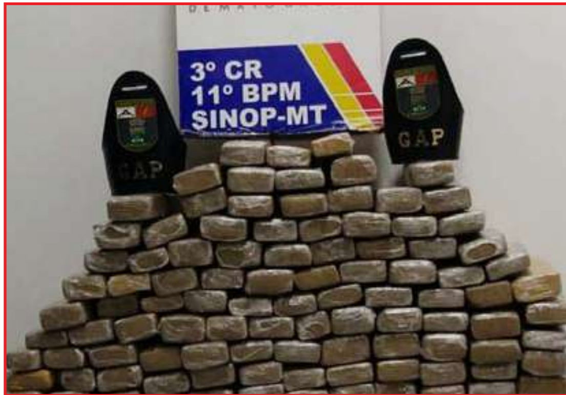
Droga foi localizada no Vila Mariana

"Nessa primeira ocorrência, foram detidos dois infratores, com uma quantidade menor de entorpecente. Mais tarde, recebemos informações de populares da possibilidade de uma residência estar sendo utilizada como ponto de armazenamento de grande quantidade de material entorpecente desses dois suspeitos", detalhou o tenente ao