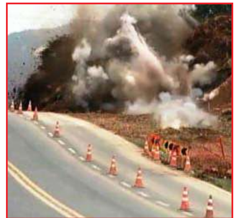
Trecho fica interditado às 16h