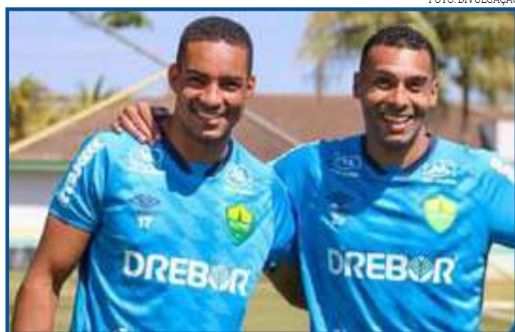
Com boas atuações dos dois atacantes, eles podem jogar juntos?