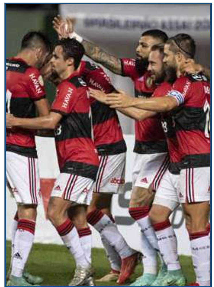
Defesa do Mengão está mais sólida com treinador