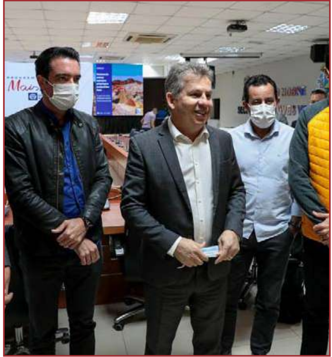
A ferrovia terá 700 quilômetros de linha férrea

"Estamos falando de um estado com grande extensão territorial e não tem outra forma de nos tornarmos competitivos senão pela logística. Esse trecho lançado no edital tem um impacto direto no município de Primavera do Leste e na região Sul do Estado, pois poderemos fazer o escoamento dos produtos que compõem os três pilares do Município: agrícola, indústria e o comércio. Com isso, poderemos fazer com que os grandes produtos de Primavera do Leste possam ser escoados nessa interligação de Rondonópolis", explicou.