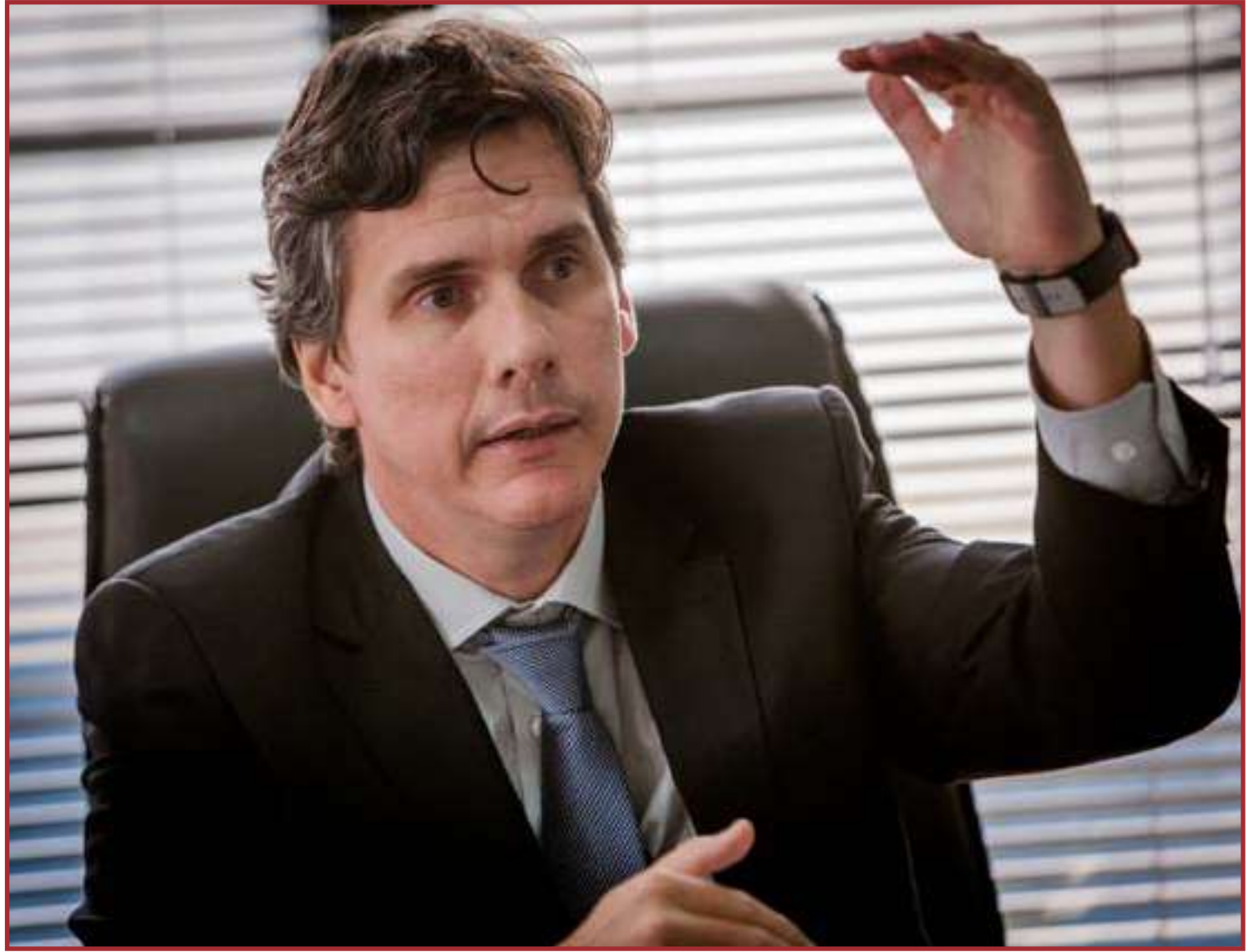
O benefício fiscal não era passado para o consumidor