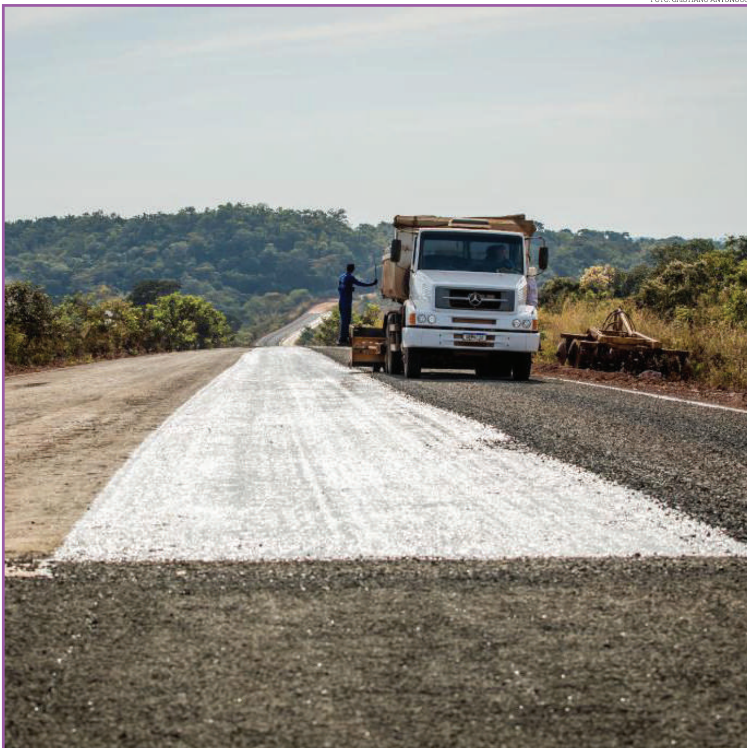
Governo investe e fiscaliza obras de pavimentação e restauração

Além desses dos locais, também está em andamento a pavimentação de 18 km da MT-100, do trecho que vai do fim da pavimentação em Torixoréu até o início da pavimentação para Pontal do Araguaia. Já em Barra do Garças, está em andamento a pavimentação de 51,8 km no trecho que vai do entroncamento da BR-070/158 ao entroncamento da MT-336, em Araguaiana. Todas essas obras são acompanhadas e fiscalizadas regularmente, de modo a garantir a qualidade de todas as fases executadas. "A Sinfra possui contratos de supervisão de obras, justamente para realizar os ensaios de controle tecnológico e garantir qualidade e segurança aos usuários que irão trafegar nesta rodovia", concluiu o secretário adjunto.