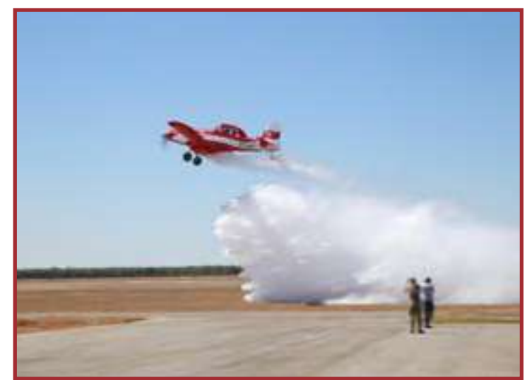
As aeronaves disponibilizadas são as mais eficazes para a ação