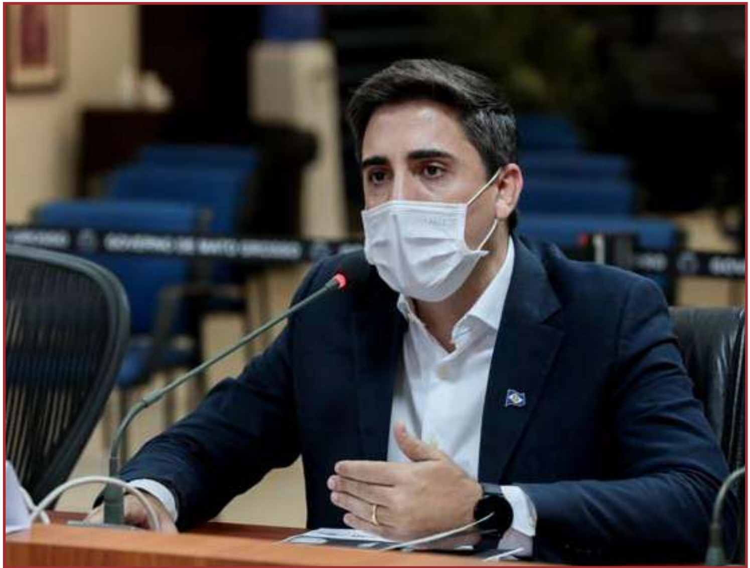
Volta está marcada para o próximo dia 3

O governador Mauro Mendes (DEM) disse que respeita o posicionamento do Sintep, e afirmou que, nas viagens pelo interior do estado tem conversado com diretores e assessores peda-