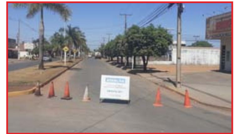
Secretaria orienta que motoristas busquem rotas alternativas