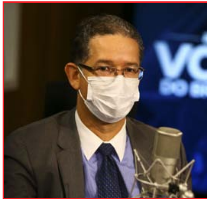
Secretário cita ações para brasileiros economizar energia em casa

O secretário de Energia falou sobre as atitudes que o brasileiro pode tomar para ajudar na economia de energia elétrica como desligar a luz dos cômodos que não estão sendo utilizados, fechar a porta do cômodo que utiliza ar-condicionado ou aquecedor, evitar abrir