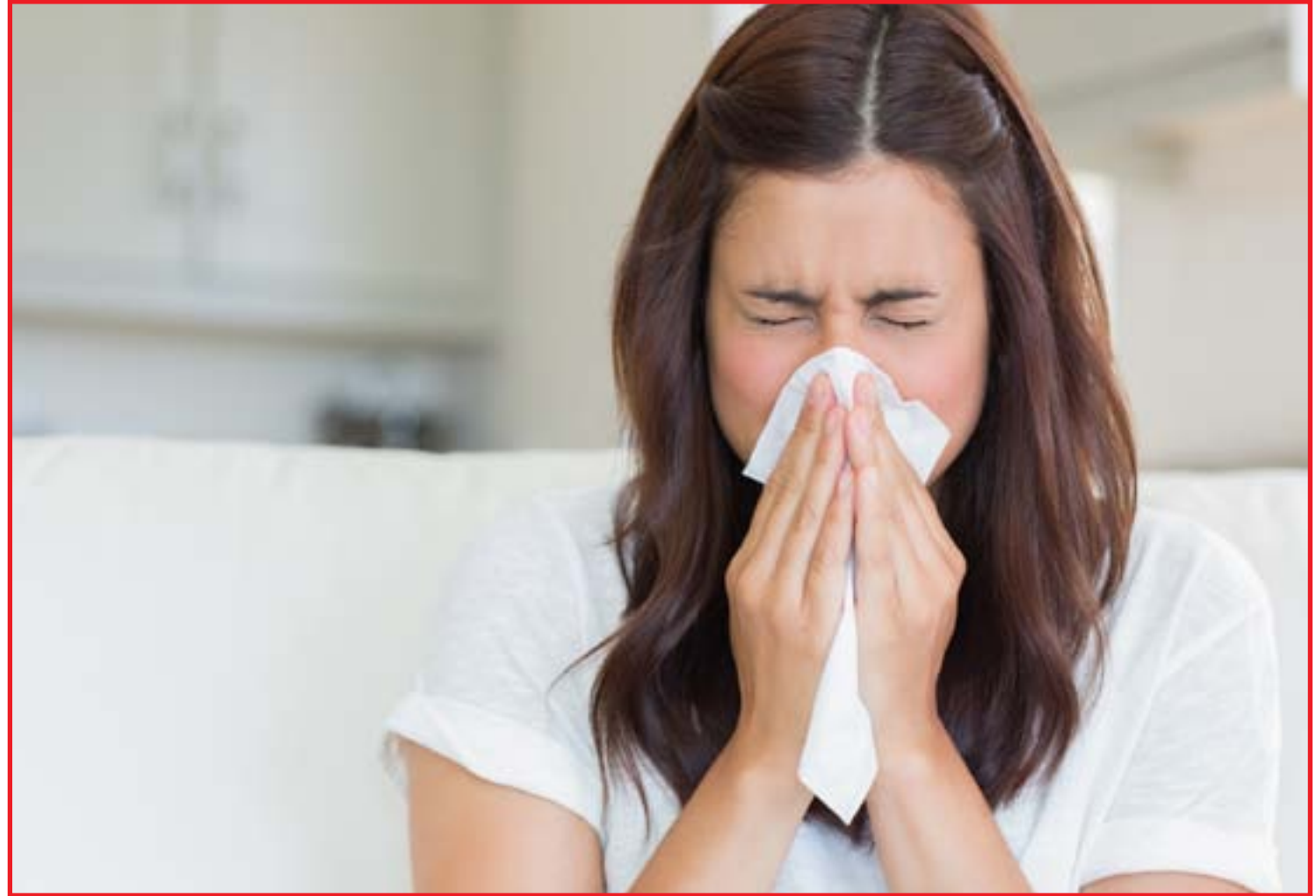
Saiba diferenciar gripe do resfriado

O rinovírus é transmitido pelo contato direto ou indireto com as secreções da pessoa infectada e o período de incubação é de pouco menos de dois dias. Os sintomas atingem o pico de um a três dias após o contágio e persistem de sete a 10 dias, embora ocasionalmente possam permanecer por até três semanas. A gripe é menos frequente, mas é uma grande questão de saúde pública, já que é mais letal. O resfriado, por sua vez, não costuma gerar muitas preocupações. De acordo com a Organização Mundial de Saúde (OMS), o vírus Influenza infecta cerca de um bilhão de pessoas anualmente e mata até 500 mil pessoas no mundo por ano. Ao contrário da gripe, que pode se agravar em pessoas idosas, a incidência dos resfriados diminui com o envelhecimento. Crianças de até dois anos se infectam cerca de seis vezes ao ano, enquanto nos adultos esse número diminui para duas a três vezes e, em idosos, cai para apenas uma vez ao ano. Passada a infância, a febre também costuma ser um