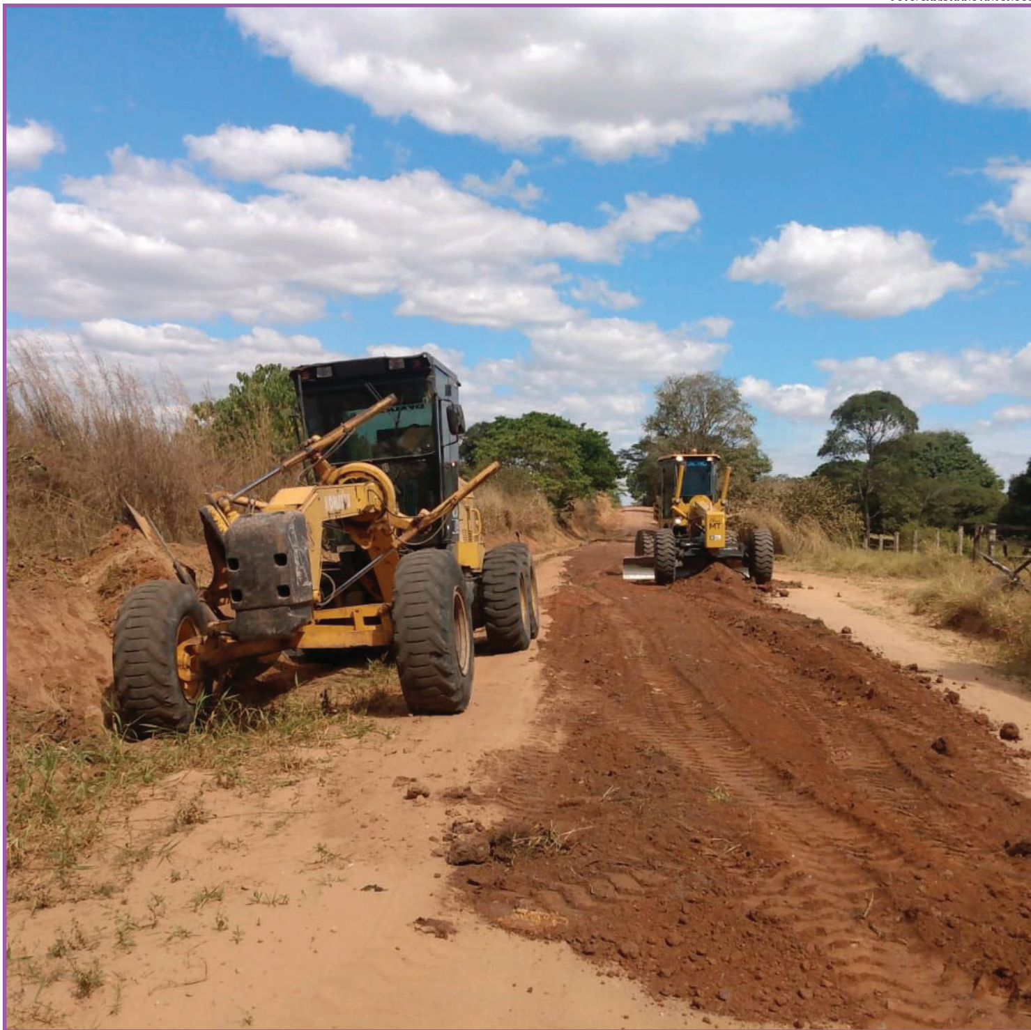
Investimento feito pelo Estado foi de R$ 42,2 milhões

Entre as associações beneficiadas estão a Associação dos Produtores do Vale do Rio Roosevelt (Aprovale) e a Associação Santa Emília (AESE). Além dos equipamentos entregues, outro lote de máquinas ainda será repassado pelo Estado a outras entidades e municípios. Ao todo serão entregues 175 máquinas e equipamentos rodoviários, cujo investimento soma R$ 96,5 milhões de modo a atender todas as regiões do Estado.