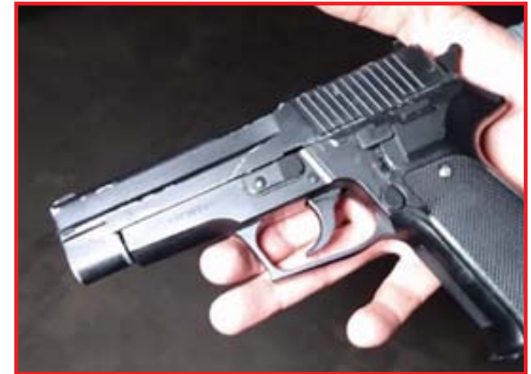
Jovem foi baleado em assalto e morreu