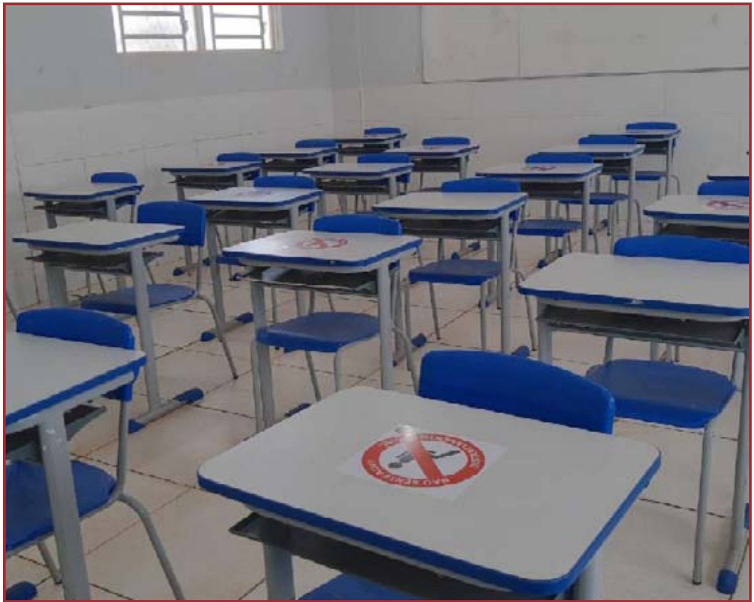
Revezamento será elaborado por cada unidade escolar

Quanto aos estudantes com comorbidades, a orientação é que continuem em atividades 100% remotas neste primeiro momento, mas a participação presencial poderá ocorrer desde que o responsável assine um termo de autorização na unidade escolar.