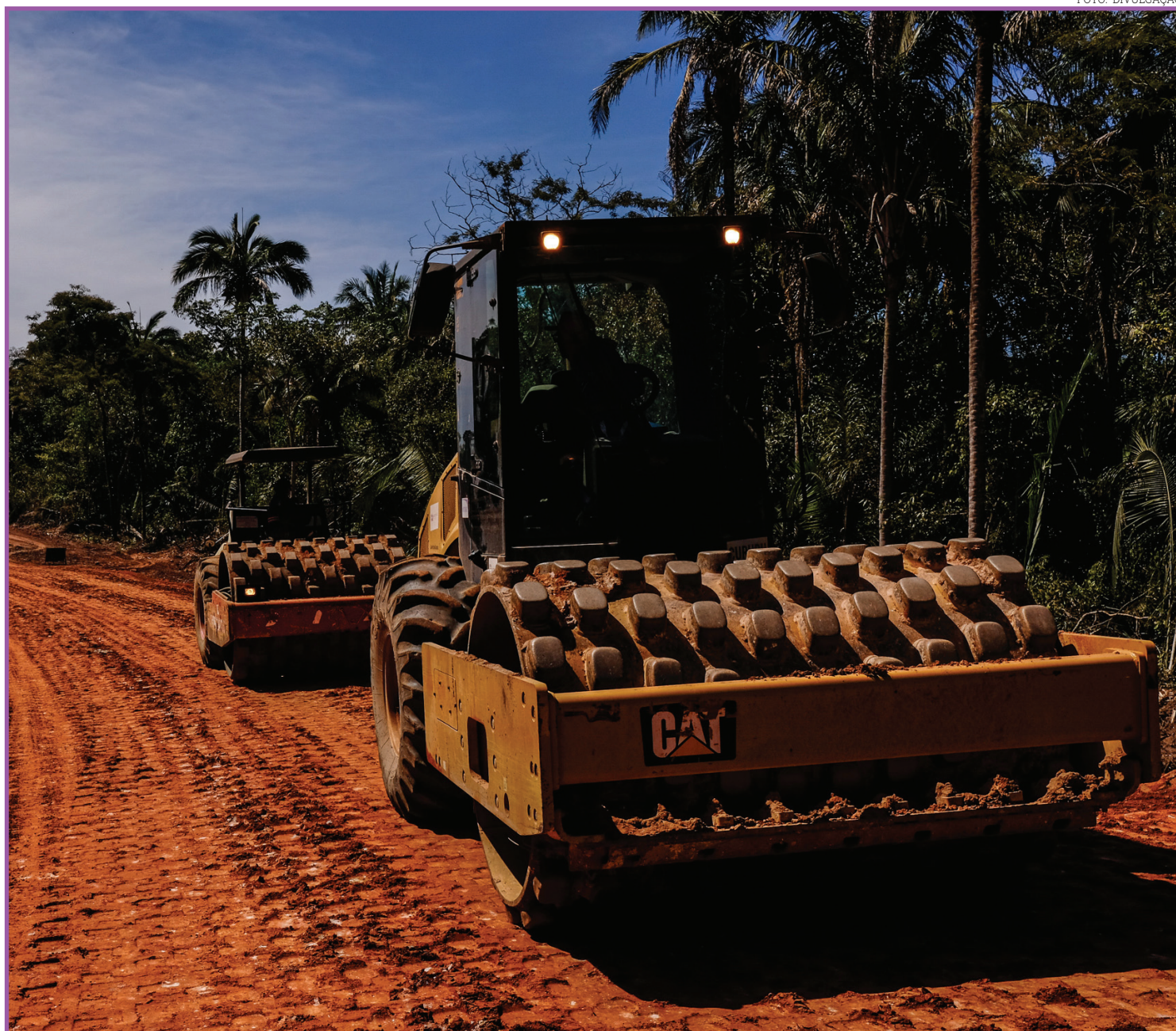
A obra vai concluir a ligação dos distritos de Mimoso, em Santo Antônio do Leverger, e São Lourenço de Fátima, em Juscimeira, por via pavimentada

tivo, quanto demais documentações complementares, assim como o edital,