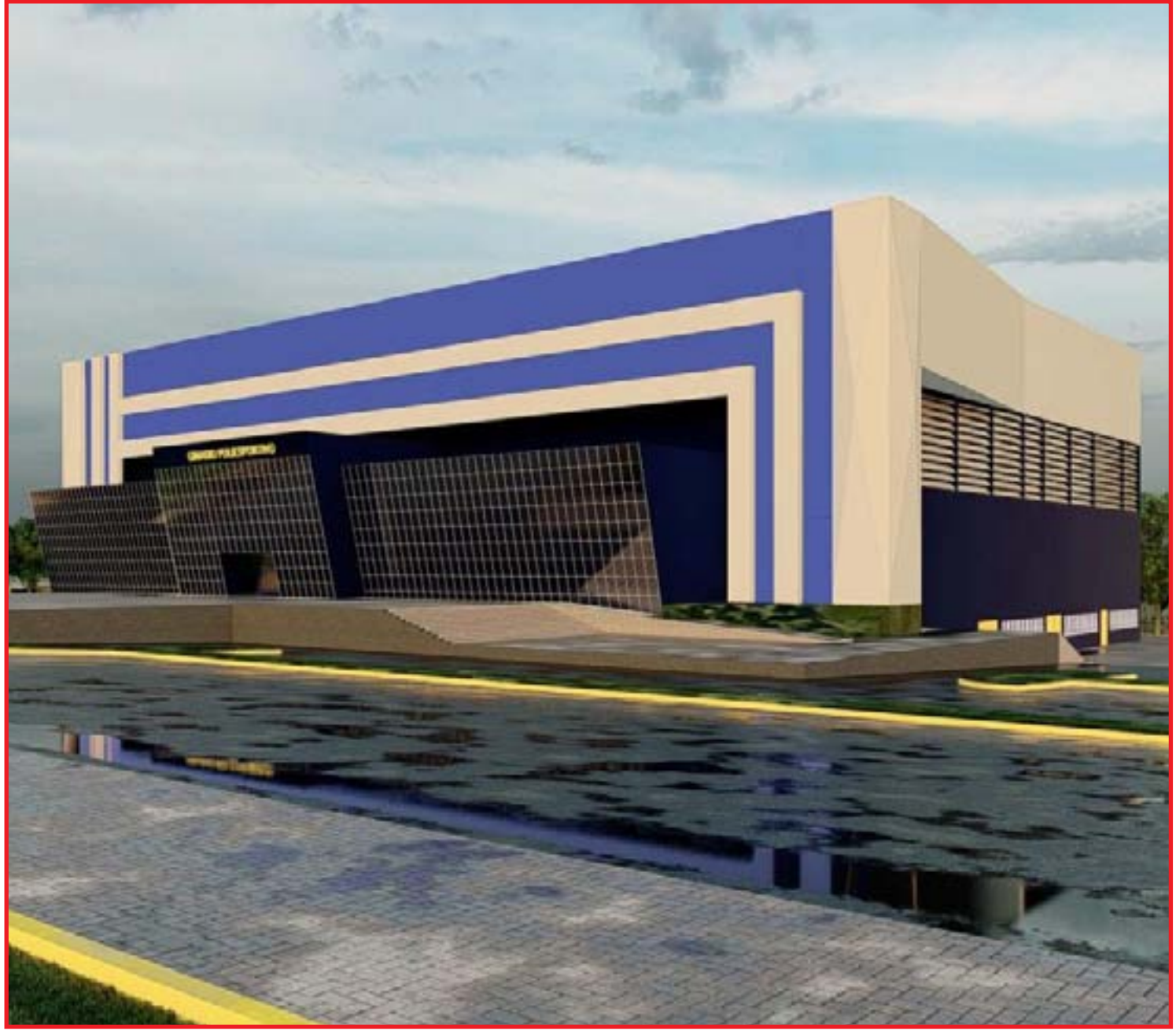
Sonho é construção de uma vila olímpica em Sorriso

Vale lembrar que a licitação de determinado bem ou serviço é o processo necessário para que a Administração Municipal possa fazer esta compra ou contratação, sempre com base nos alicerces da transparência, economicidade e qualidade. No entanto, o fato de ter determinado item licitado não implica necessariamente em sua compra ou contratação na totalidade.