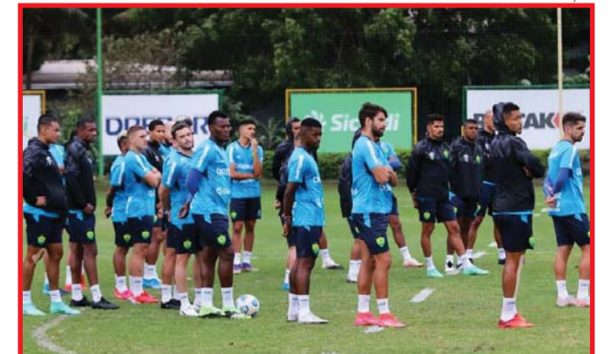
Dourado ocupa apenas a 15ª posição na classificação