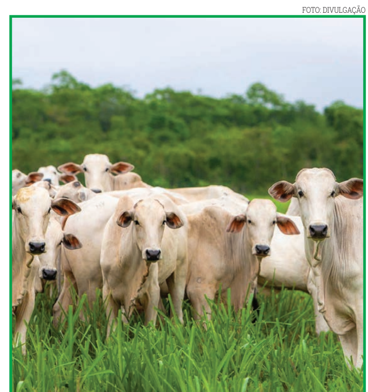
Alta nos preços do milho e soja para ração como um dos fatores

trabalho diário. Mato Grosso ocupa atualmente o 11º no ranking nacional da produção de leite.