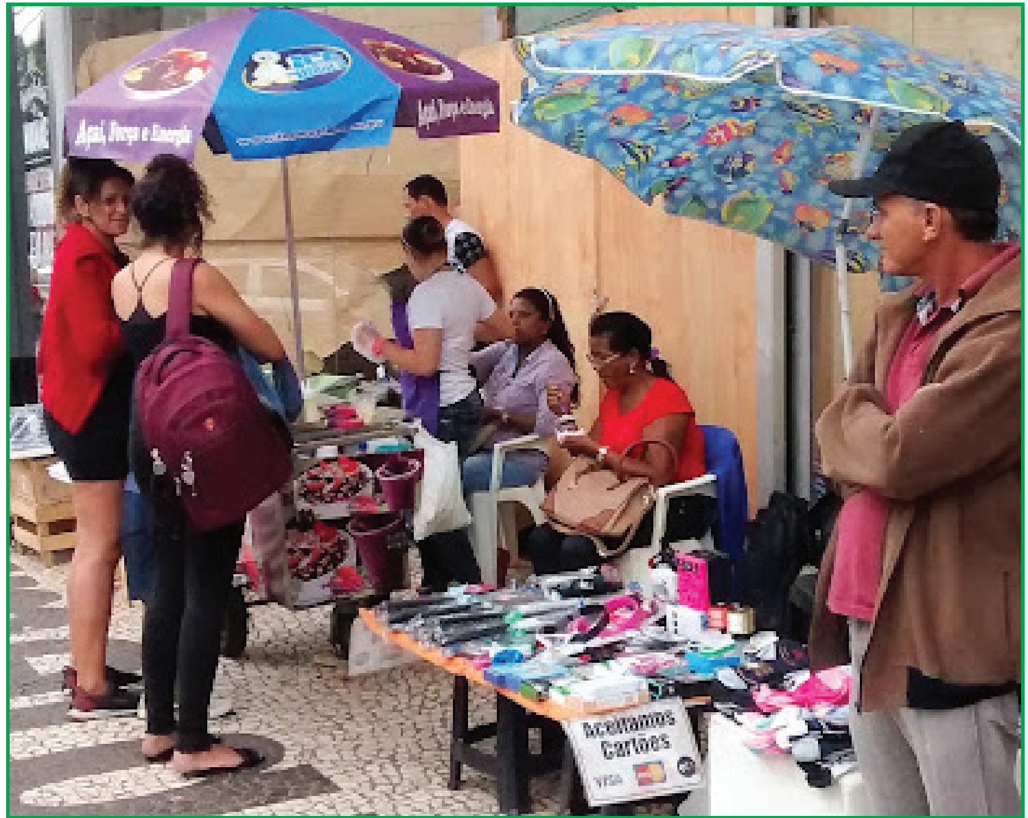
34,7 milhões de pessoas trabalham sem carteira assinada

A população subocupada por insuficiência de horas trabalhadas (7,36 milhões de pessoas) foi recorde da série histórica iniciada em 2012, com altas de 6,8% (mais 469 mil pessoas) ante fevereiro deste ano e de 27,2% (mais 1,6 milhão de pessoas) na comparação com maio de 2020.