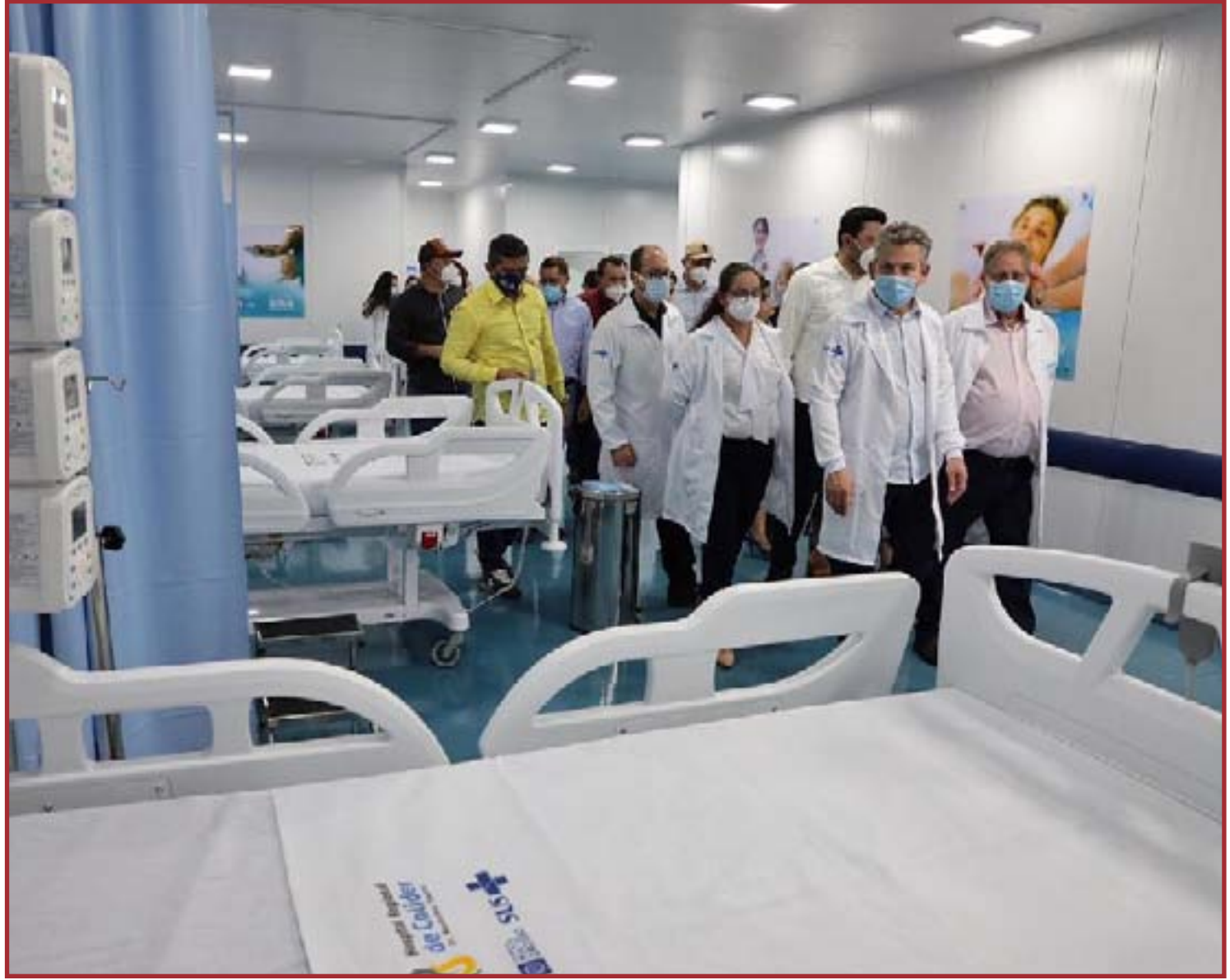
"Este é um Governo diferenciado, que faz as coisas acontecerem"

O deputado federal Juares Costa também elogiou as ações feitas pelo Governo do Estado e enfatizou a relação de parceria com o Poder Legislativo. "Colíder, como toda a região norte, merece essa atenção. O Norte, principalmente o extremo norte, não tinha essa atenção que o governador Mauro Mendes tem dado em infraestrutura, saúde, educação e demais áreas. Estamos juntos com a banca da federal, com a Assembleia Legislativa ajudando o Governo do Estado e os secretários a fazerem o estado se mover", concluiu.