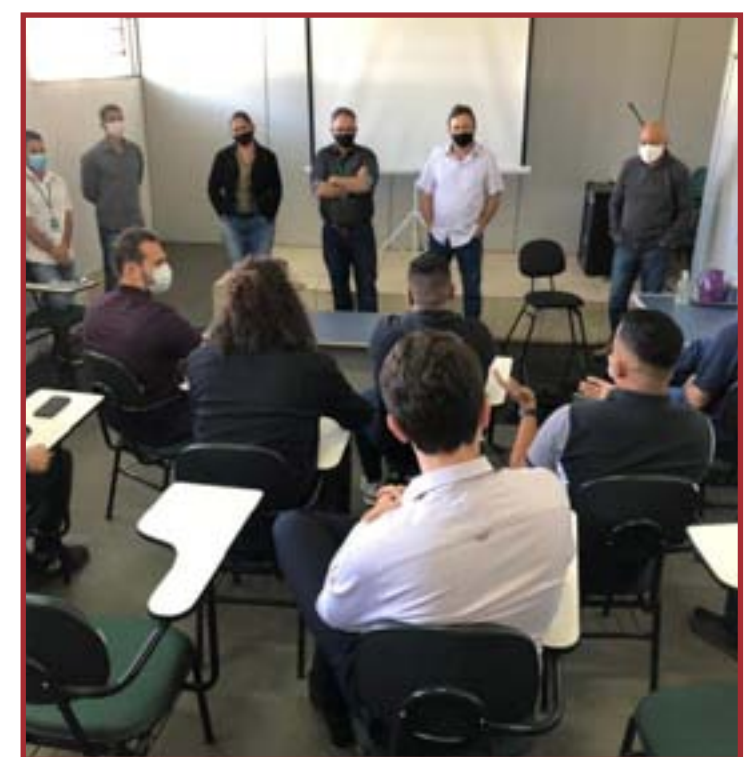
Setor também foi orientado sobre medidas de biossegurança

alguns dados essenciais, como o número de casos ativos hoje no Município e o avanço das imunizações contra a Covid-19.