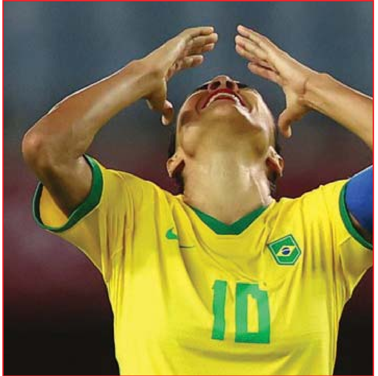
Marta lamenta eliminação do Brasil

A zagueira Gilles colocou o Canadá na frente, e Labbé pegou o chute de Rafaelle, também no canto esquerdo, classificando sua seleção à terceira semifinal olímpica seguida.