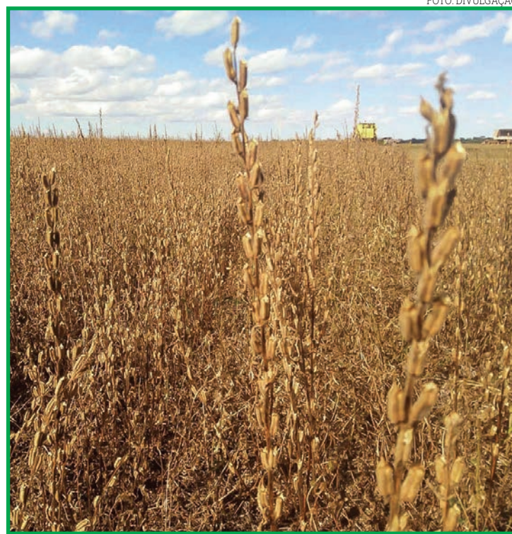
Canarana é o maior produtor de gergelim do país

O Brasil obteve a autorização para exportar gergelim para a Índia em janeiro do ano passado, sendo que os primeiros carregamentos começaram a chegar no segundo semestre, tendo finalizado o ano com cerca de US$ 17 milhões de exportação do produto, mostrando o alto potencial desse mercado para o Brasil. Em 2021, as exportações já somam até junho cerca de US$ 4 milhões, mas as vendas se concentram no segundo semestre, após a colheita da safinha. O gergelim é cultivado,