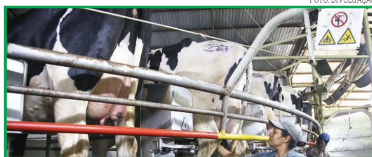
Meta é que produtor de leite possa ter acesso a linhas de crédito facilitadas

O próximo passo será o governo elaborar as ações que cada segmento deverá adotar para colocar o programa em ação. Uma das possibilidades levantadas durante a reunião foi a do Estado oferecer subsídios para que o produtor de leite possa ter acesso a linhas de crédito facilitadas que os ajudem a in-