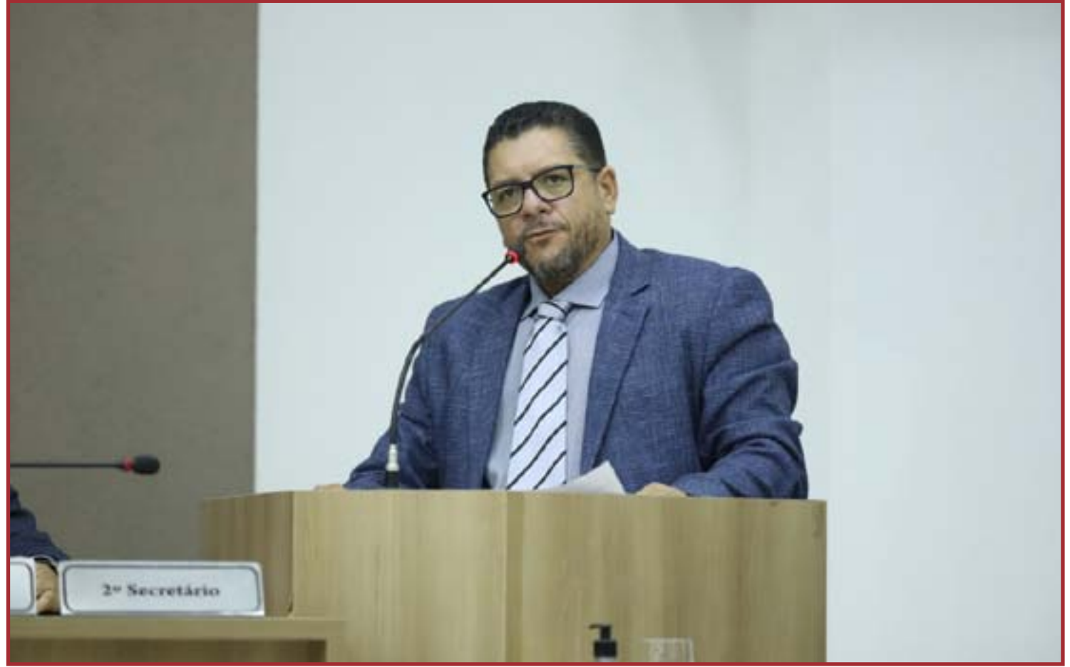
Operação é contra comércio ilegal de agrotóxicos

A Polícia Federal informou que o objetivo da Operação é o combate à entrada, o transporte e a comercialização de agrotóxicos impor-