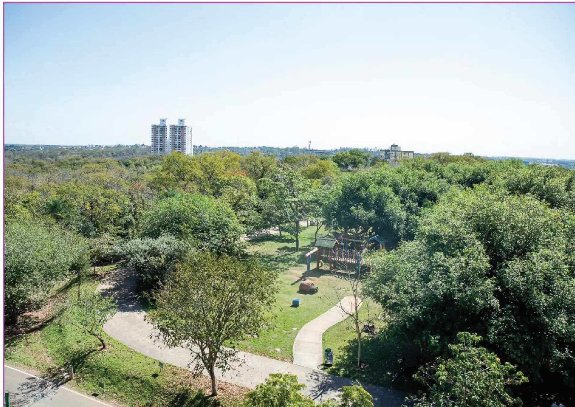
Mirante Parque Mãe Bonifácia: proibido alimentar animais silvestres

É importante ressaltar que os humanos podem transmitir a doença mesmo sem estar com sintomas. Nos macacos, o Herpes Simplex evolui para inflamação que pode afetar diversos órgãos, podendo causar lesão de pele, mucosas, pulmão, coração, fígado e no sistema nervoso central. Além disso, tem potencial de transmissão entre os animais da mesma espécie após a contaminação