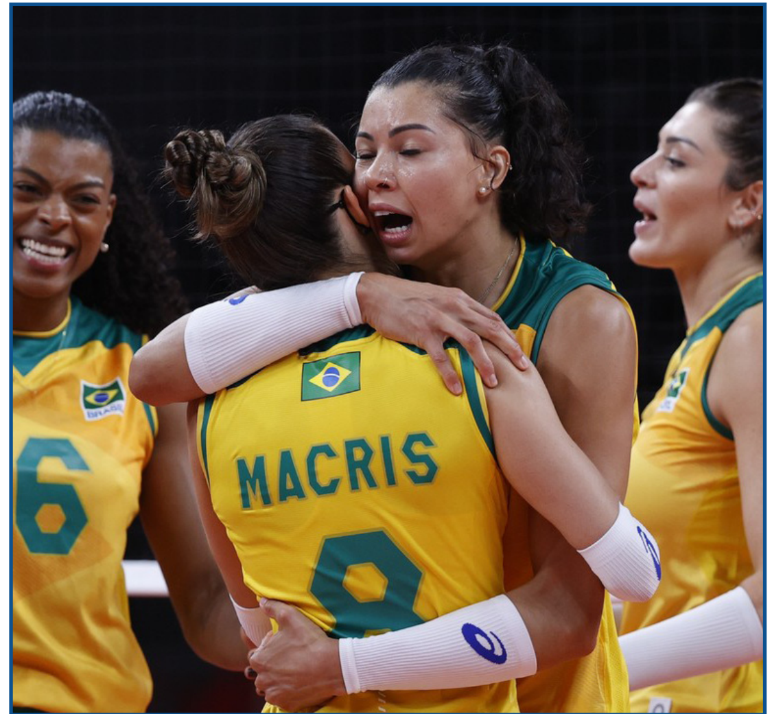
Jogadores comemoram classificação à final das Olimpíadas