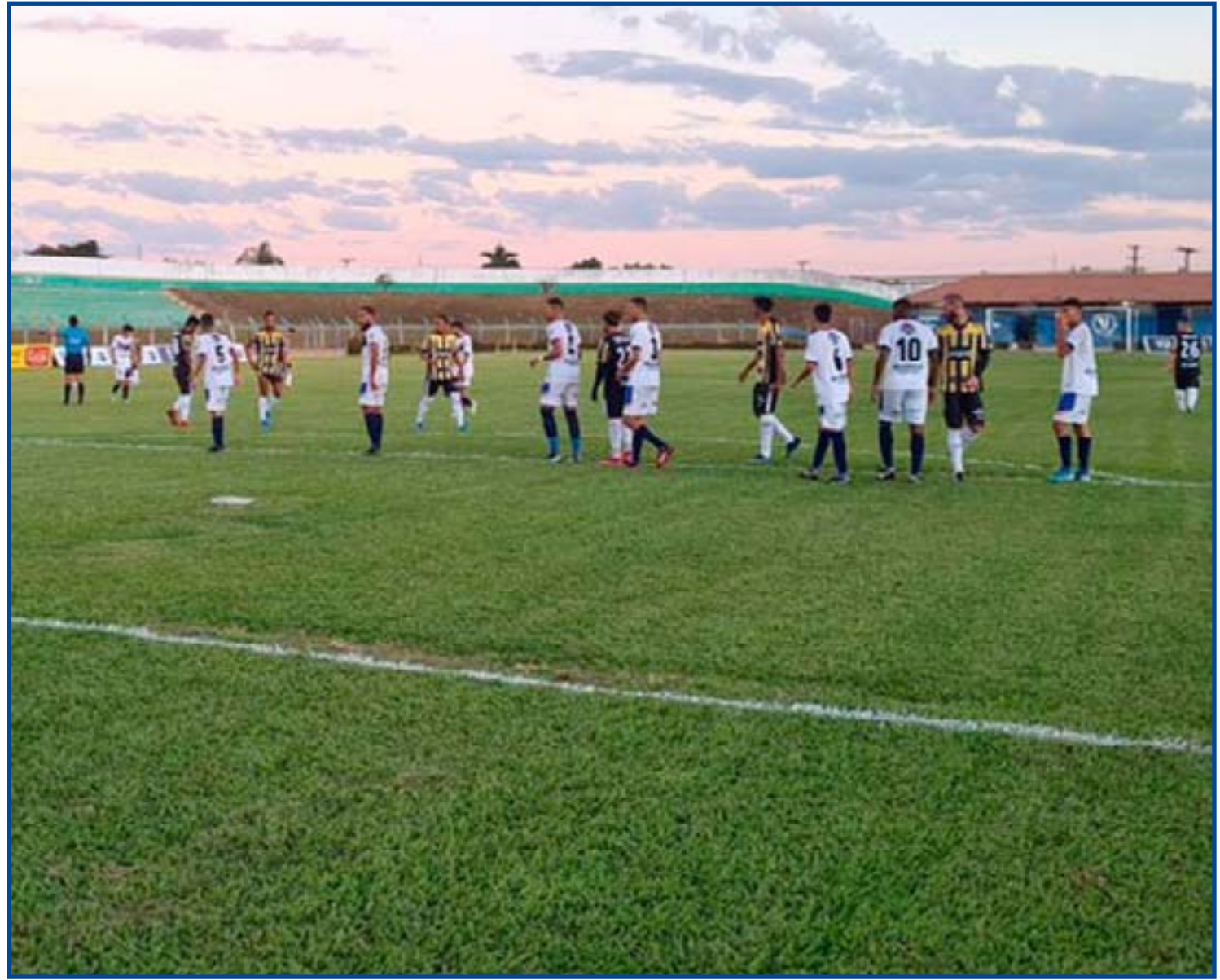
Finalistas entram em campo hoje, no Gigantão

E ele veio em grande estilo! Uma goleada histórica de 7 a 1 (placar sugestivo, não é?) sobre o Araguaia,