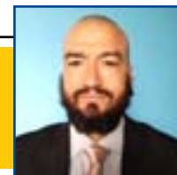
POR LEANDRO CARECA