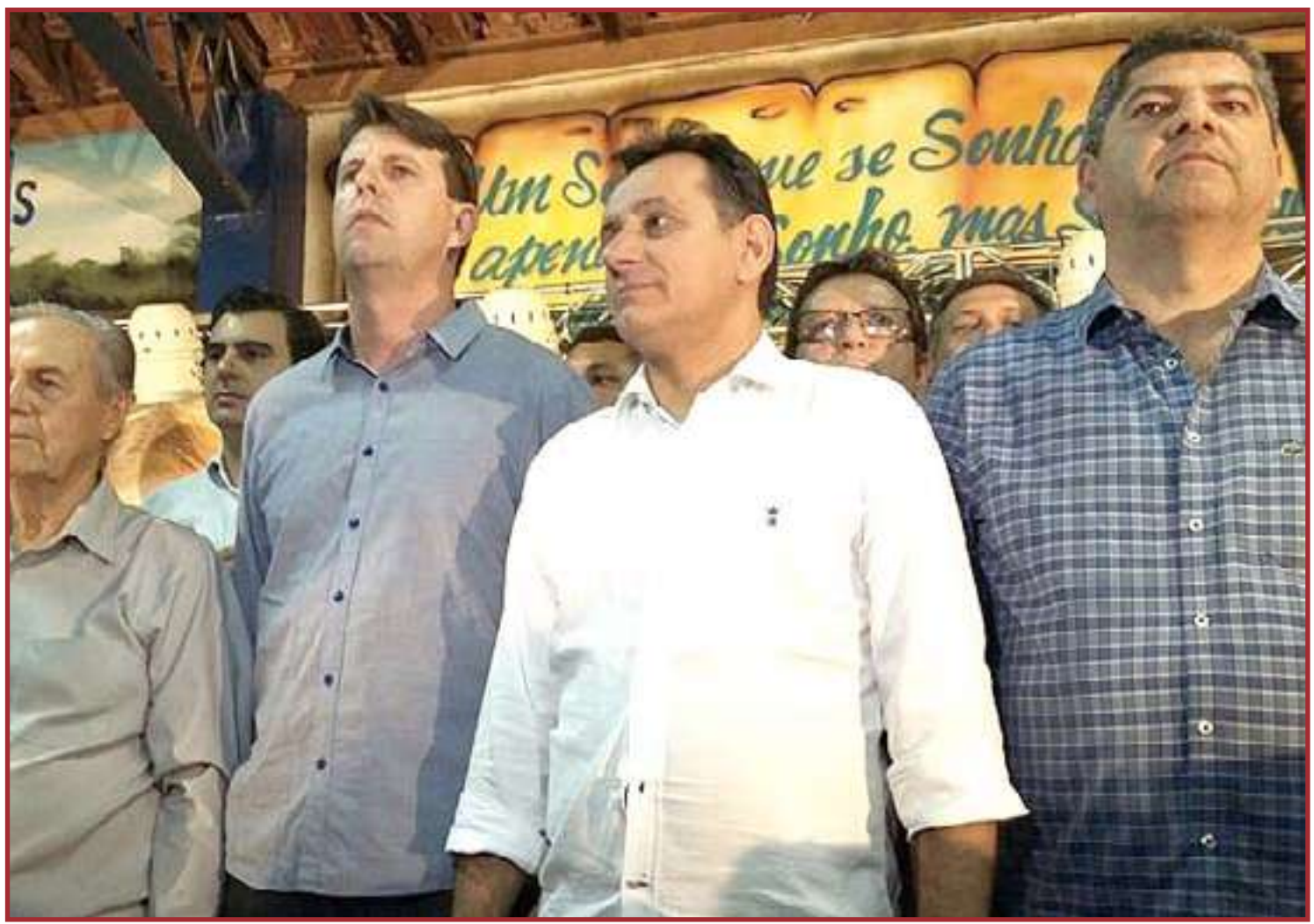
Lafin ou Leitão devem representar o PSDB na disputa

Segunda Avalone a intenção é dos tucanos serem