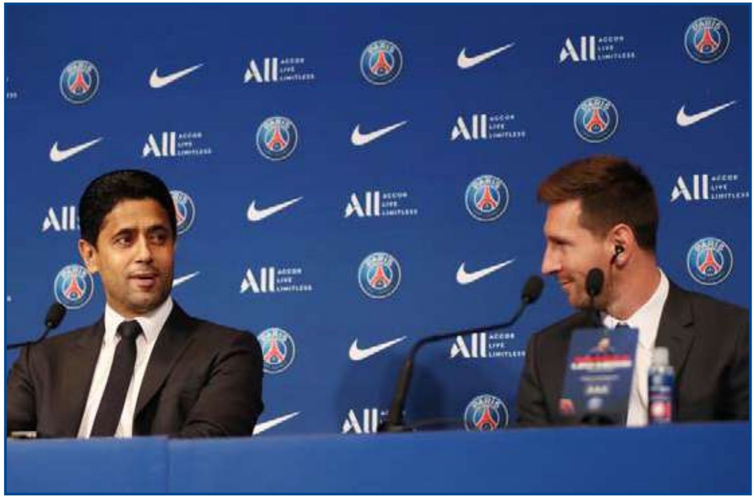
Messi ao lado do presidente do PSG, Nasser Al-Khelaifi

Nasser Al-Khelaifi também salientou o impacto positivo da chegada de Messi para o Campeonato Francês. "Eu acho que com certeza hoje os jogadores e