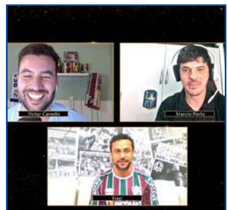
Fred elogiou clima no Flu e disse que jogadores querem dar resposta

isso, Zé Ivaldo deve formar dupla com Pedro Henrique contra a LDU.