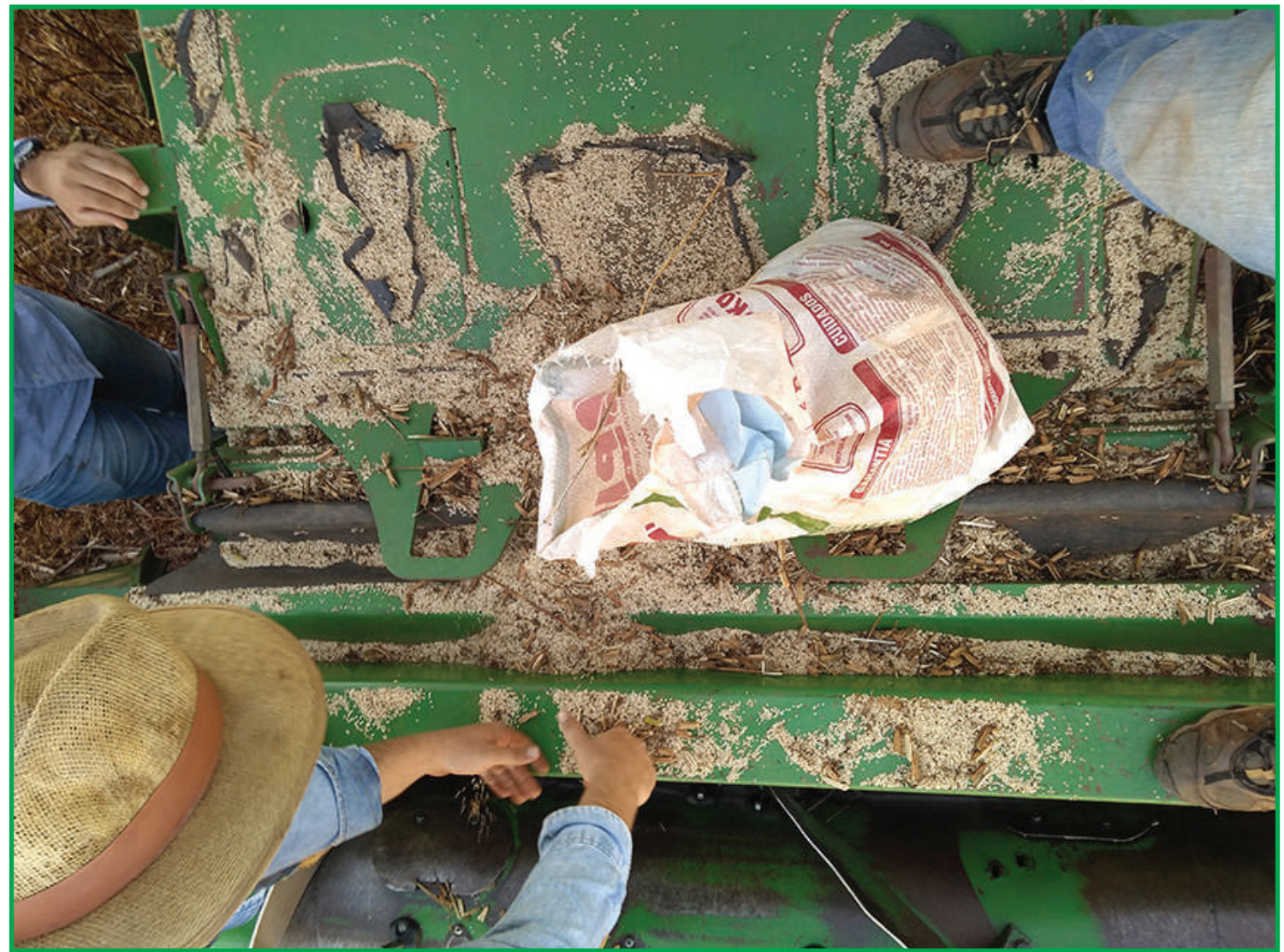
Cultivo de gergelim cresce como alternativa após janela de semeadura do milho safrinha

O gergelim até então vinha sendo cultivado em pequenas áreas, com pouca mecanização. Não existem ainda, no mercado, plataformas específicas para sua colheita, necessárias no caso da produção em áreas cada vez maiores. O uso de plataformas voltadas à colheita da soja, por exemplo, traz algumas dificuldades, pois as diferenças entre tamanho, peso, formato e umidade entre os grãos causam perdas que podem chegar a 50%.