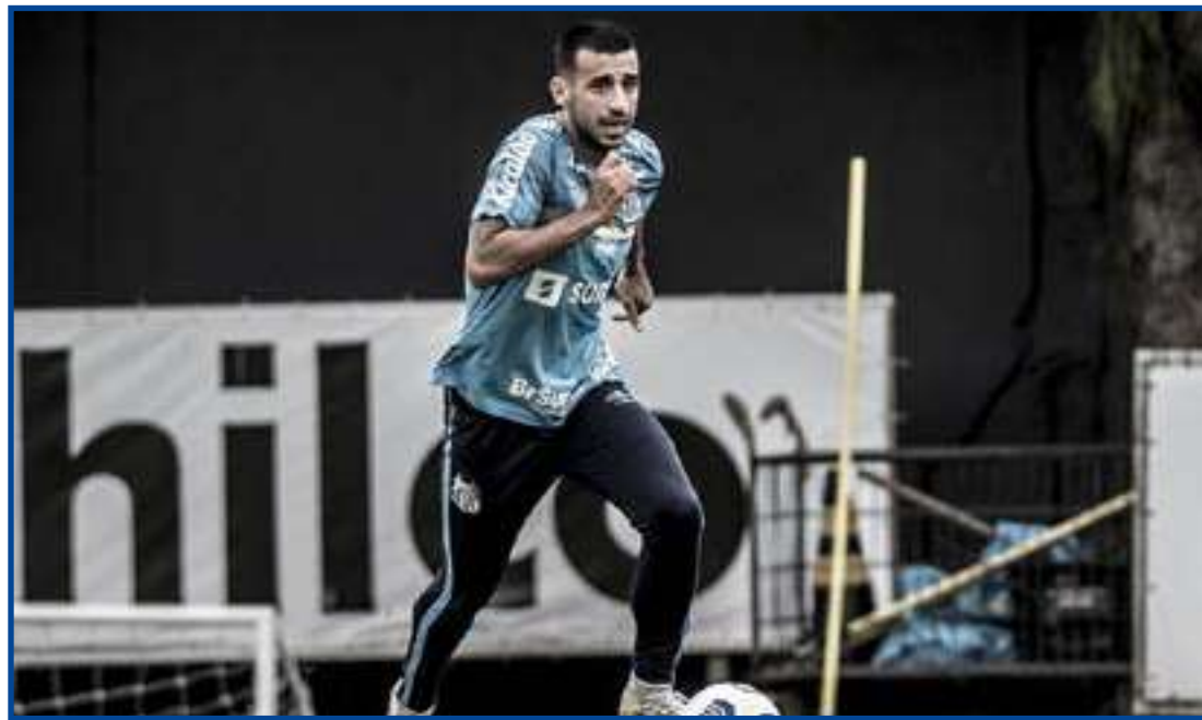
Volante destacou que equipe precisa finalizar mais

"Antes o problema estava sendo fazer o gol, pois estávamos criando 20 finalizações por jogo. Mas nas últimas partidas isso deu uma parada. Contra o Corinthians não conseguimos criar, lembro apenas de uma grande defesa do Cássio. Então não foi bom, e sabemos disso. Temos de melhorar, precisamos ser mais agressivos. Dentro de casa temos que finalizar 20, 25 vezes, e fazer os gols. Treinamos muito aqui a parte ofensiva e espero que quinta