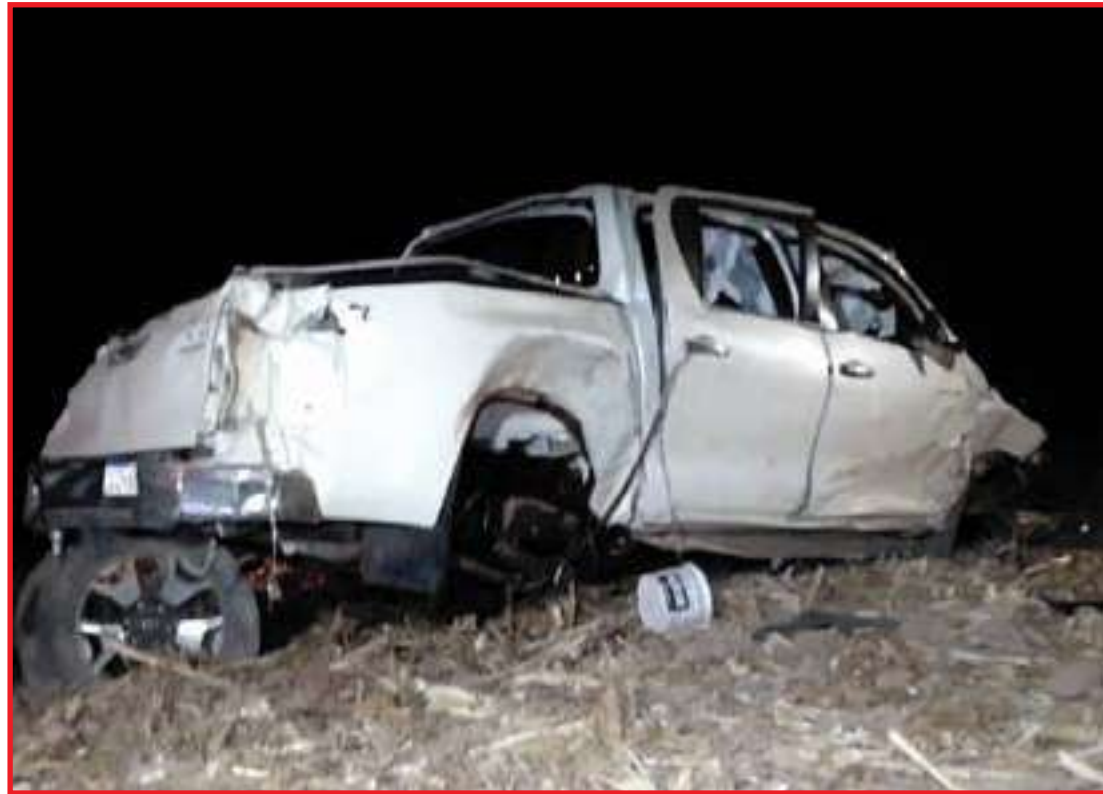
Hilux ficou destruída com o capotamento

A Perícia Oficial e Identificação Técnica (Politec) e a Polícia Civil estiveram no local. Os corpos foram enca-