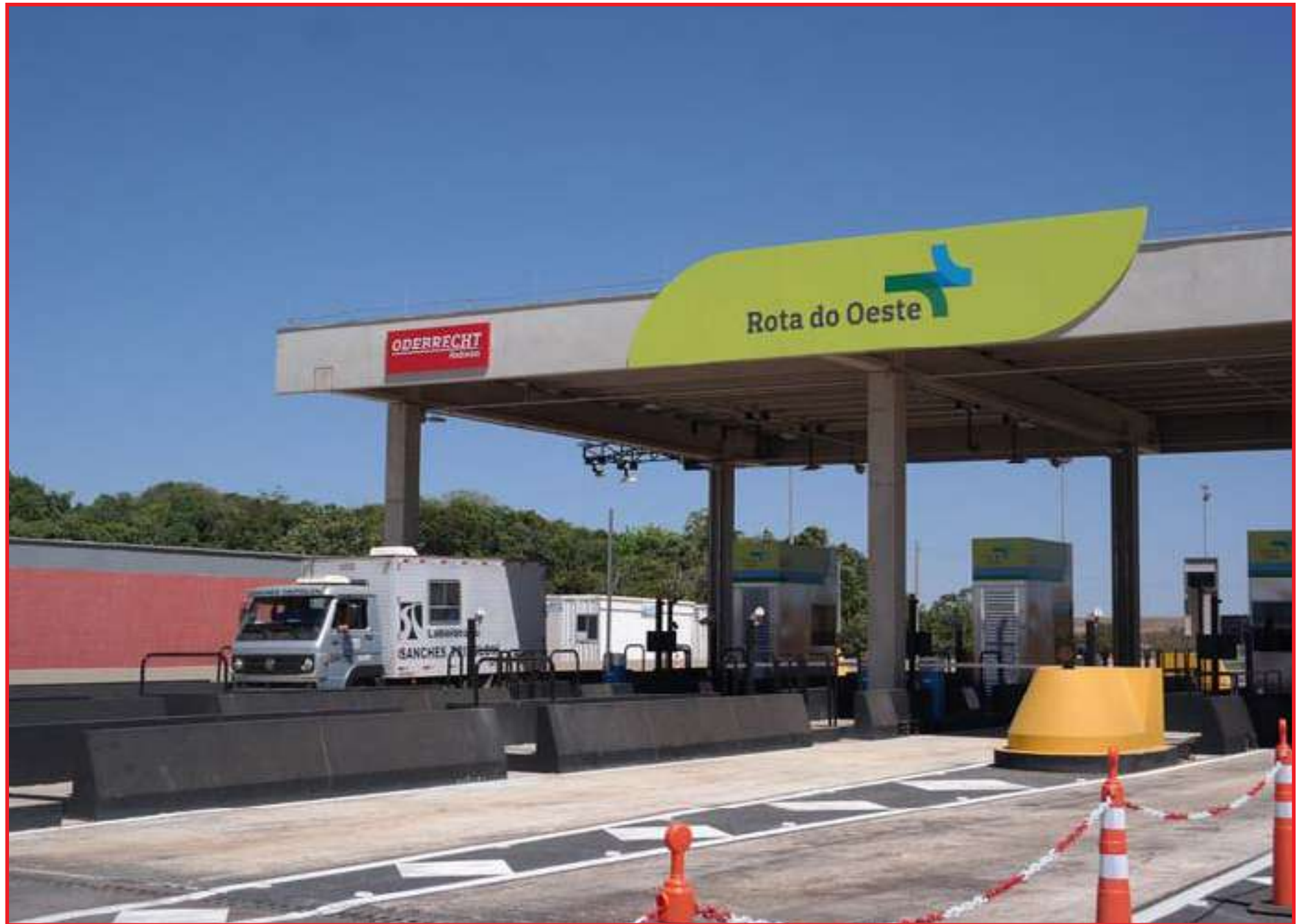
Alterações são aplicadas no aniversário do início da cobrança de pedágio

Essas alterações tarifárias são aplicadas no aniversário do início da cobrança