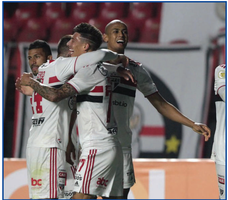
São Paulo venceu o Grêmio no sufoco e respira no Brasileiro