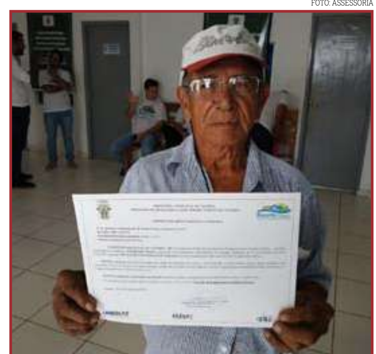
Resultado do seletivo está disponível a partir de hoje