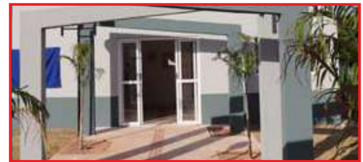
Militares fizeram uma maca improvisada para retirar o corpo até um lugar seguro