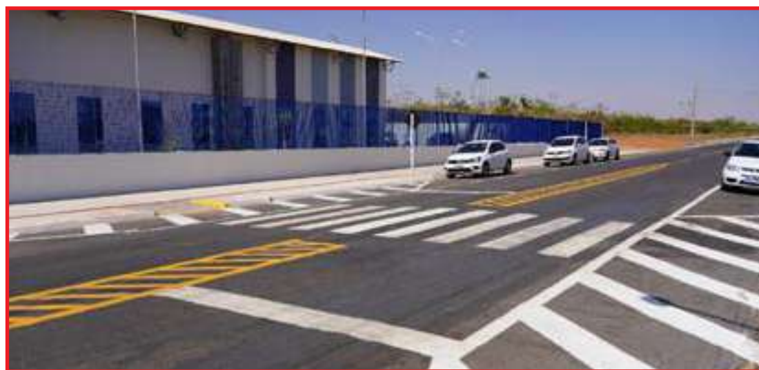
Entre as ações está a implantação de faixa de pedestre na MT-449

Outro ponto em que a equipe trabalha é na MT-449, na entrada do bairro Tessele Junior. No local, a secretaria está implantando faixa de pedestres, nos dois sentidos da via, para facilitar a travessia dos estudantes que saem daquele bairro em direção à nova escola. A ação deve ser