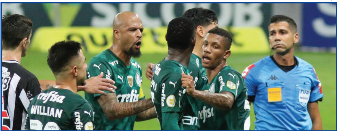
Palmeiras fez jogo nervoso diante do Atlético