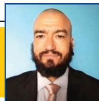
POR LEANDRO CARECA