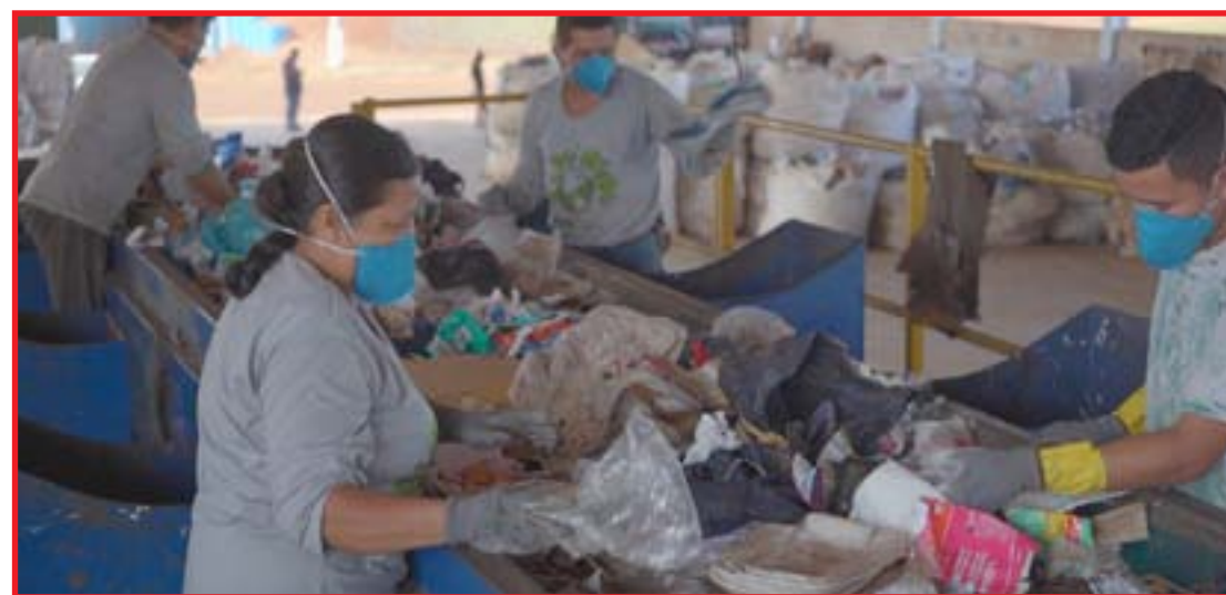
Recicláveis se transformam em renda para 22 cooperados que trabalham no Ecoponto

O vidro, em exceção, é o único material que não é vendido, pois o material fica na cidade. Depois de chegar