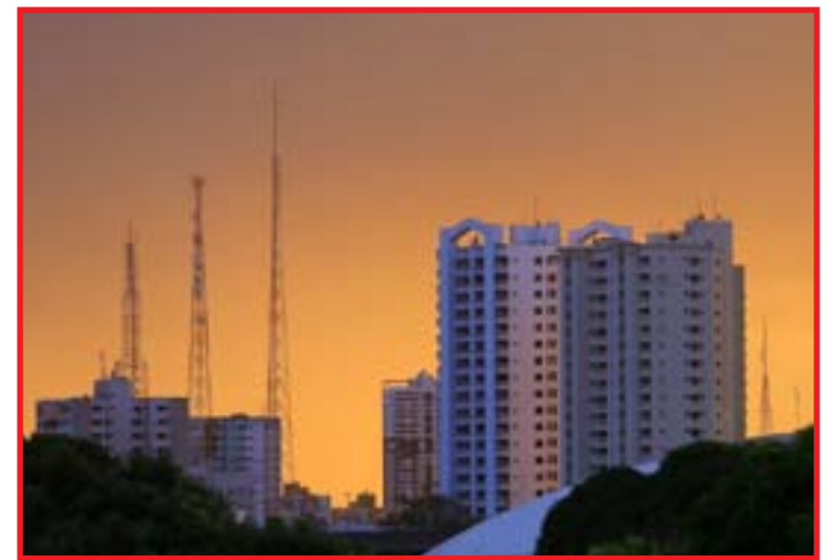
Ainda não há possibilidade de chuva nessa semana devido à estiagem