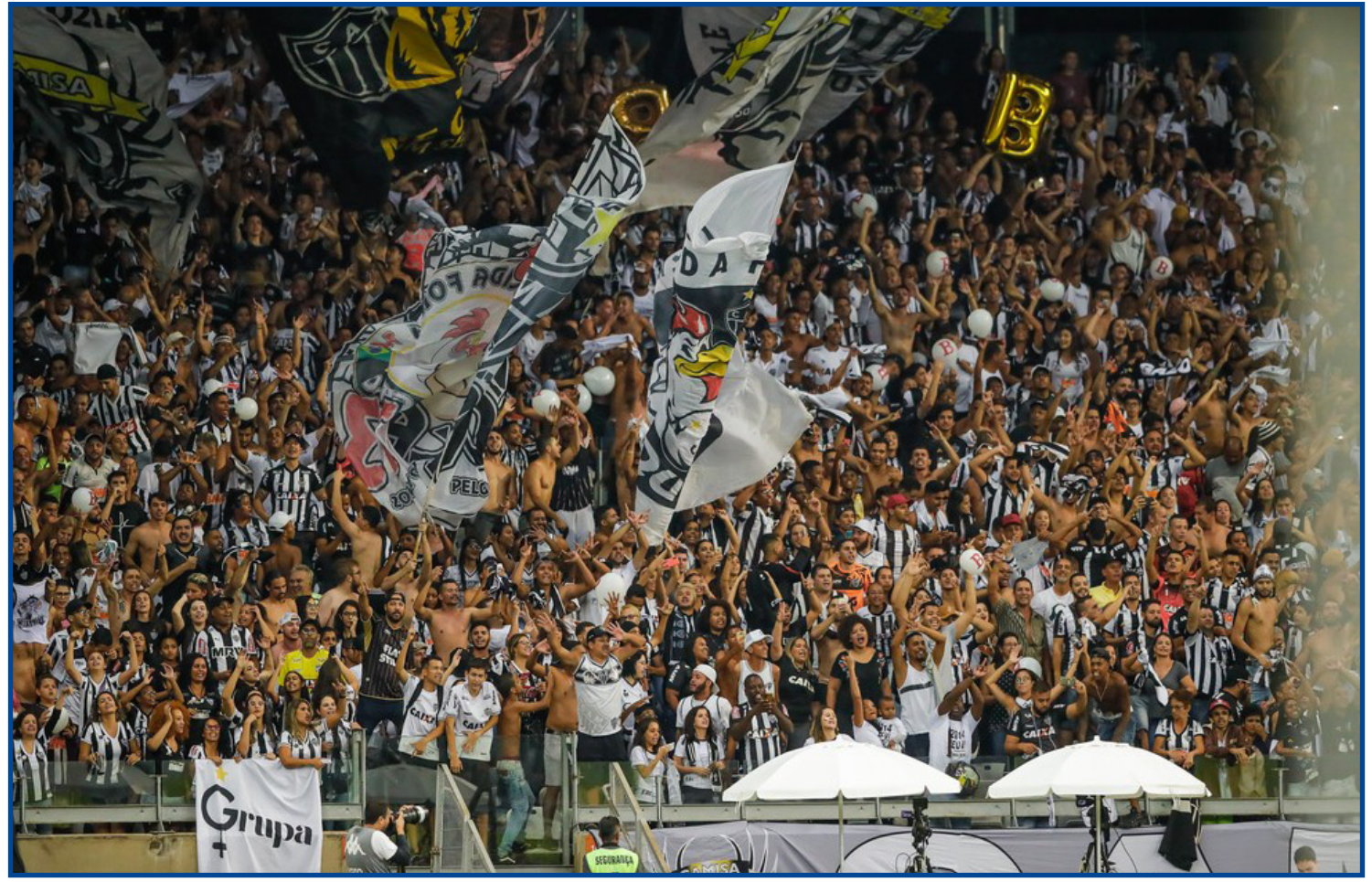
Público volta ao estádio após 17 meses

Depois de 17 meses, o Gigante da Pampulha receberá público novamente. No dia 7 de março de 2020, cerca de 50 mil torcedores vibraram no Mineirão com a vitória do Atlético sobre o Cruzeiro, por 2 a 1, pelo Campeonato Mineiro. Foi a última vez que os torcedores atleticanos pisaram na arquibancada no estádio da capital, já que, quatro dias depois, o Cruzeiro perdeu para o CRB, pela Copa do Brasil, diante de 13 mil torcedores presen-