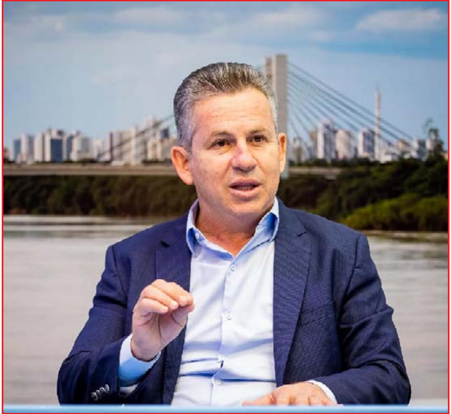
Mauro Mendes defende 'com unhas e dentes' construção da Ferrogrão

A ferrogrão é um projeto discutido há pouco mais