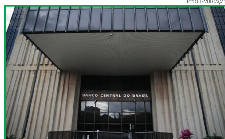
Instrumento pode entrar em vigor no fim de agosto

Além dos depósitos voluntários, o BC tem três ferramentas para fazer política monetária e regular a quantidade de dinheiro em circulação. A mais usada são as operações compromissadas, venda e compra de títulos públicos na carteira do Banco Central por prazos curtos, e que sustentam a taxa Selic fixada pelo Comitê de Política Monetária (Copom).