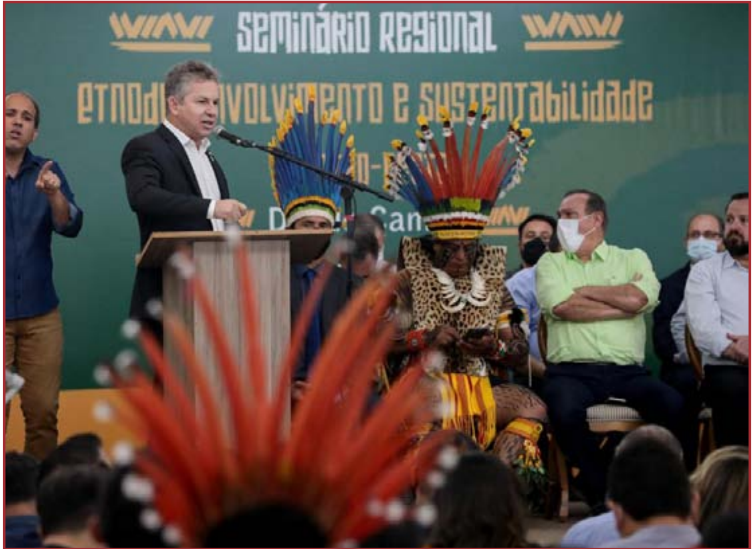
Governo será avalista dos povos indígenas

Os proprietários também precisaram recolher junto à prefeitura o ITBI (Imposto Sobre Transmissão de Bens Imóveis) que é de 2%. Esse percentual é cobrado sobre o valor total da compra do imóvel.