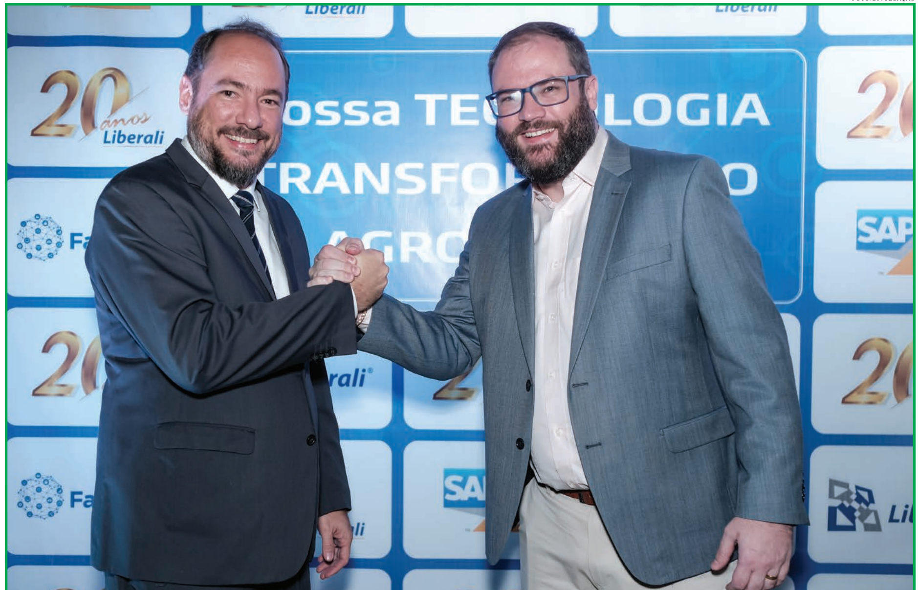
Empresa tem sede em Cuiabá, ponto central do celeiro do agronegócio brasileiro

As soluções são 100% desenvolvidas pela equipe