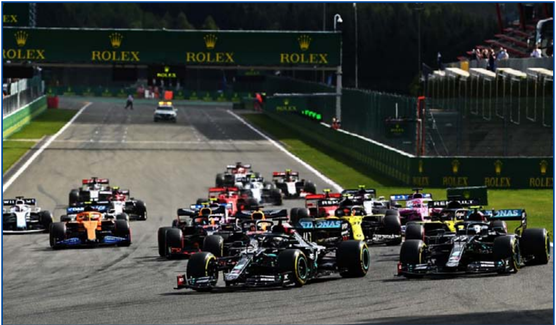
Largada do GP da Bélgica, em Spa-Francorchamps

A medida também consta no site oficial do GP da Bélgica, que alerta que a presença de espectador