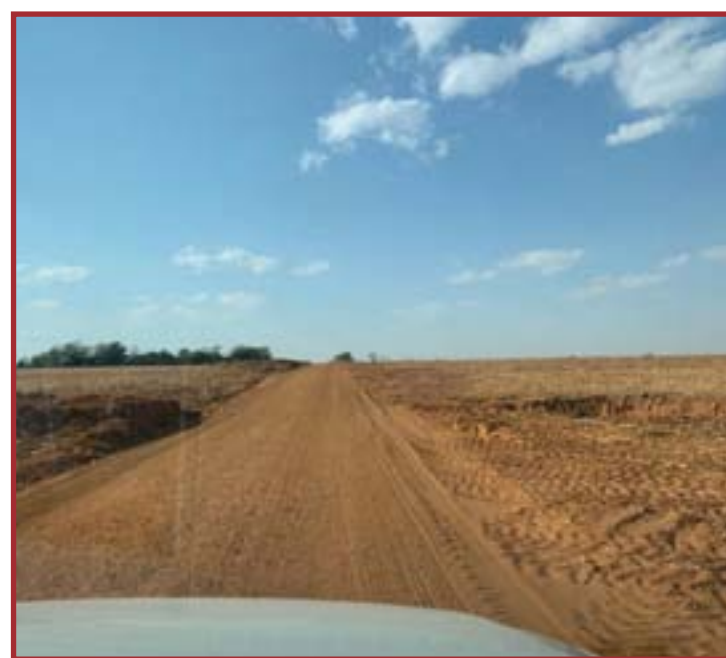
Visita foi realizada no início da semana

Pelo programa, o Estado irá repassar 50% dos recursos necessários para a execução dessas obras e em contrapartida as Prefeituras devem arcar com os 50% do total da obra, podendo essa contrapartida ser financeira ou não financeira, como na prestação de serviços de execução. O programa terá duração de 18 meses e os recursos serão alocados pela Secretaria de Estado de Infraestrutura e Logística (Sinfra).