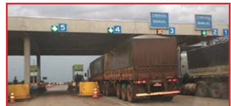
ANTT altera tarifas em duas praças da BR-163