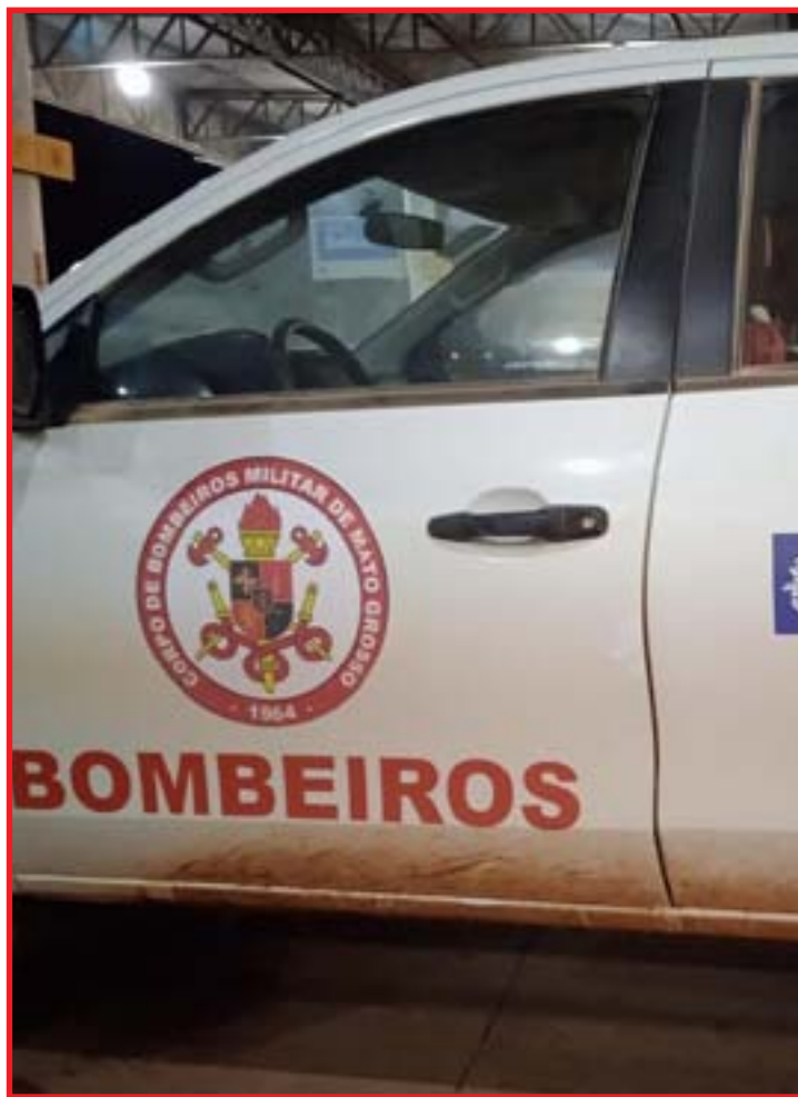
Corregedoria apura denúncia; viatura foi atingida por dois tiros

O material foi apreendido, mas o suspeito não foi localizado.