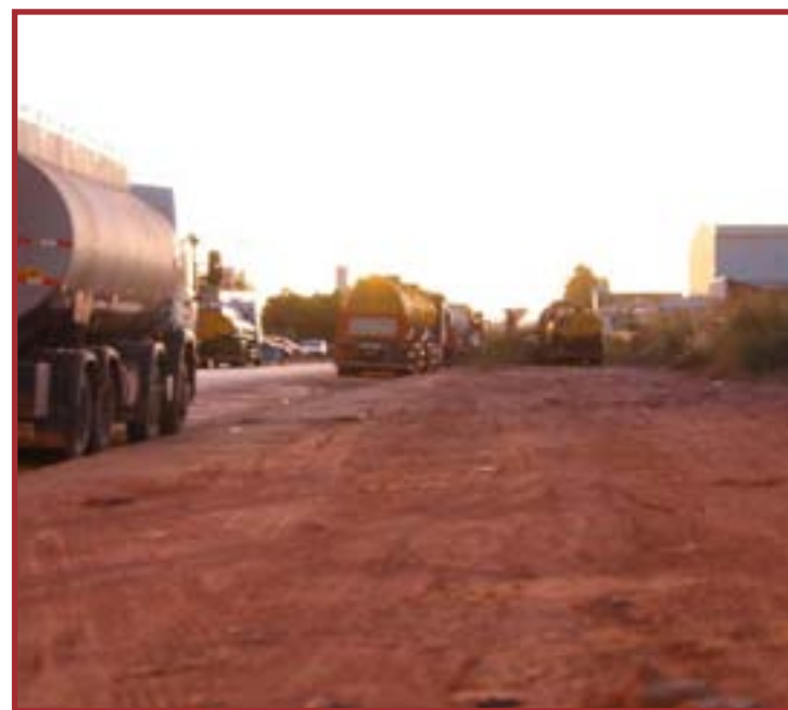
Os serviços de infraestrutura serão realizados em 23 ruas e seis avenidas