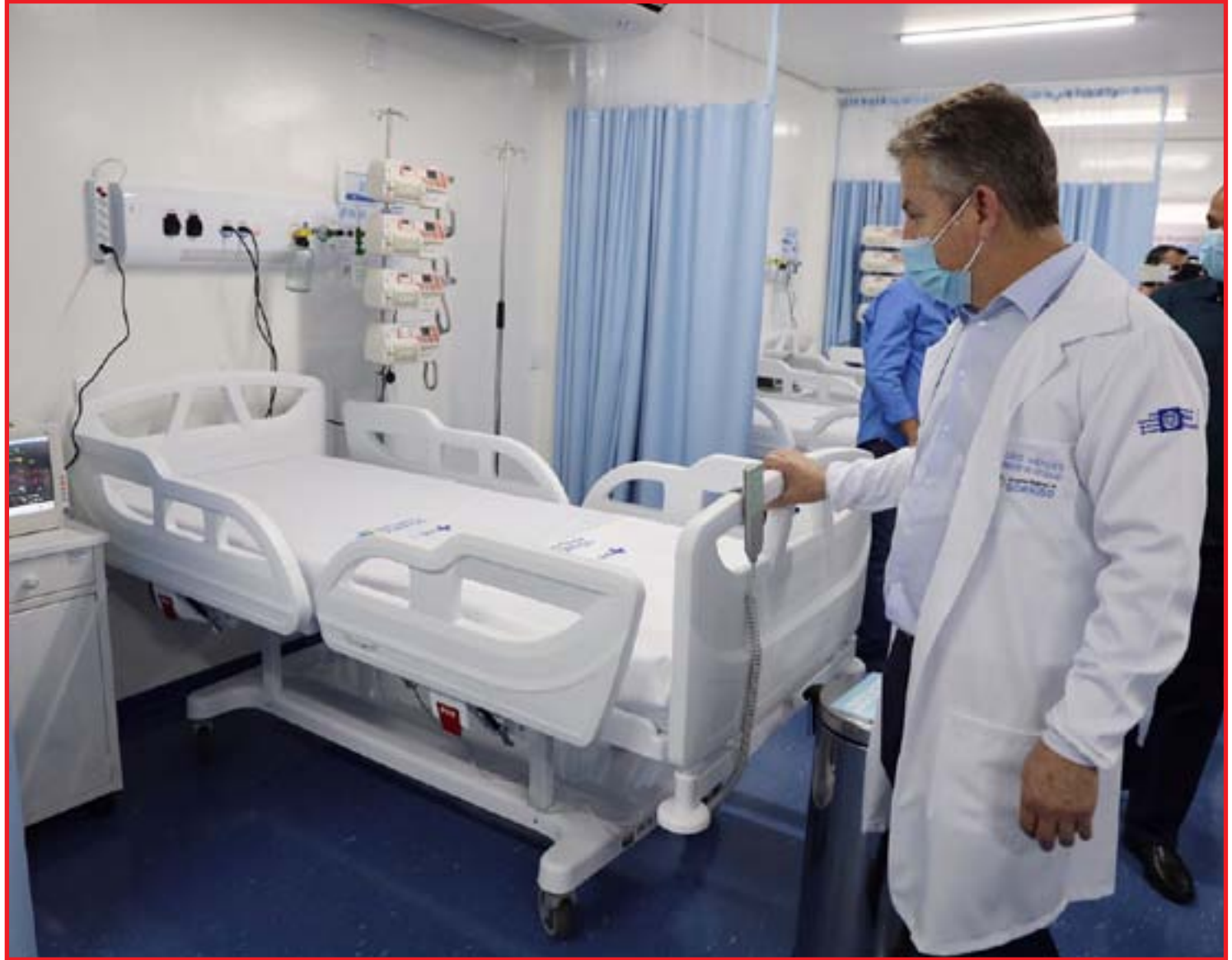
Inauguração da nova ala no Hospital Regional de Sorriso

Durante a solenidade de inauguração da área ampliada do Hospital Regional de Sorriso, prefeitos e gestores da região Norte de Mato Grosso manifestaram satis-