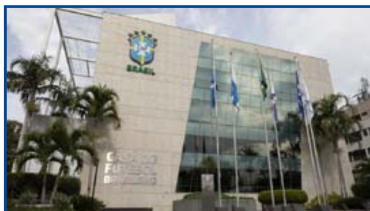
Sede da CBF, no Rio de Janeiro

As novas datas serão anunciadas posteriormente, mas a CBF trabalha com os seguintes dias para as próximas partidas da Copa do Brasil: volta das quartas de final (15 de setembro), ida das semifinais (20 de outubro) e volta das semifinais (27 de outubro). Com a alteração, as duas partidas da final da