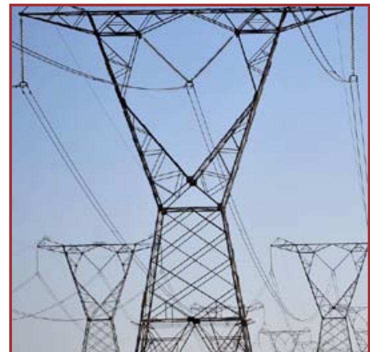
Medida permite que setor industrial baixe consumo mediante compensação