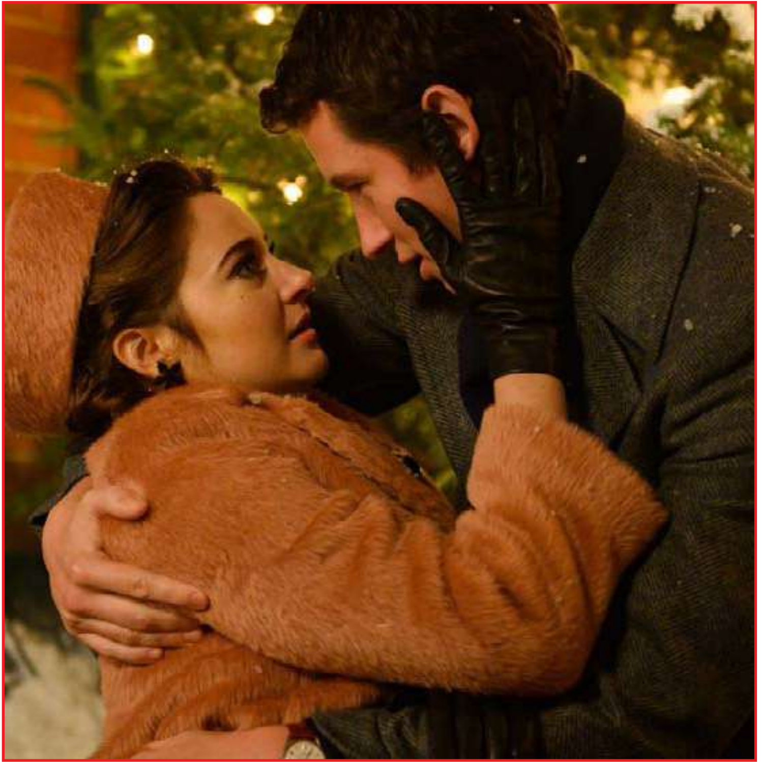
Filme é água com açúcar, mas bem bonitinho

“Me fez pensar como minha geração pode ter sido a última a escrever cartas de amor e como a nova tecnologia pode ter influenciado uma fraqueza do romance. Eu não posso acreditar que um status do Facebook ou uma mensagem de pegação tenham o mesmo impacto, ou a latente alegria, de uma carta escrita à mão, fechada com um laço e escondida em alguma caixa por aí!”, contou Jojo Moyes. É importante ressaltar que o filme A Última Carta de Amor apresenta algumas diferenças em relação ao livro original, inclusive a reunião final da história. Existe também uma cena deletada que explica um dos maiores mistérios da produção... Mesmo assim, foi o suficiente para conquistar o público apaixonado, não é mesmo?