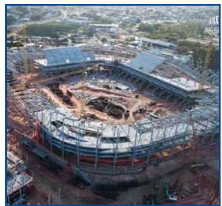
Arena MRV completa 500 dias de construção