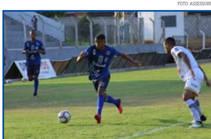
Nova Mutum venceu a Aparecidense e terminou primeira fase em 2º

O Nova Mutum enfrenta o Uberlândia, que foi o 3º do Grupo A6, enquanto o União Rondonópolis encara o Boa Esporte, vice-líder da mesma chave. O Azulão da Massa faz o jogo de volta no Estádio Valdir Doilho Wons, enquanto o Colorado faz o jogo de ida no Lutherio Lopes.