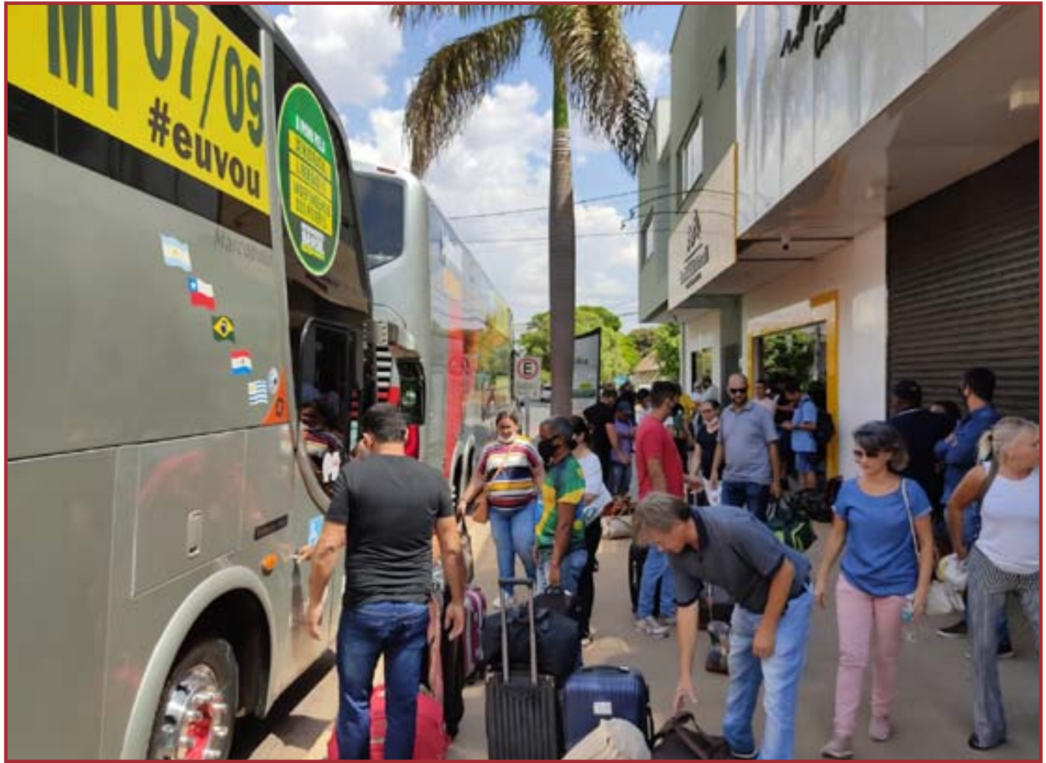
Dois ônibus de sinopenses já estão em Brasília para o ato

E esse pouco tempo que nós vamos ficar, ainda é muito pouco pelo esforço que ele já fez por nós. Esse ser humano [Bolsonaro] é uma benção. Porque se for