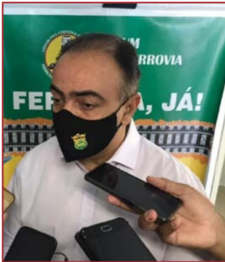
Vuolo afirma que ferrovia estadual "transcende" rivalidade política entre Mauro e Emanuel

Vuolo ainda acredita que o município não deve encontrar dificuldades para buscar a parceria do governo do estado em projetos envolvendo a construção dos trilhos. "Mais importante que transportar cargas é transportar a condição de que as pessoas sejam as maiores beneficiadas e isso a prefeitura está envolvida neste processo. Tenho certeza que vamos encontrar todos os canais abertos junto ao governo para traçar políticas de incentivo fiscal, políticas de incremento, que garantirão a essa região a inserção em um novo ciclo de desenvolvimento econômico". De acordo com o secretário, a prefeitura já estuda ações para que o município esteja preparado, assim como a população esteja qualificada para receber e se beneficiar com a implantação do modal.