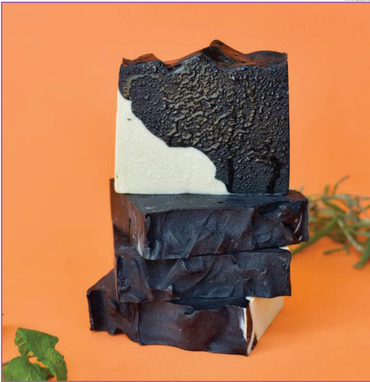
Mauro Mendes se reuniu E-commerce ampliou acesso a novos mercados consumidores com deputados e prefeitos

Assim, na busca por atenuar os danos ao meio ambiente, a marca cuiabana ajuda a revolucionar a forma com a qual cada um se relaciona consigo mesmo, com a sua casa, com as compras do mercado, da farmácia e com tudo aquilo que permeia o consumo. "Tudo isso e muito mais sem deixar o afeto de lado", pondera a empreendedora.