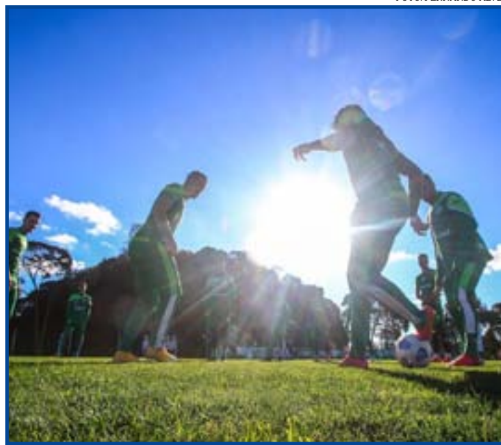
Jogadores em treino do Juventude

"A gente projetou no início do Campeonato um número mínimo, um médio e um número máximo. Hoje, estamos dentro desse médio e acreditamos ser satisfatório. Mas, nós temos mais um jogo duro e importante contra o Corinthians, fora, e temos a