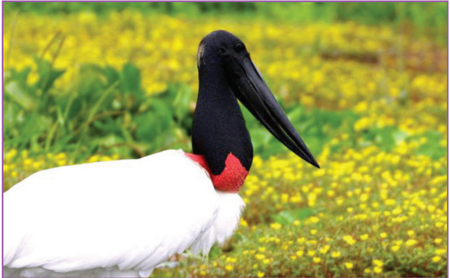
Tuiuiú é a ave símbolo do Pantanal

suplementação alimentar e dessedentação, técnicos do Ibama e Sema irão avaliar a necessidade de acordo com os critérios: perda intensa e significativa de habitat e refúgios naturais; perda de fontes naturais de alimento em todos os extratos da vegetação; perda, deterioração ou contaminação de fontes de água; e análise do escore corporal dos animais.