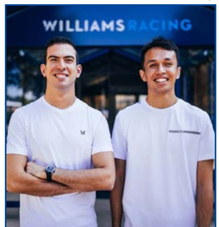
Nicholas Latifi e Alexander Albon serão os pilotos da Williams em 2022