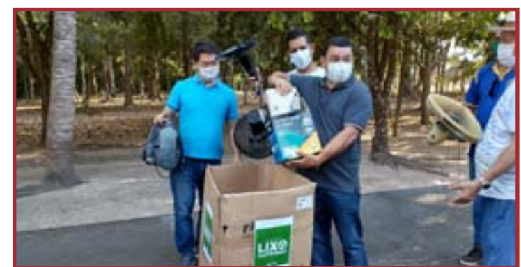
A arrecadação segue até o dia 30 de setembro