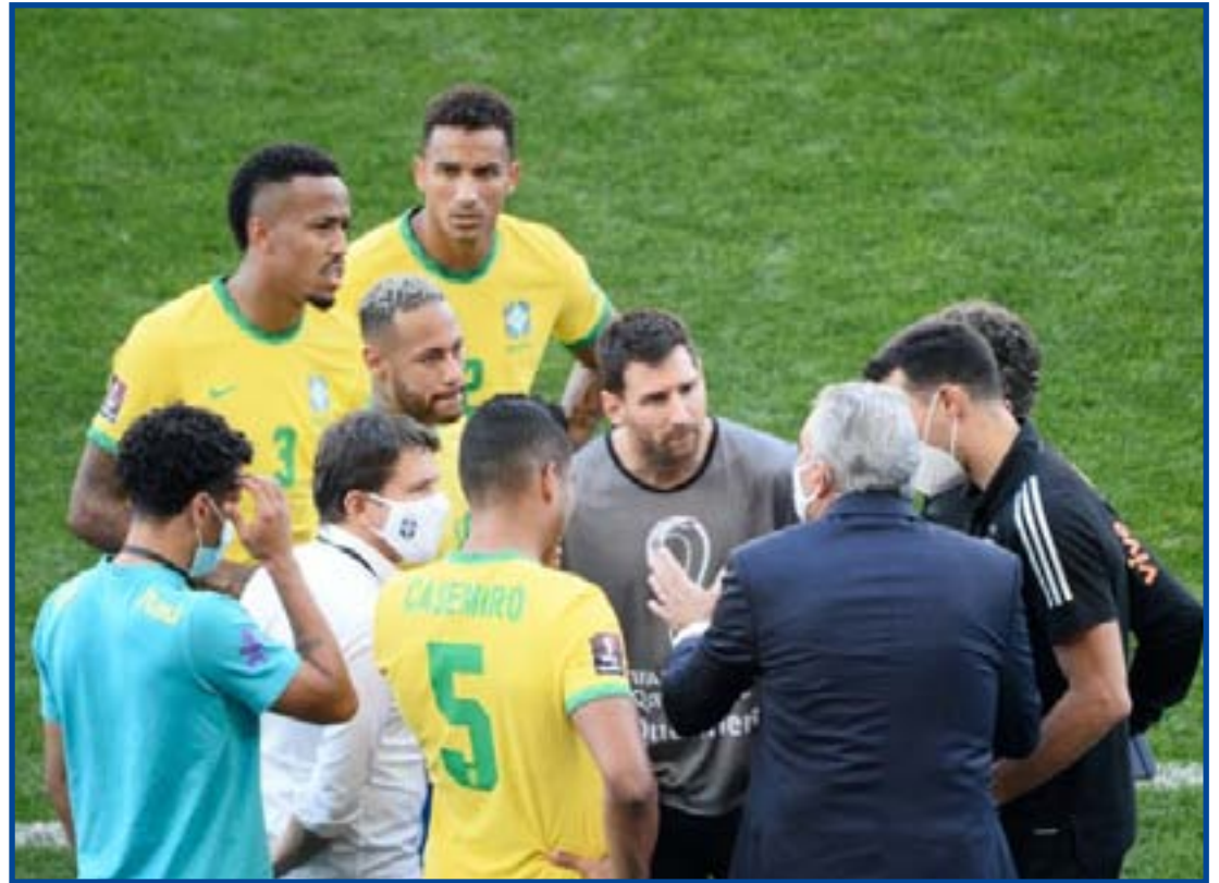
Tite vem enfrentando adversidades durante as Eliminatórias

Lembrando que a CBF decidiu liberar o zagueiro