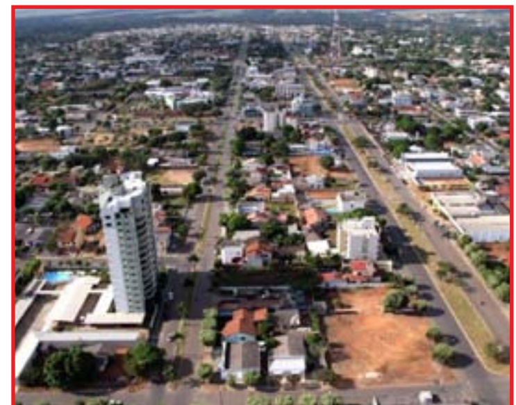
Vacinação foi suspensa pela falta de imunizantes para primeira dose