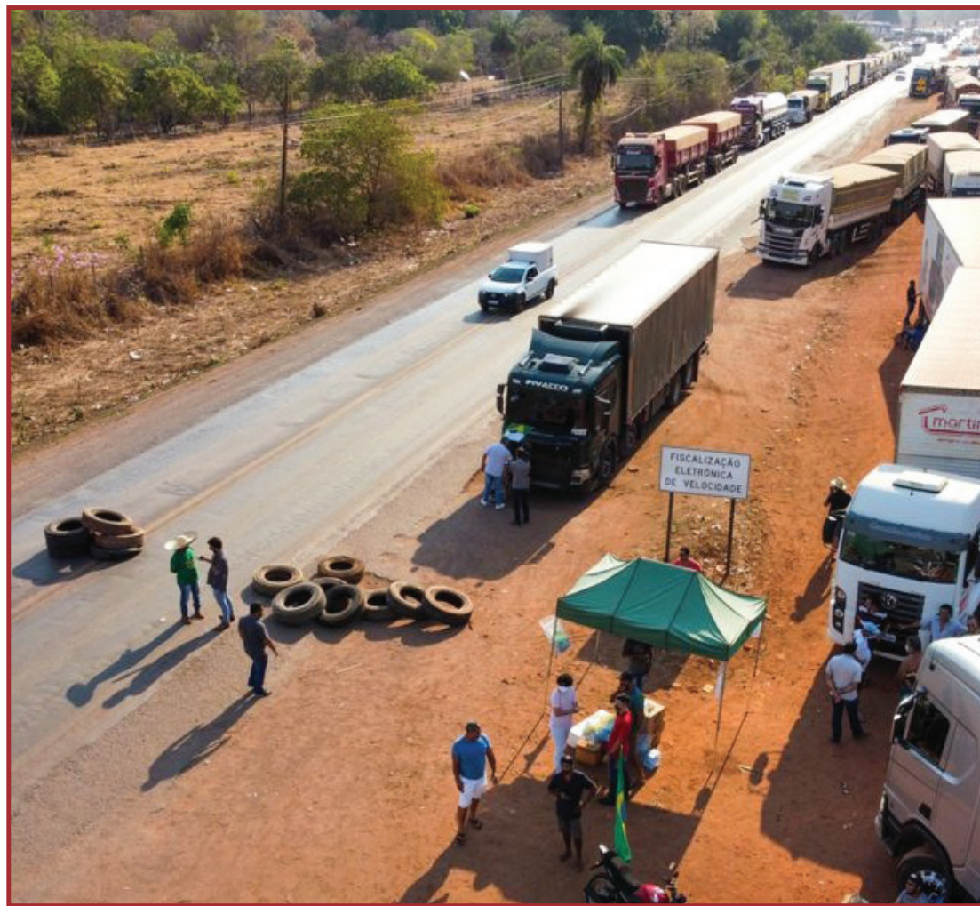
Caminhoneiros bloqueiam trecho da 070