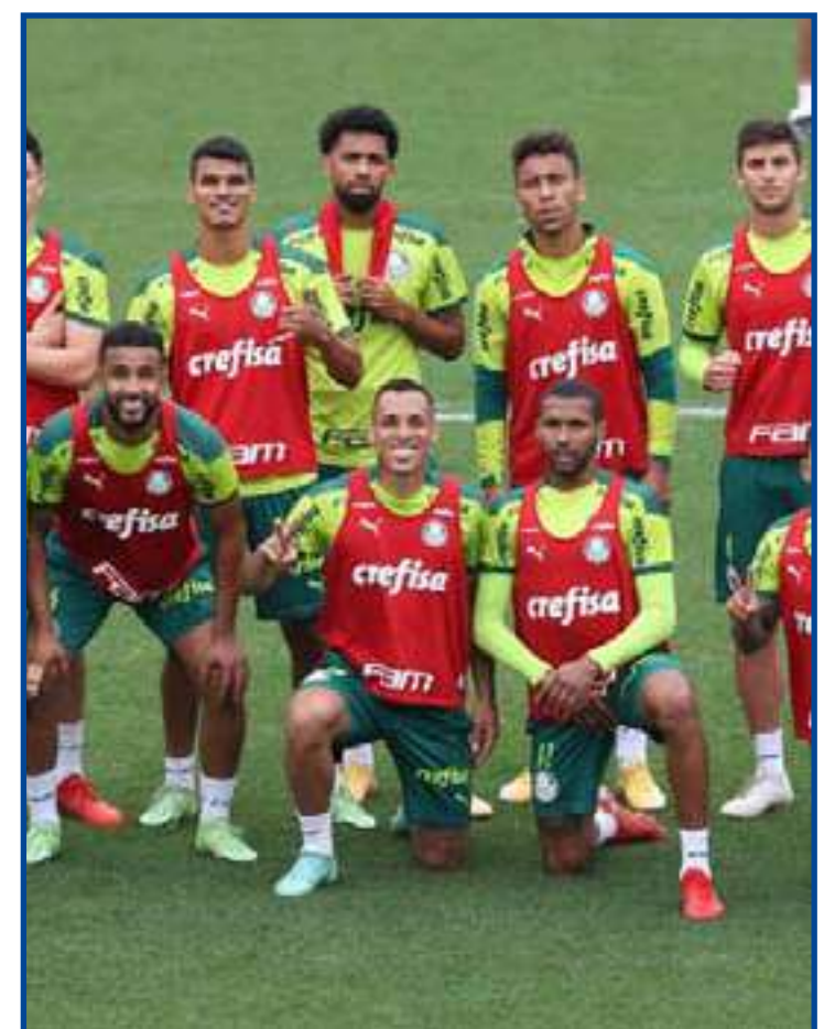
Elenco do Palmeiras na Academia de Futebol

Este recorte, no entanto, leva em conta os dois empates na final da Copa do Brasil de 1997, conquistada pelo Grêmio.