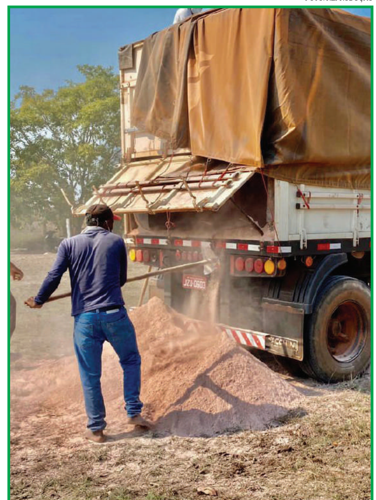
Entrega de calcário para agricultores de Porto Alegre do Norte