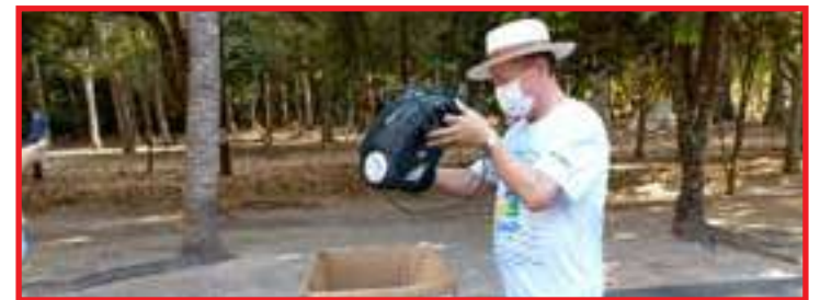
Hoje é o Dia D da Campanha Leve