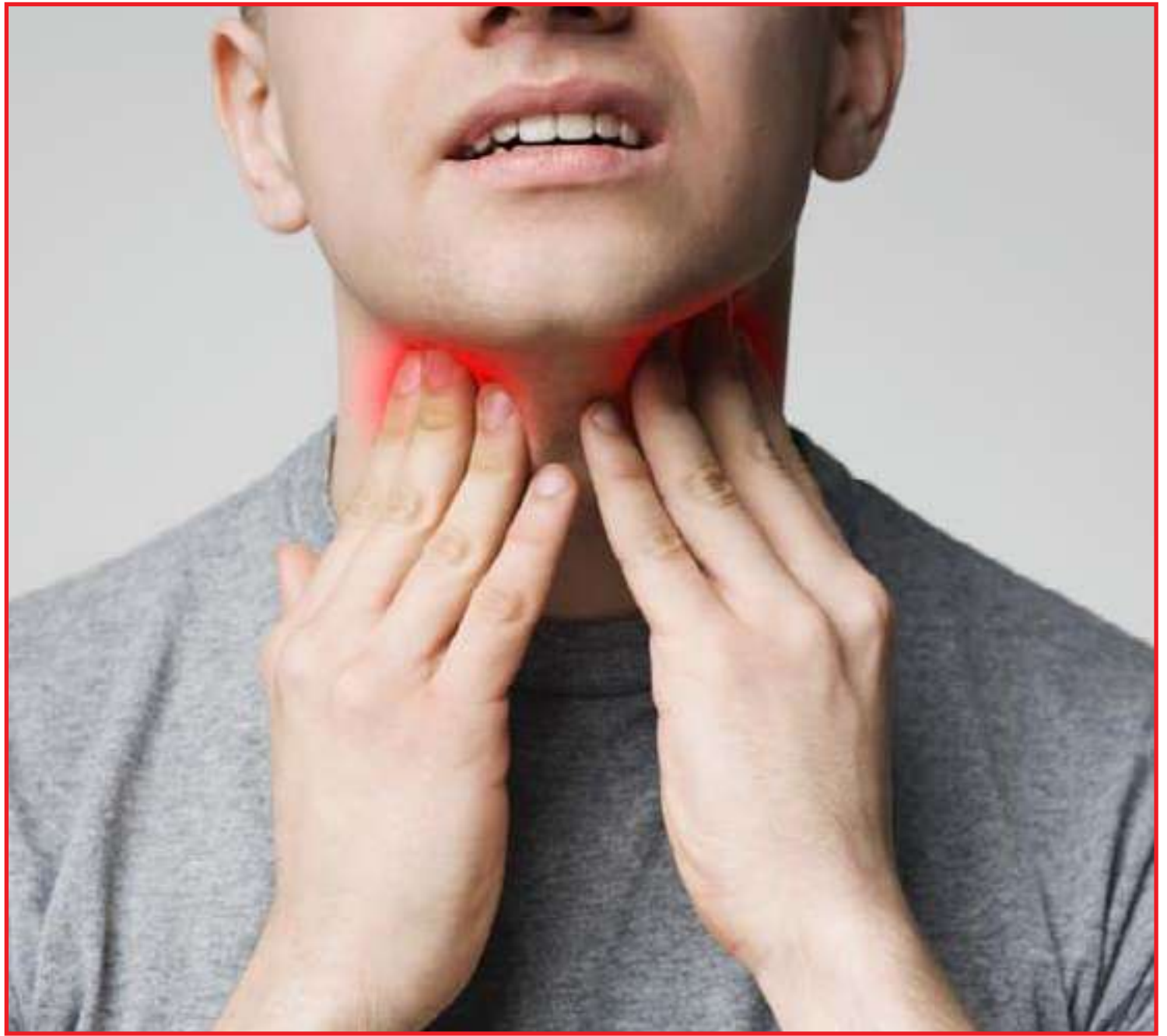
Médico explica que este tipo de câncer do sistema linfático é altamente curável

O 15 de setembro é o Dia Mundial de Conscientização sobre o Linfoma, oportunidade de falar com a população sobre a importância do diagnóstico precoce da doença.