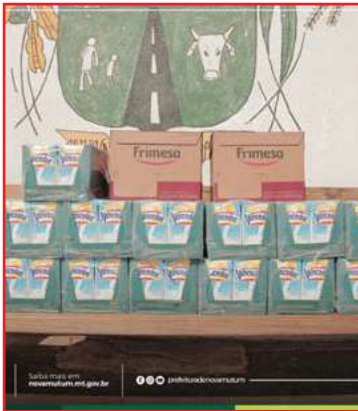
Leites foram arrecadados durante inscrição para o curso de arbitragem