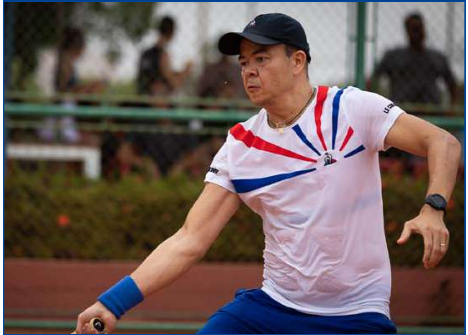
Etapa faz parte do Circuito Mato-grossense de Tênis