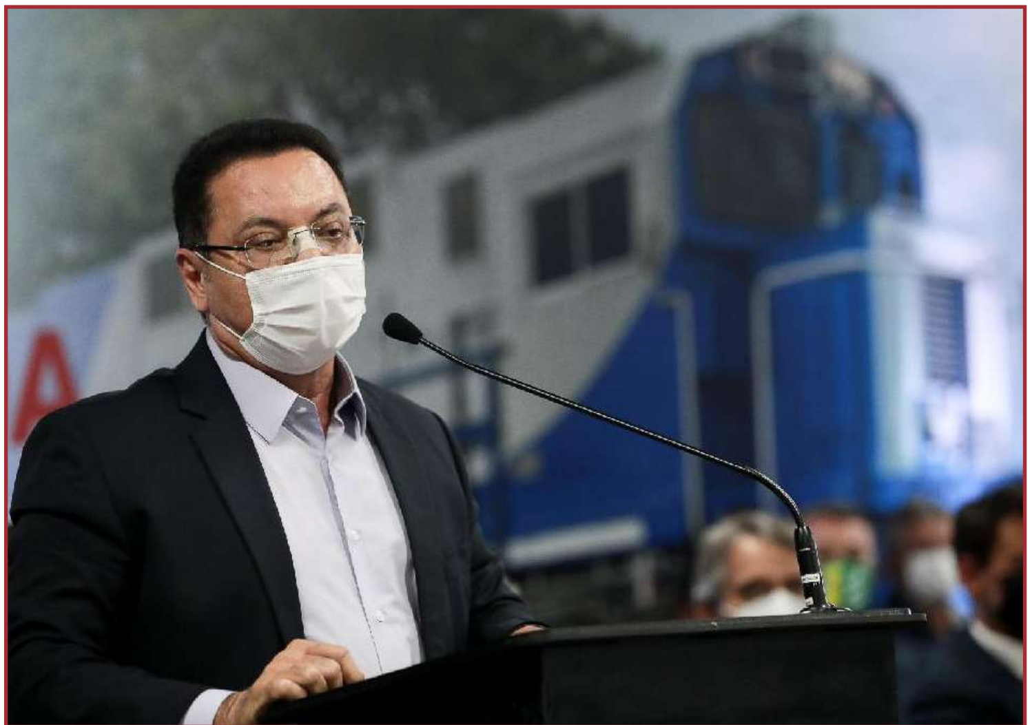
A previsão é que o trecho entre Rondonópolis e Cuiabá entre em operação em 2025

Uma vez implantada a ferrovia, a Rumo S/A fica autorizada a explorar a ferrovia pelo prazo de 45 anos, sendo que a infraestrutura ferroviária poderá ser compartilhada com outra empresa de transporte ferroviário que venha a prestar serviços no Estado. Ao menos 26 municípios que estão às margens do traçado da ferrovia serão beneficiados diretamente com a implantação da malha ferroviária.