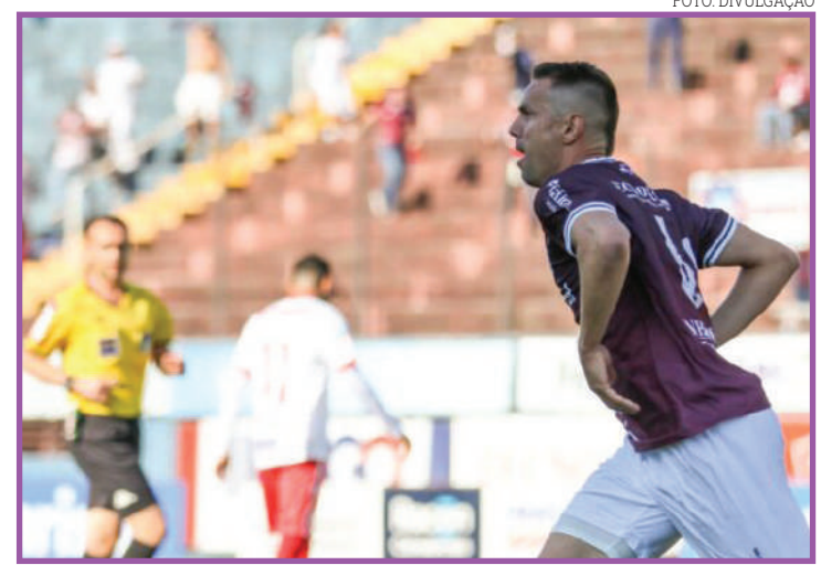
Colorado foi derrotado no jogo de ida das oitavas de final